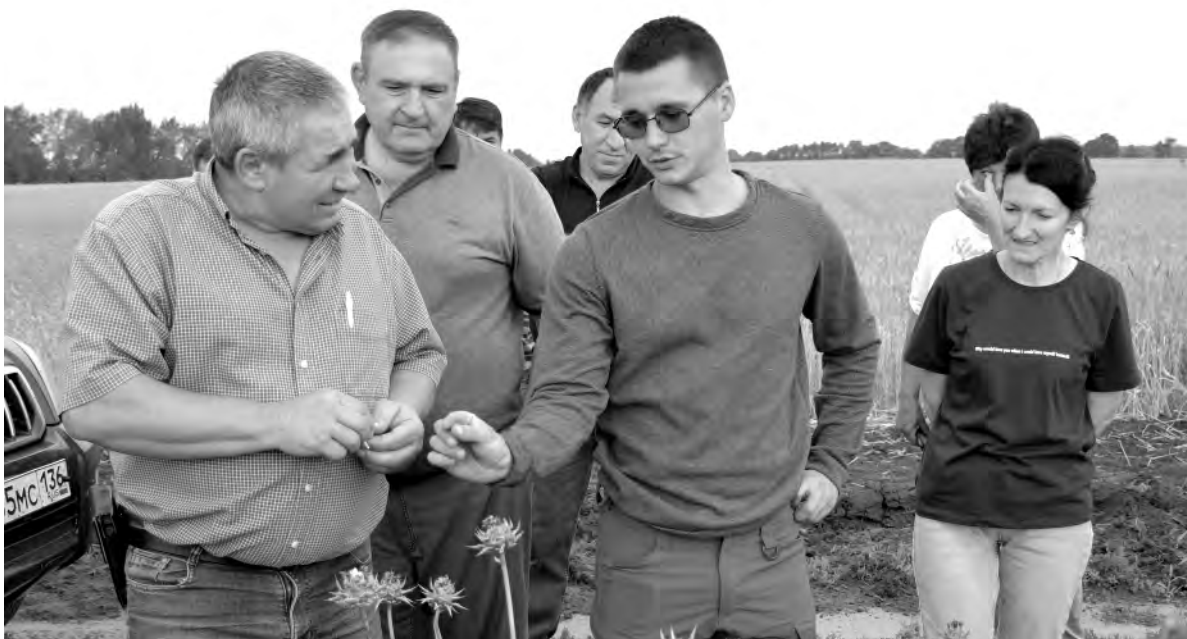
Многих участников объезда заинтересовала технология выращивания рапсовки.