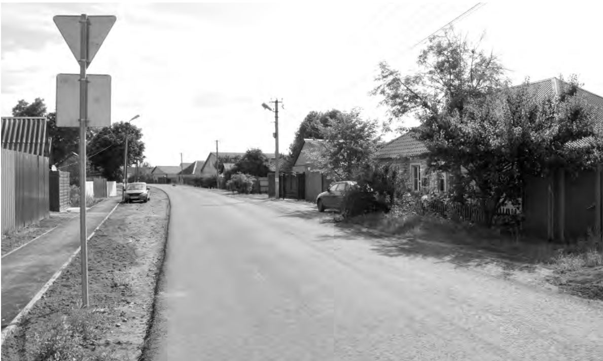
Это же место сейчас.