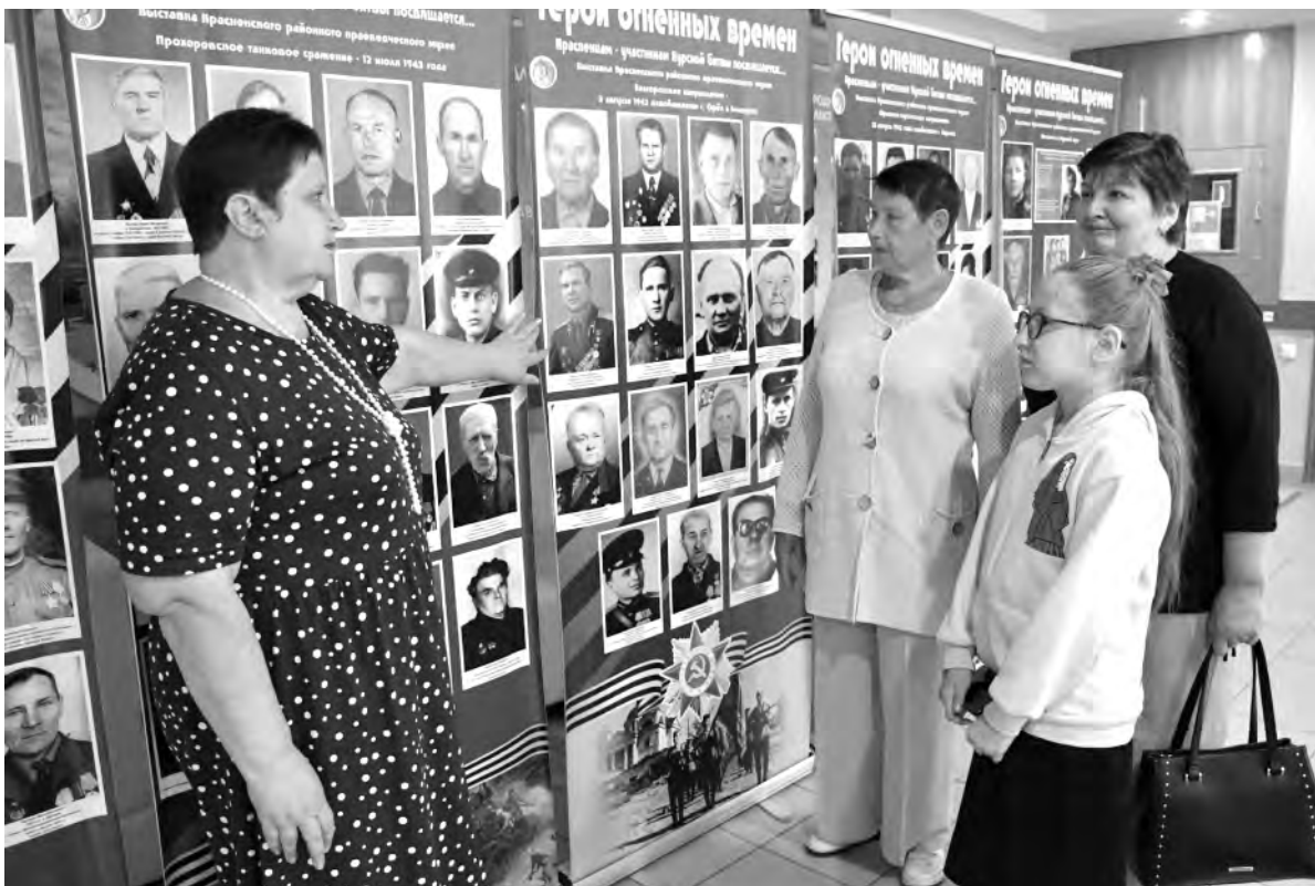
На выставке районного краеведческого музея представлены портреты всех красненцев, участвовавших в Прохоровском сражении.