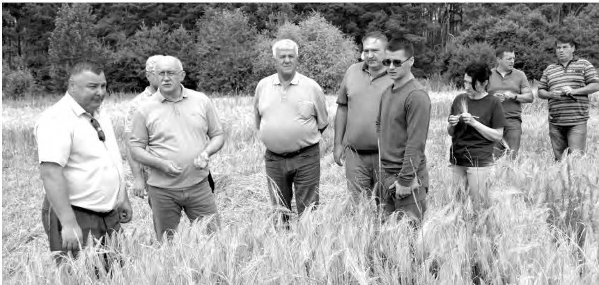
Комиссия отметила неплохие виды на урожай ячменя в ООО ПМТС «Красненское».