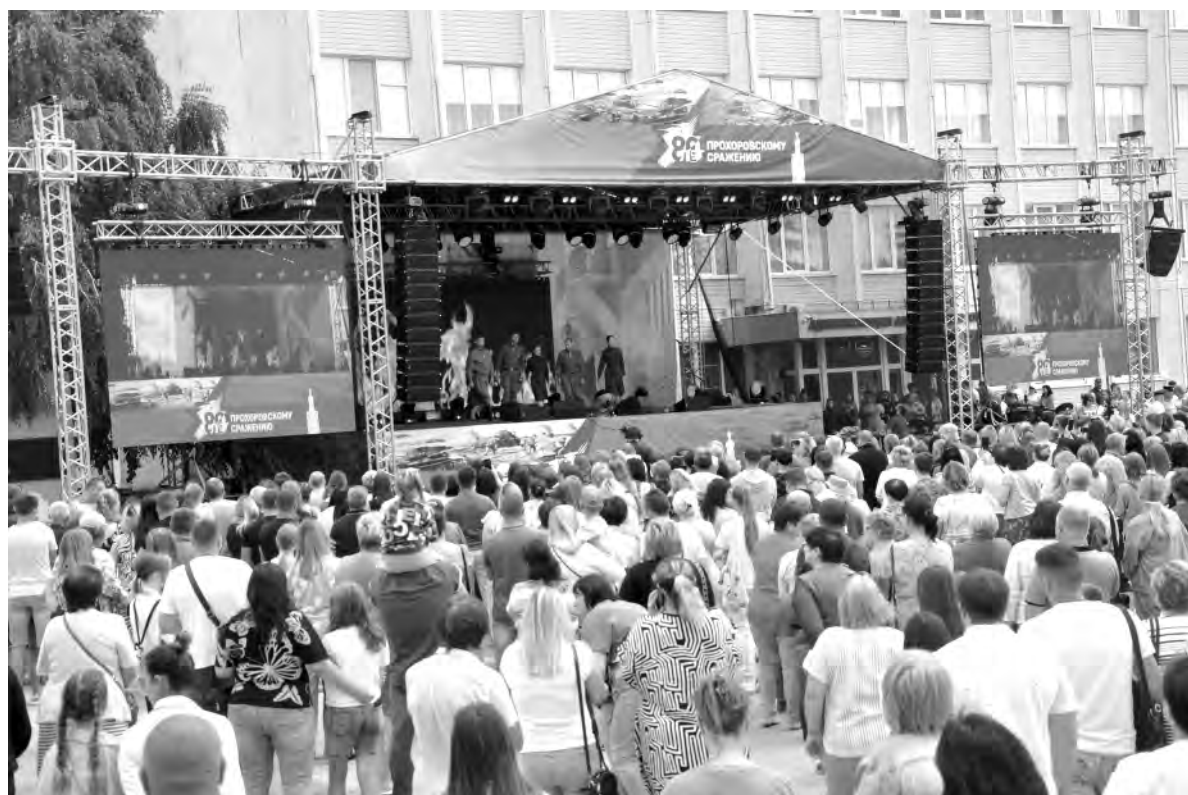
Сотни алексеевцев и гостей города собрались на площади, чтобы стать созерцателями концерта.

Вячеслав ГЛАДКОВ, губернатор Белгородской области.