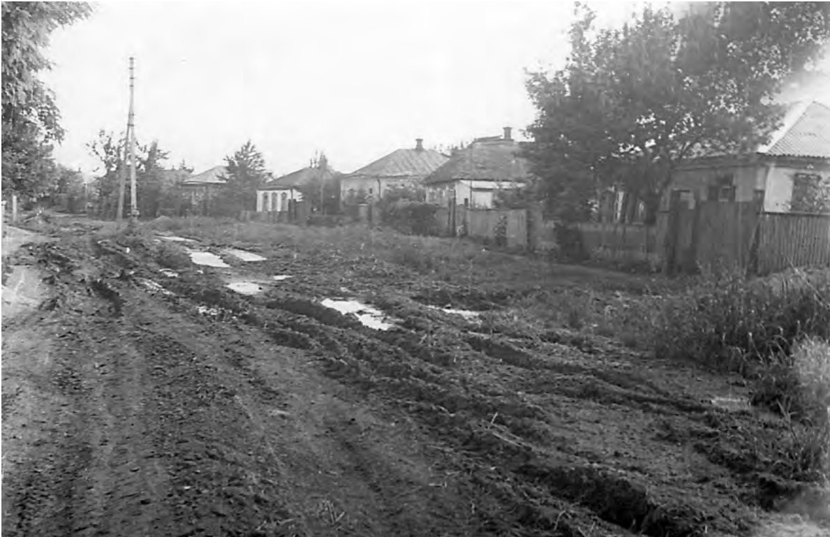
Улица Ольминского. 1970-е годы.