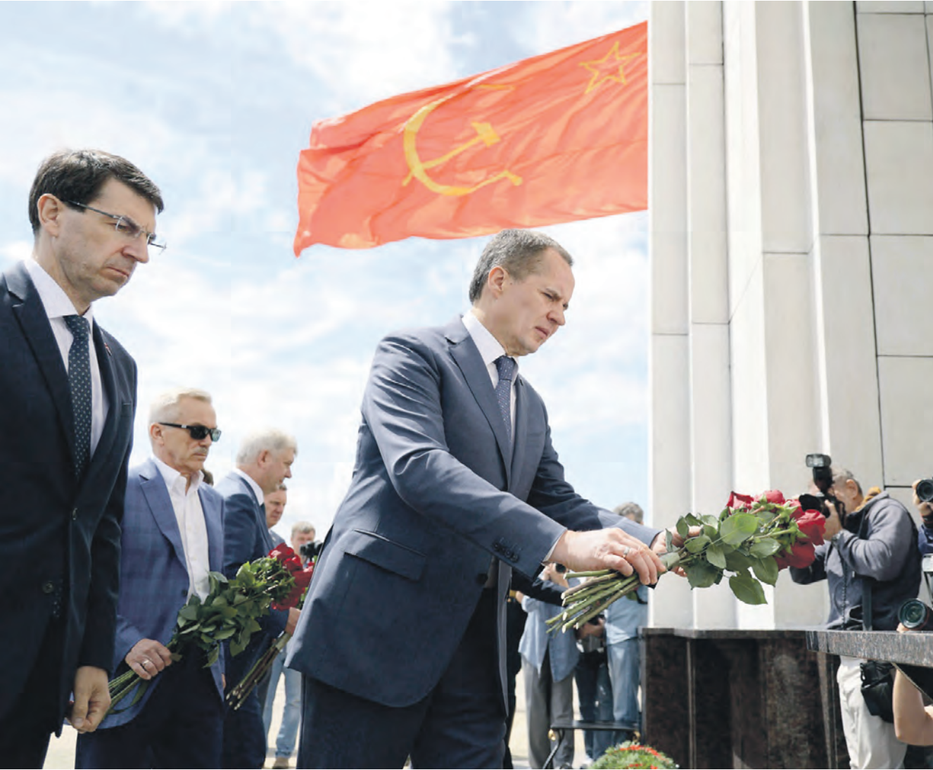
Губернатор Вячеслав Гладков и почётные гости возлагают цветы к Звоннице — основному памятнику мемориального комплекса «Прохоровское поле».