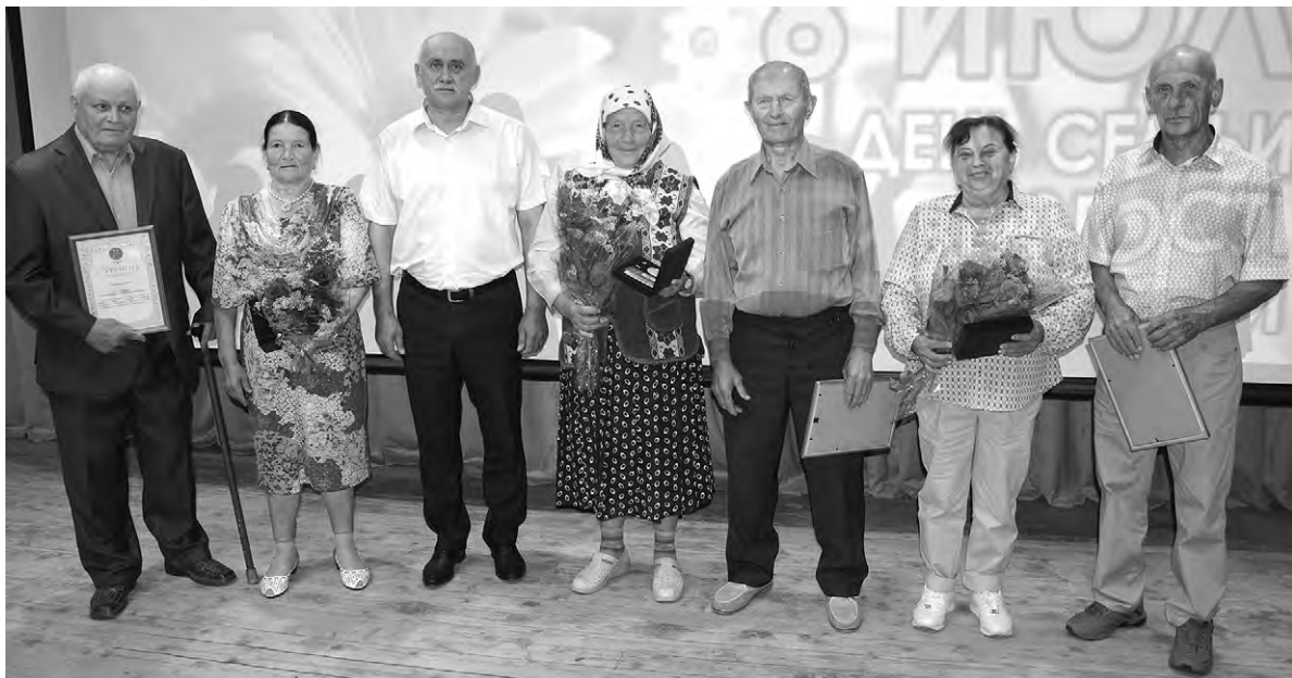
После вручения наград юбиляры супружеской жизни сфотографировались на память с главой администрации района Александром Полторабатько.