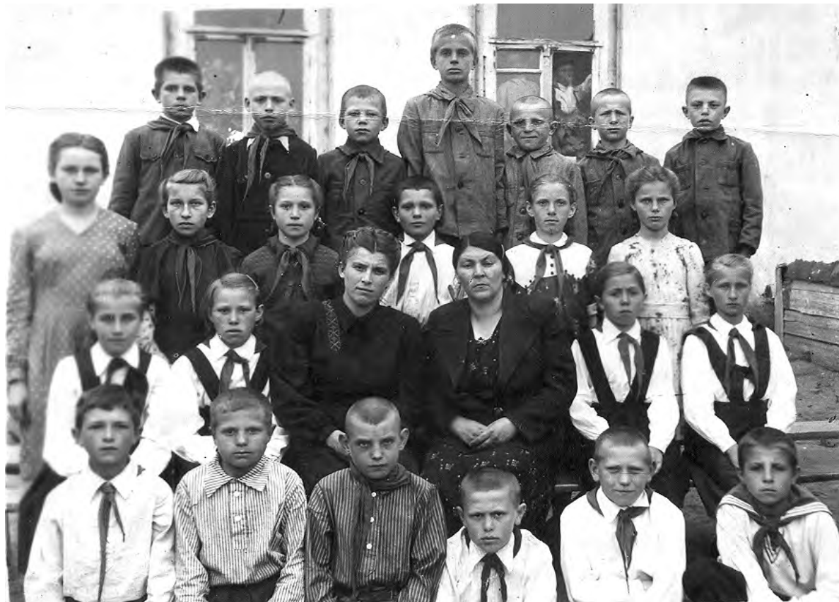
Ученики четвёртого класса начальной школы в 1951 году.

Четвероклассники уже повзрослели. Большинство из них приняты в пионеры, о чём гово-