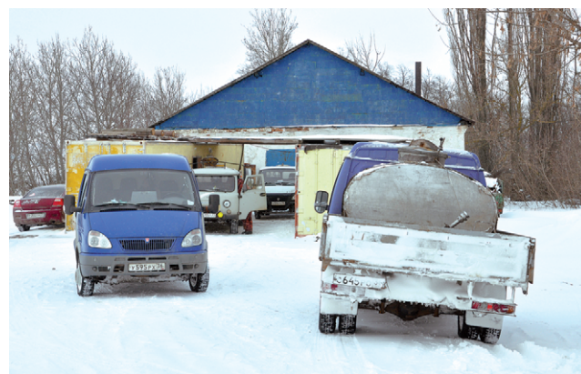
Очередь за молоком.