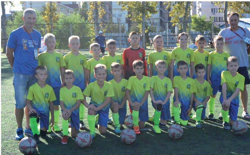
Успешно выступила юная «Слобода» в футбольном турнире в посёлке Витязево Краснодарского края.