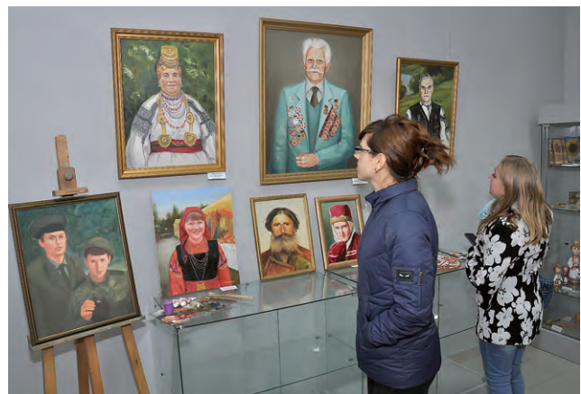
Посетители рассматривают экспонаты.