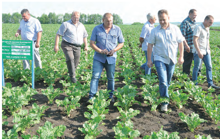
Осмотр свекловичного поля.