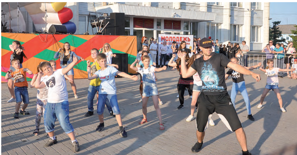
Флэш-моб от группы «6 POWER».