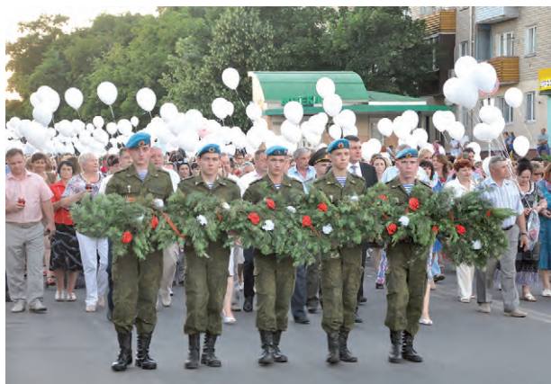
Соб. инф.

На снимке: во время проведения акции «Свеча Памяти» в Алексеевке.