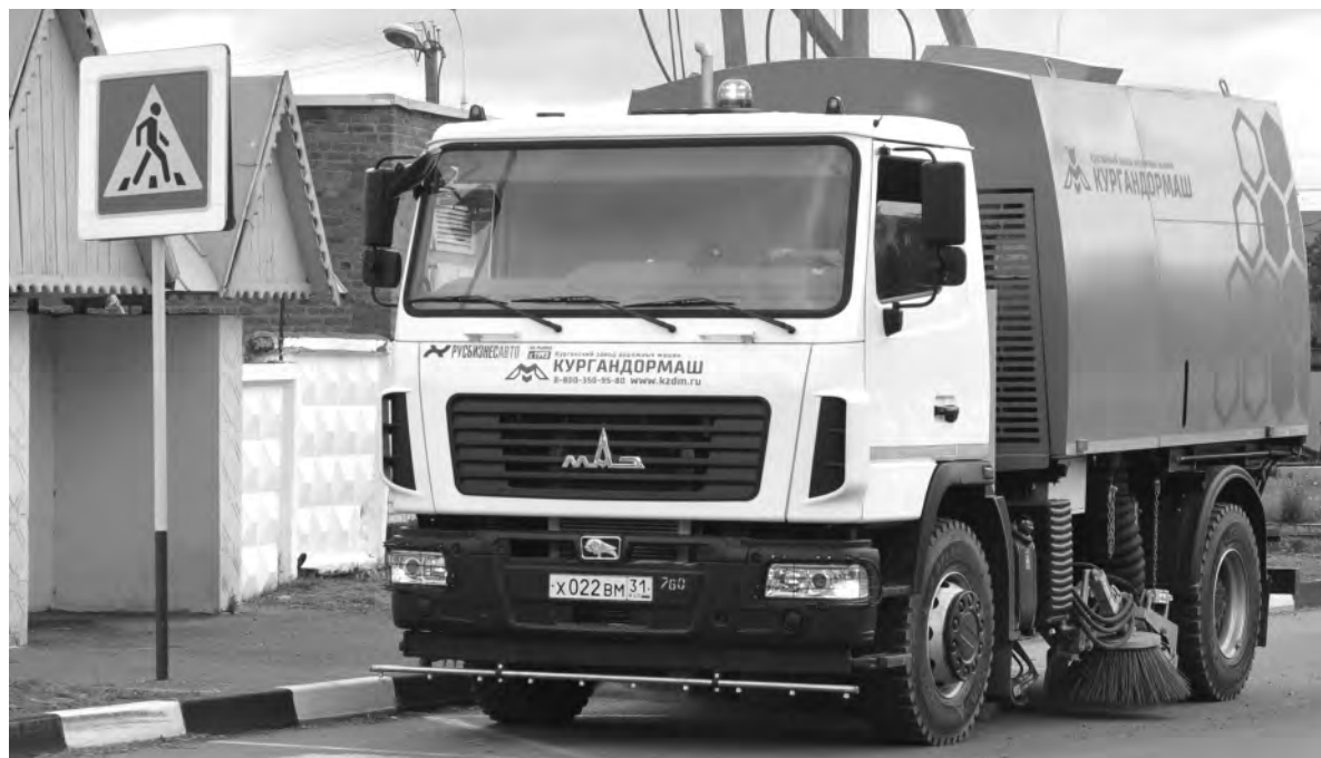
Новая техника для уборки улиц и дорог.