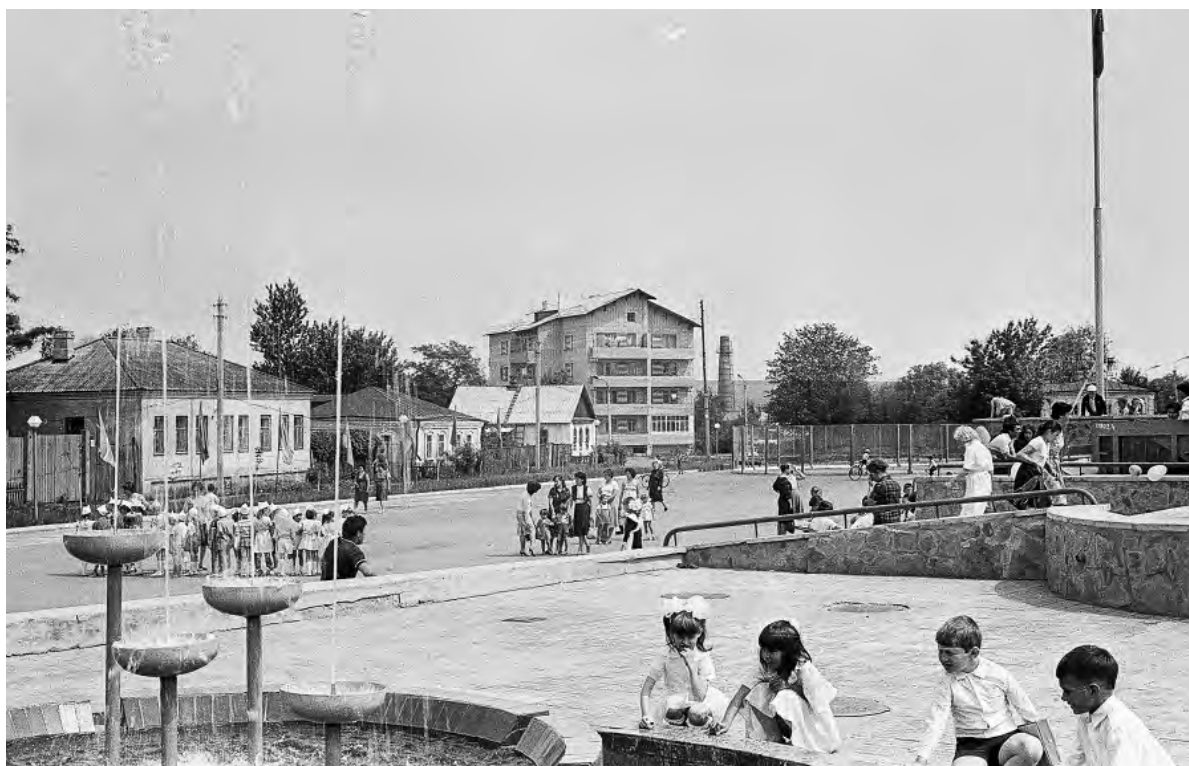
Никольская площадь (III Интернационала). Середина 80-х гг.