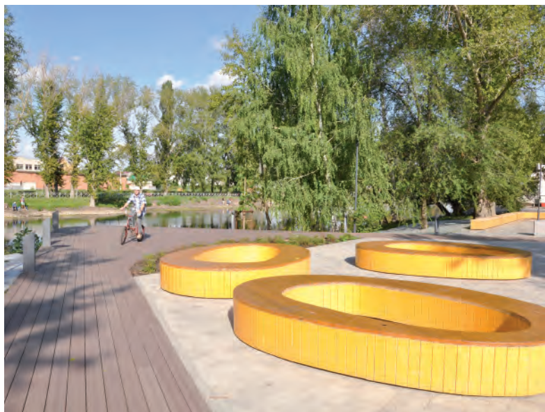
Овальные места для общения.