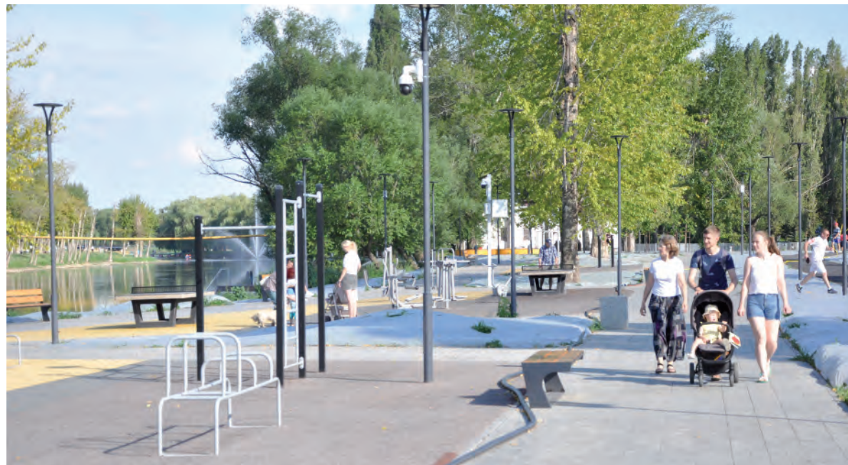
Прохожие с интересом поглядывают на спортивный уголок.

Заря Учредители: министерство общественных коммуникаций Белгородской области; администрация Алексеевского городского округа, администрация Красненского района Белгородской области, Совет депутатов Алексеевского городского округа Белгородской области, муниципальной совет муниципального района «Красненский район», АНО «Редакция газеты «Заря».