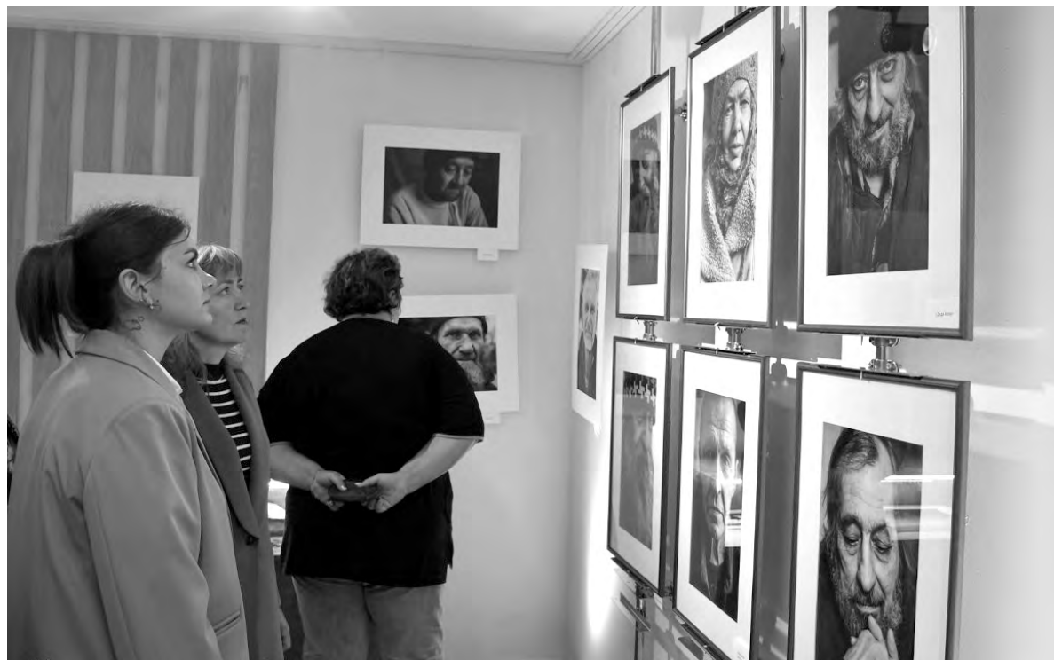
Особый интерес посетителей вызвали портреты.