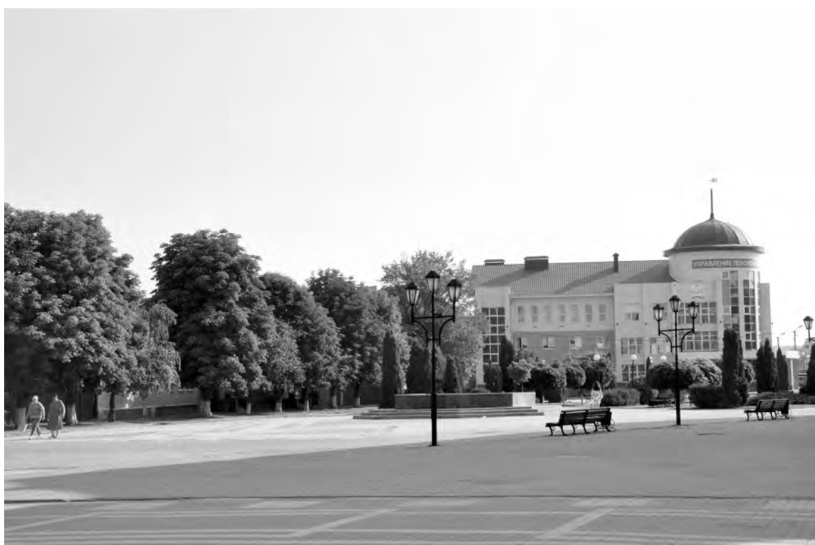
Это же место сейчас.