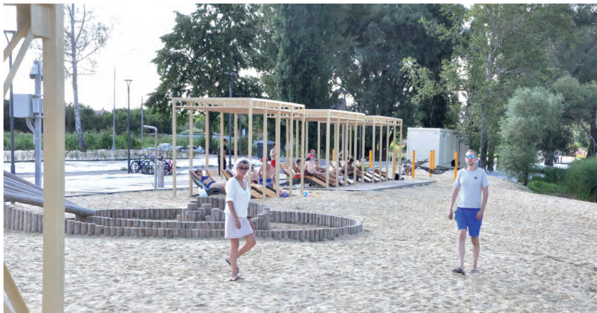
На пляже приятно пройти по тёплому песку.

Далее наступает наш черёд удивляться разнообразию элементов благоустройства. За мостиком через лагуну увидим пирс из палубной доски в форме треугольника. За зданием спортивно-патриотического клуба