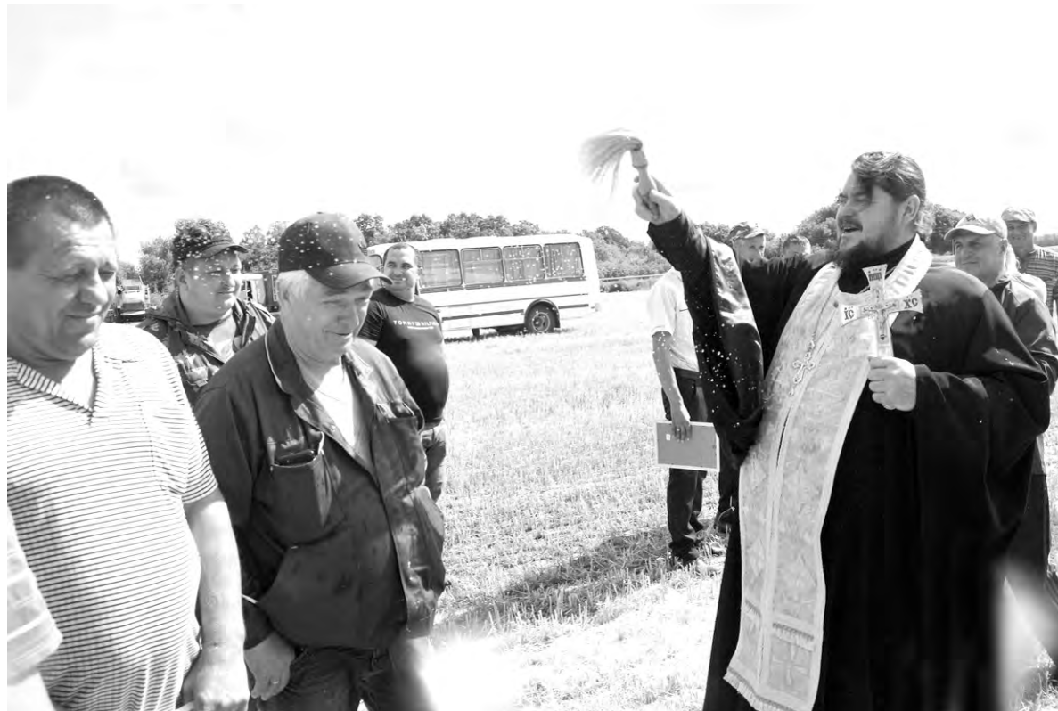
Благословение Божье и добросовестный труд каждого — главные условия качественного сбора урожая.

Вячеслав ГЛАДКОВ, губернатор Белгородской области.