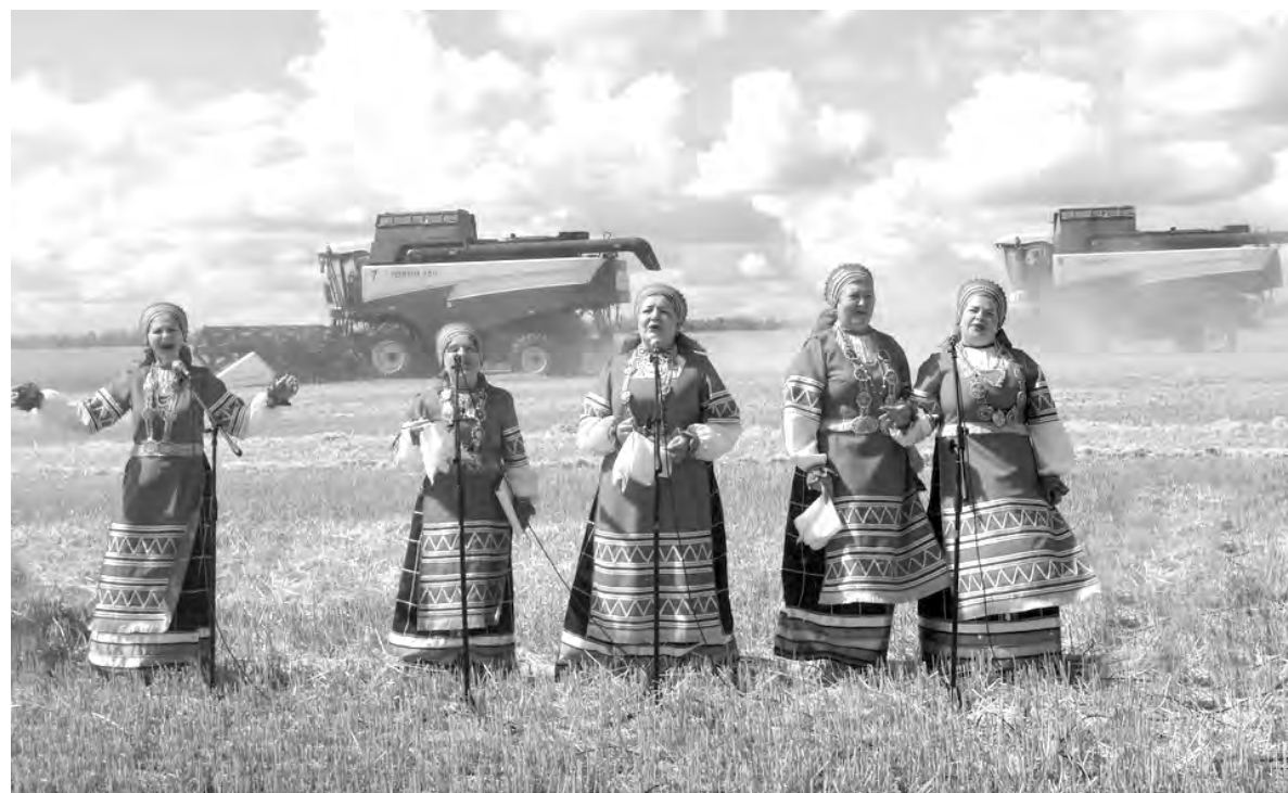
Несмотря на шум комбайнов, песня русская слышна.