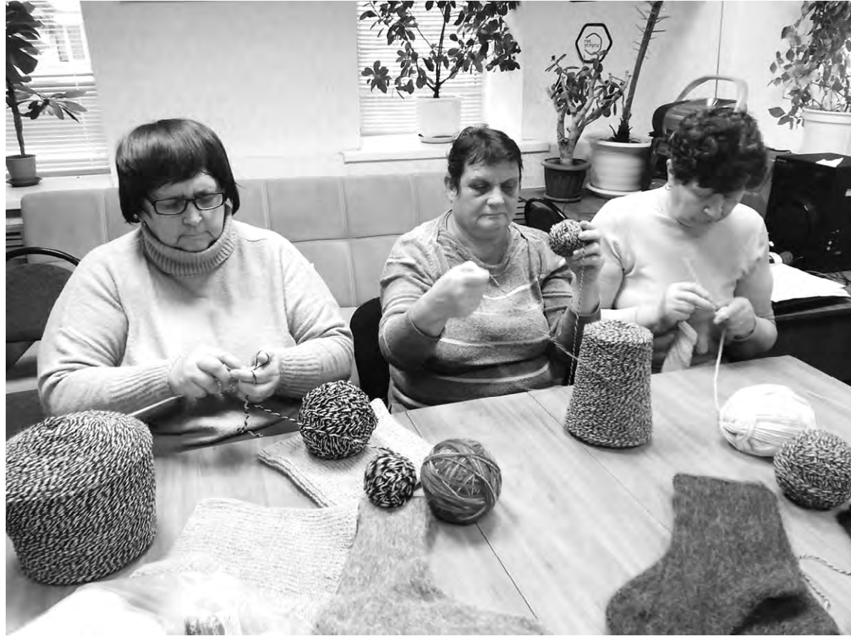
Участницы социальной гостиной «Вдохновение» за работой.