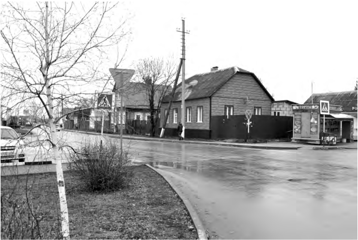
Это же место сейчас.