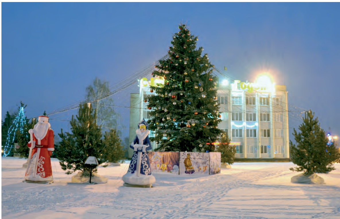
Новогодняя красавица ждёт своих гостей.

Беседовала Анна СПЕСИВЦЕВА.