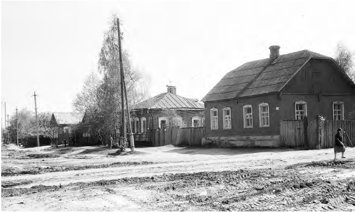
Ул. Ст. Разина. 1990-е годы.