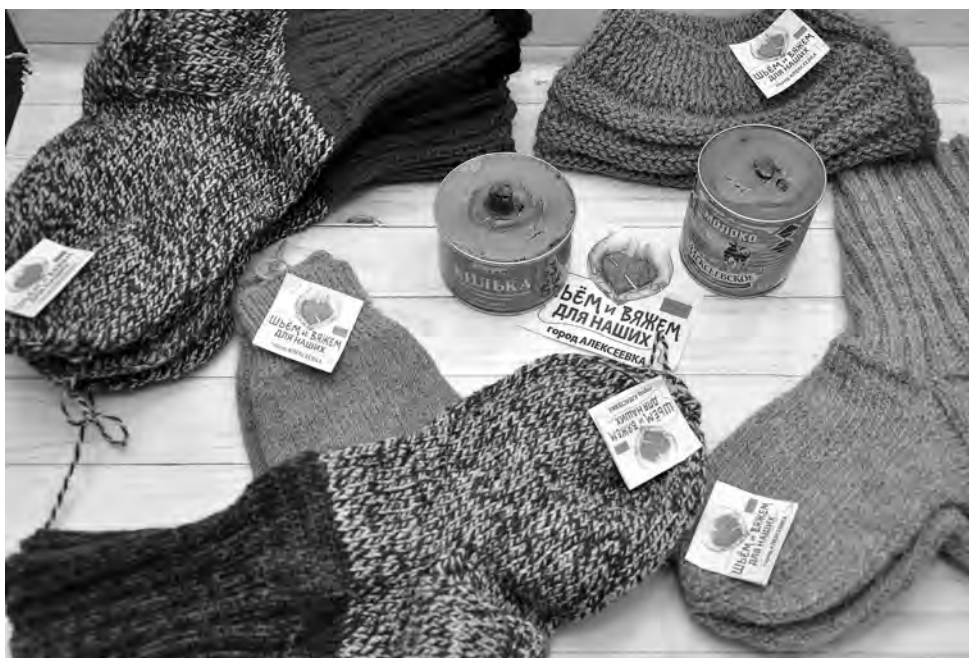
Те самые окопные свечи и носки для наших защитников.

Татьяна ДЕВИЦЫНА.