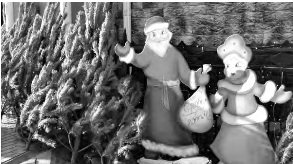
Ёлочный базар на ул. Республиканской привлекает покупателей.