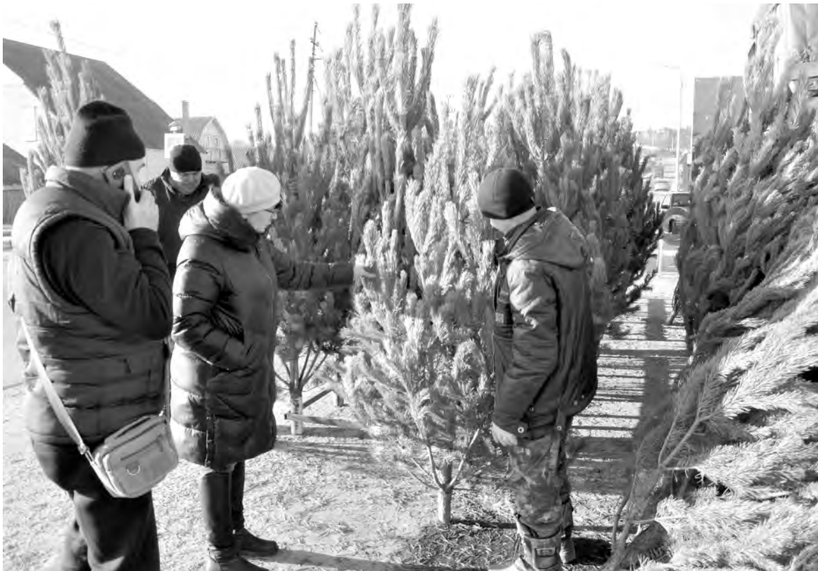
Пушистых красавиц, представленных на распродаже в районе храма Александра Невского, хватит для всех желающих!