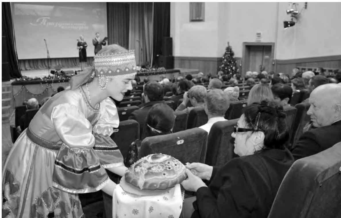
По русской традиции гостей праздника угощали душистым караваем.