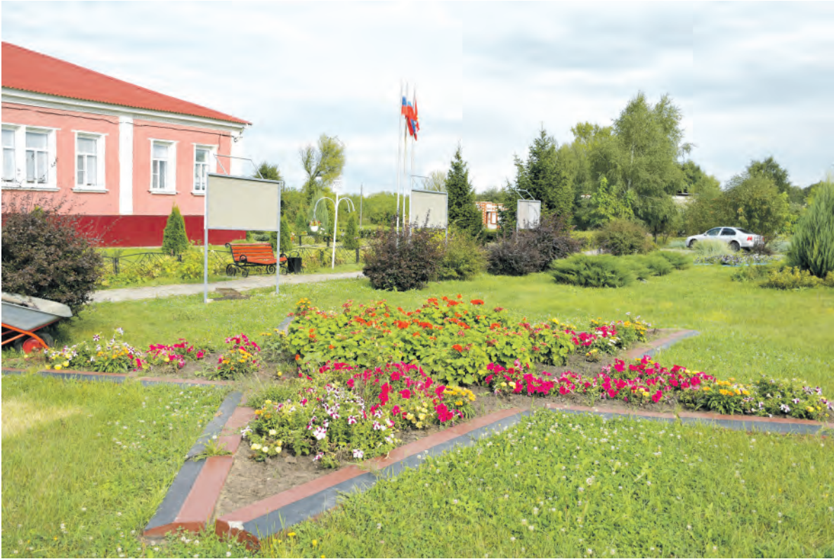
Центр села, как и всё поселение, благоустроен и красив.

К названным заботам можем добавить восстановление аварийной гребли на пруду в селе Староуколово, а также запланированную очистку водоёма в Новоуколове по областной программе «Чистые реки». Местные единороссы выиграли конкурс первичных отделений партии, благодаря которому установят уличные стенды под названием «История в лицах». В следующем