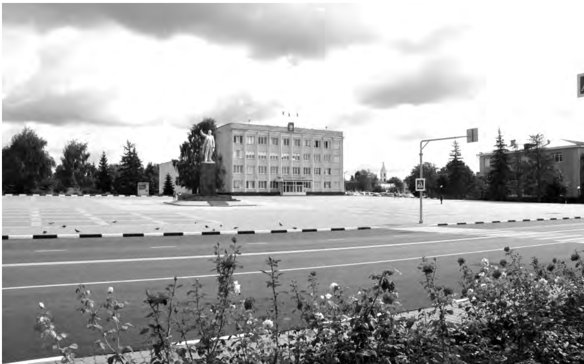
Это же место в наши дни.