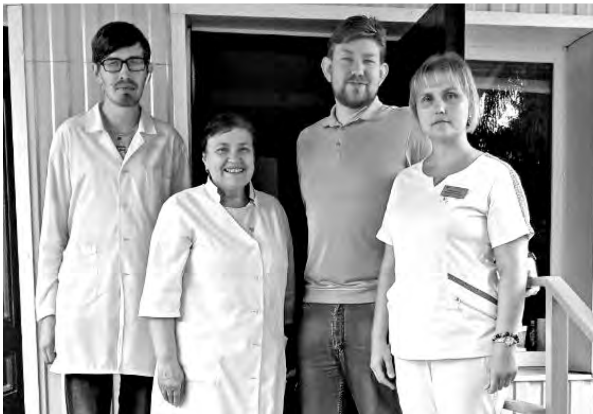
Местный «Поезд здоровья» в составе красненских врачей сделал остановку в Горкинском ФАПе.