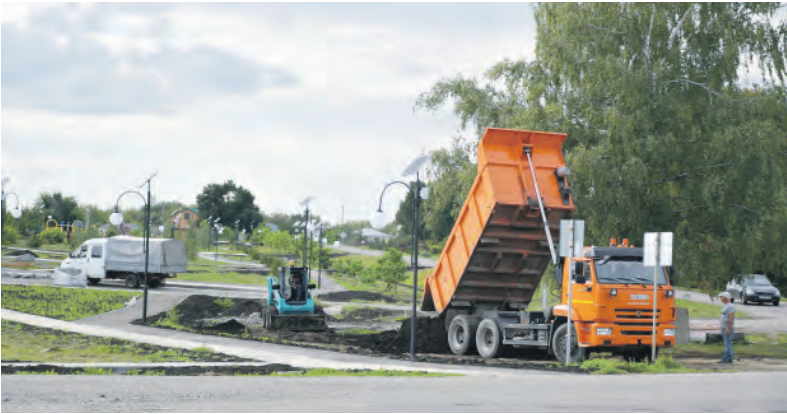
Работы в парке «Территория детства» идут полным ходом.