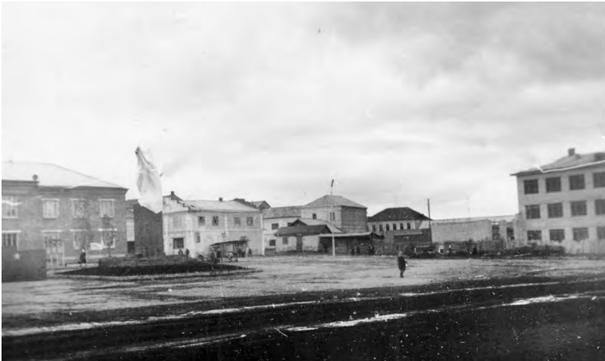
Площадь Победы. 1968-й год.