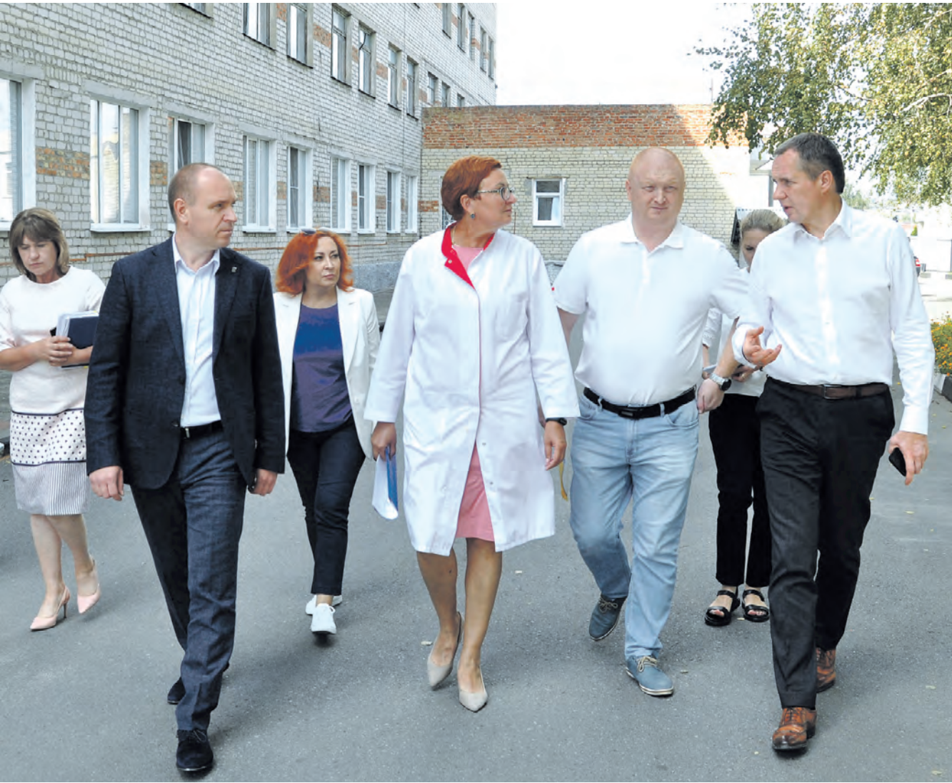
Делегация во главе с губернатором на территории Центральной районной больницы.