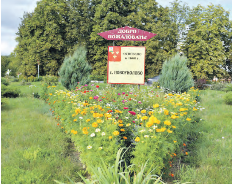
Одна из цветочных композиций.