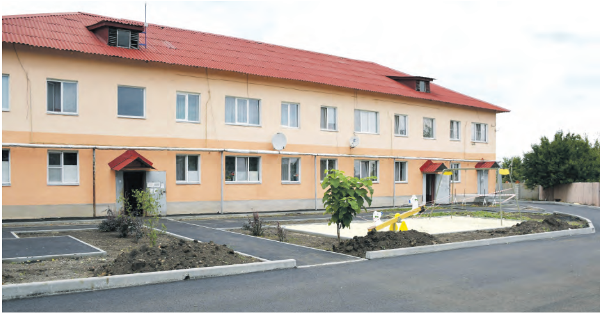
Преображённый двор многоквартирного дома по улице Юбилейная.

году новоуколовцы планируют сделать торшерное освещение от учреждения культуры до центра села, а в парке установить площадку для малышей. Пусть всё получится!