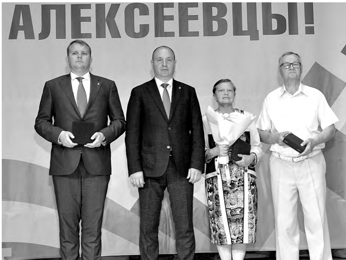
После вручения медали «За заслуги перед Землёй Алексеевской».

Вячеслав ГЛАДКОВ, губернатор Белгородской области.