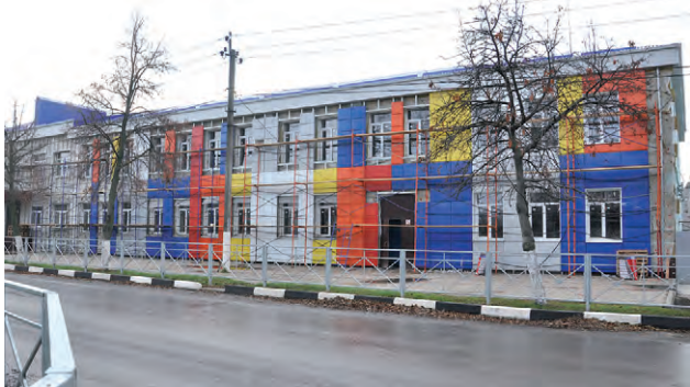
Соб. инф.

В ходе капитального ремонта городской средней школы № 2 преобразуются внутренние помещения, изменяется внешний вид. На снимке: идут работы по облицовке наружных стен из металлических листов разного цвета: белого, жёлтого, оранжевого, красного, синего. Таков дизайн по проекту, предполагающему придать учебному заведению заметный, «весёлый» вид.