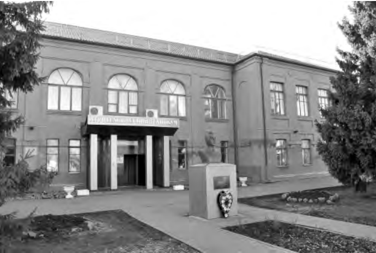
Агротехнический техникум сегодня.