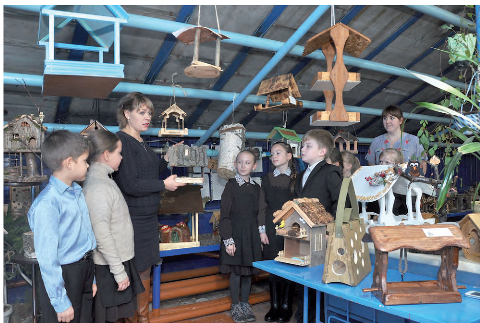
Посетители выставки были в восторге от такой красоты.