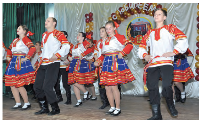
Ансамбль «Василёк» — славное «дитя» учебного заведения.