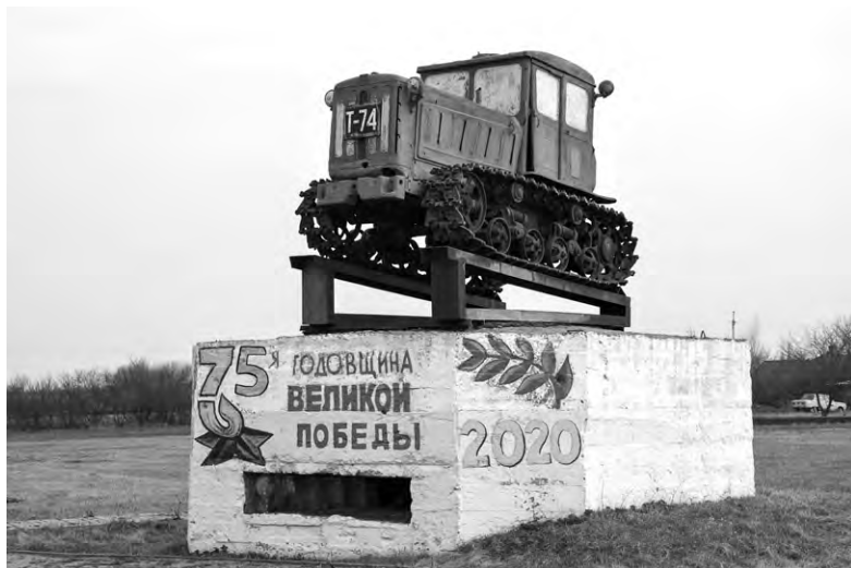
На одном из дотов возле села Круглое установлен старейший Т-74. Оба напоминают о временах давно минувших дней.