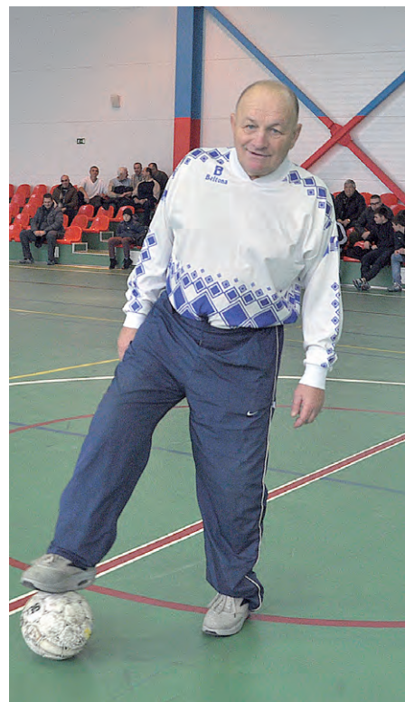
Символический первый удар по мячу перед матчем сделал юбиляр.

— 6:5 — было бы красиво! Анатольевичу же 65 — те