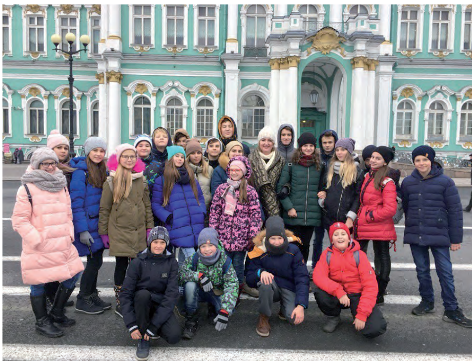
Ребята из «Вдохновения» на фоне Зимнего дворца. Поездка в Питер надолго запомнится юным алексеевцам.