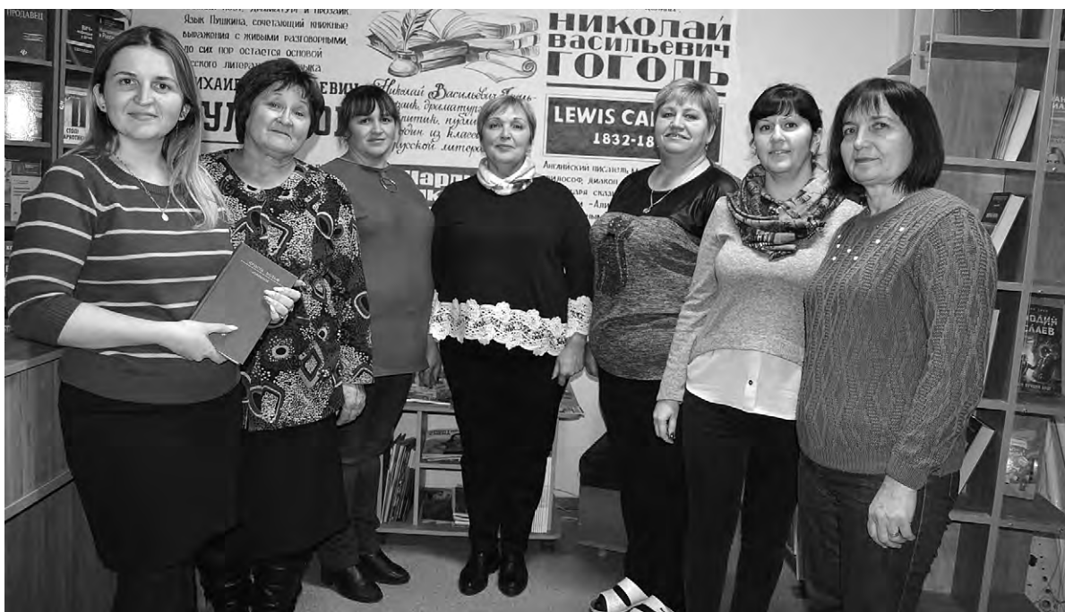
Первая запись в инвентарной книге учёта книжного фонда сделана 14 января 1944 года. С тех пор красненские библиотекари ведут летопись своего учреждения.