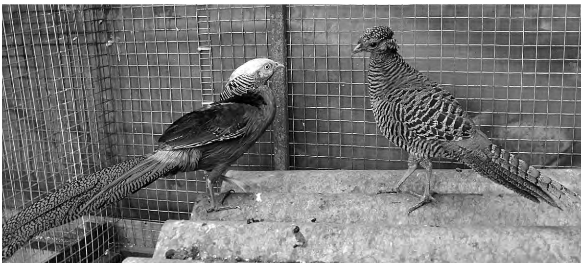
Золотой и серебряный фазаны прекрасно уживаются друг с другом.