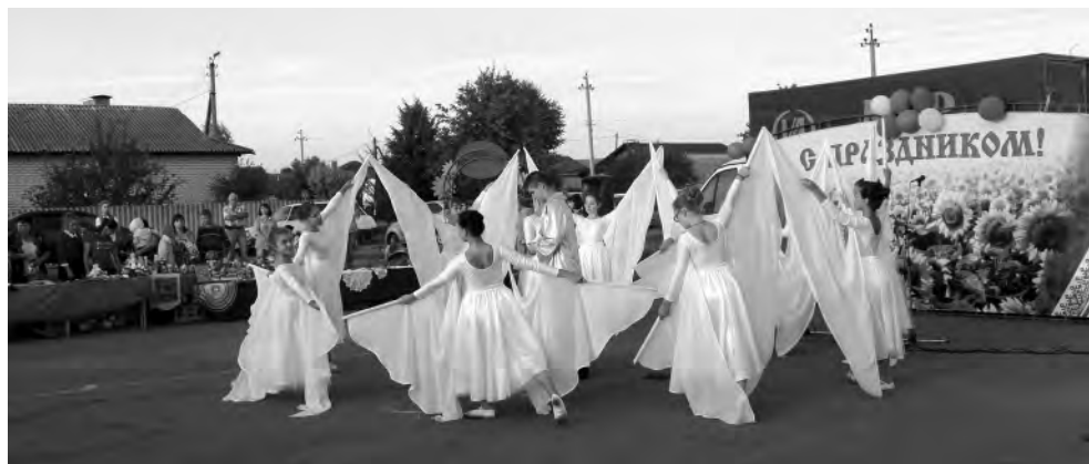
Украшением праздника стало выступление студии эстрадного танца «АпСент».