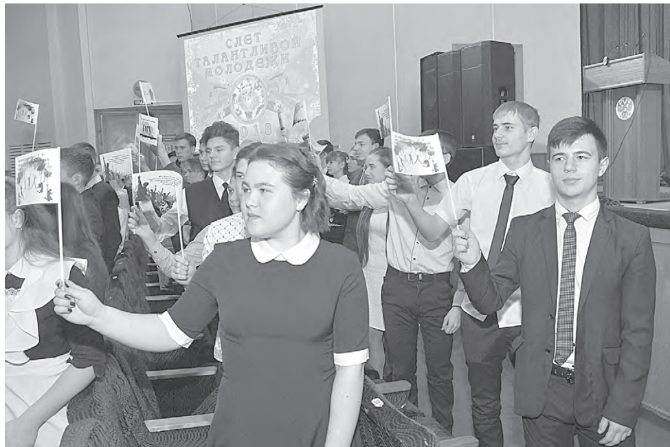
Десятки талантливых алексеевцев «слетелись» в «Солнечный».