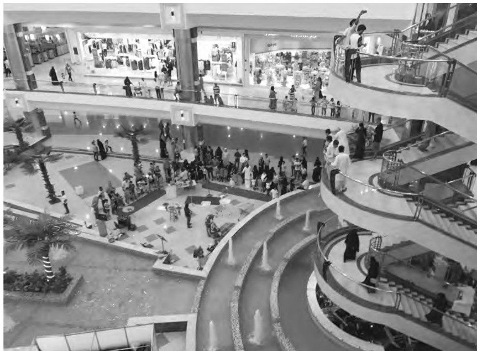
Торговый центр в Саудовской Аравии.