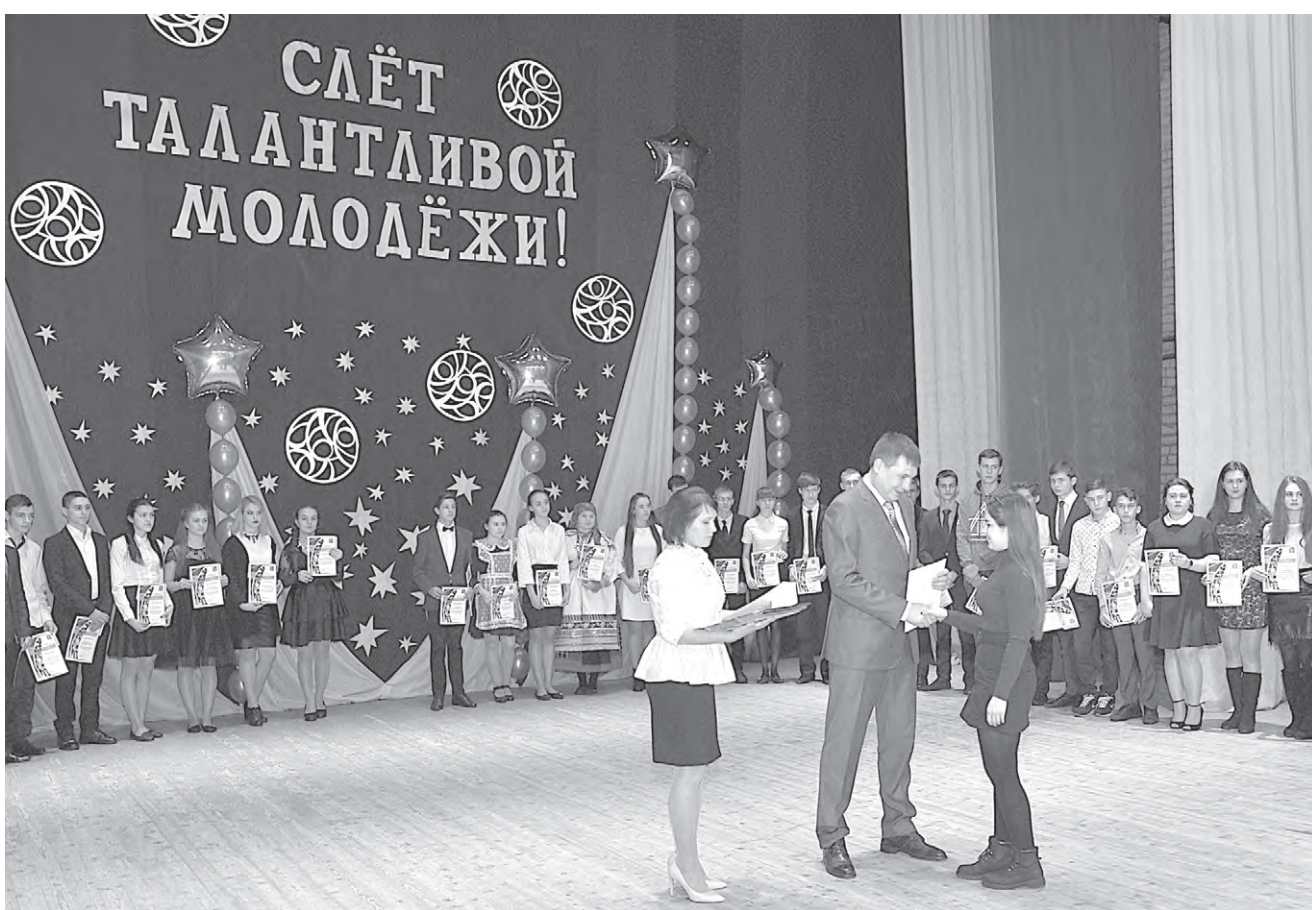
Волнительный момент на сцене.