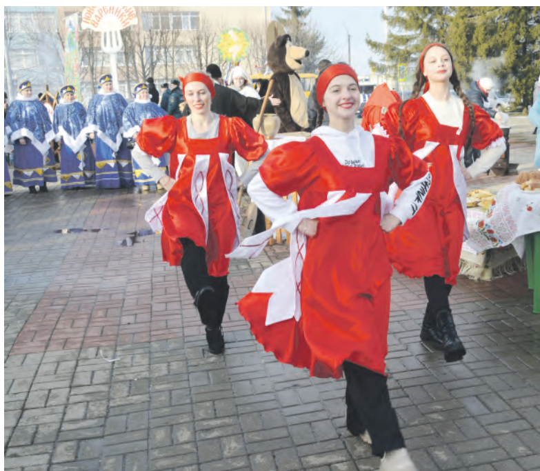
Яркая презентация Горкинской делегации.