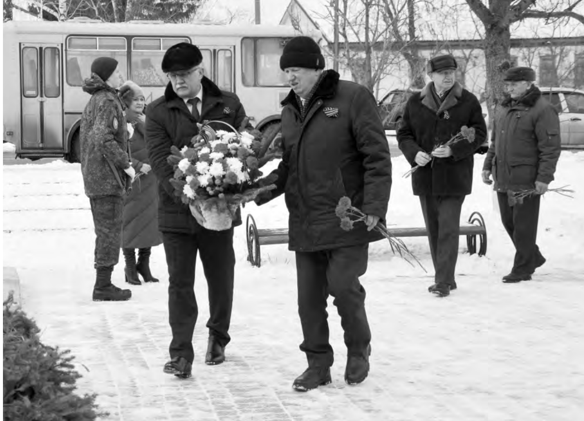
Момент возложения цветов к братской могиле в райцентре Красное.

— День освобождения района от немецко-фашистских захватчиков — особая дата, которая олицетворяет возрождение родного края, мужество и героизм участников Острогжско-Россошанской операции. Мы склоняем головы перед памятью погибших героев и благодарны тем, кто восстанавливал родной край в послевоенные годы. Пока мы уважаем историю нашего Отечества, мы остаёмся сильной нацией, способной выдержать любые испытания. Пусть память о подвиге нашего народа живёт в добрых делах, даёт силы и мужество достойно продолжать традиции отцов и дедов, приумножать богатство родной земли, обеспечивать её благопо-