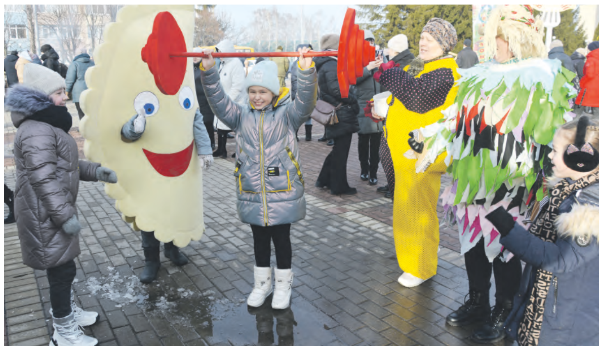
Забавы для детей организовали работники Центра культурного развития «Радужный».

Заря Учредители: министерство общественных коммуникаций Белгородской области; администрация Алексеевского городского округа, администрация Красненского района Белгородской области, Совет депутатов Алексеевского городского округа Белгородской области, муниципальный совет муниципального района «Красненский район», АНО «Редакция газеты «Заря».