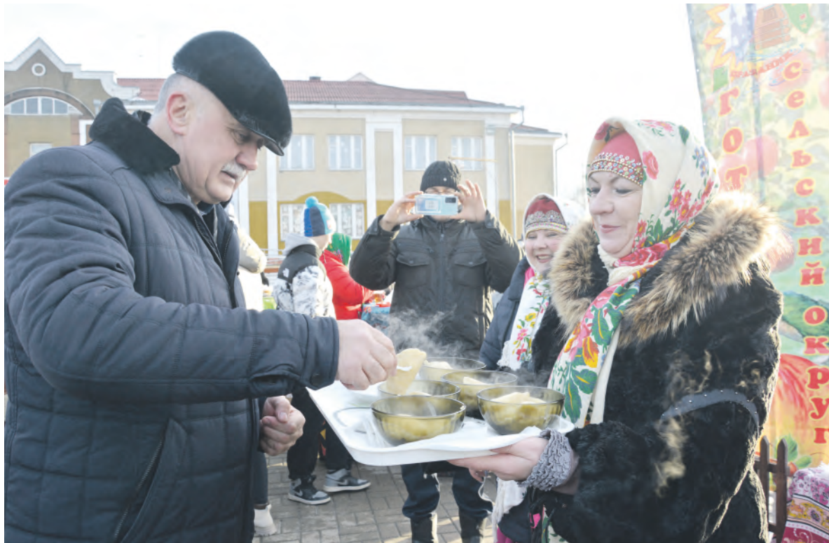
Готовчане угощают главу администрации района Александра Полторабатько горячими варениками.