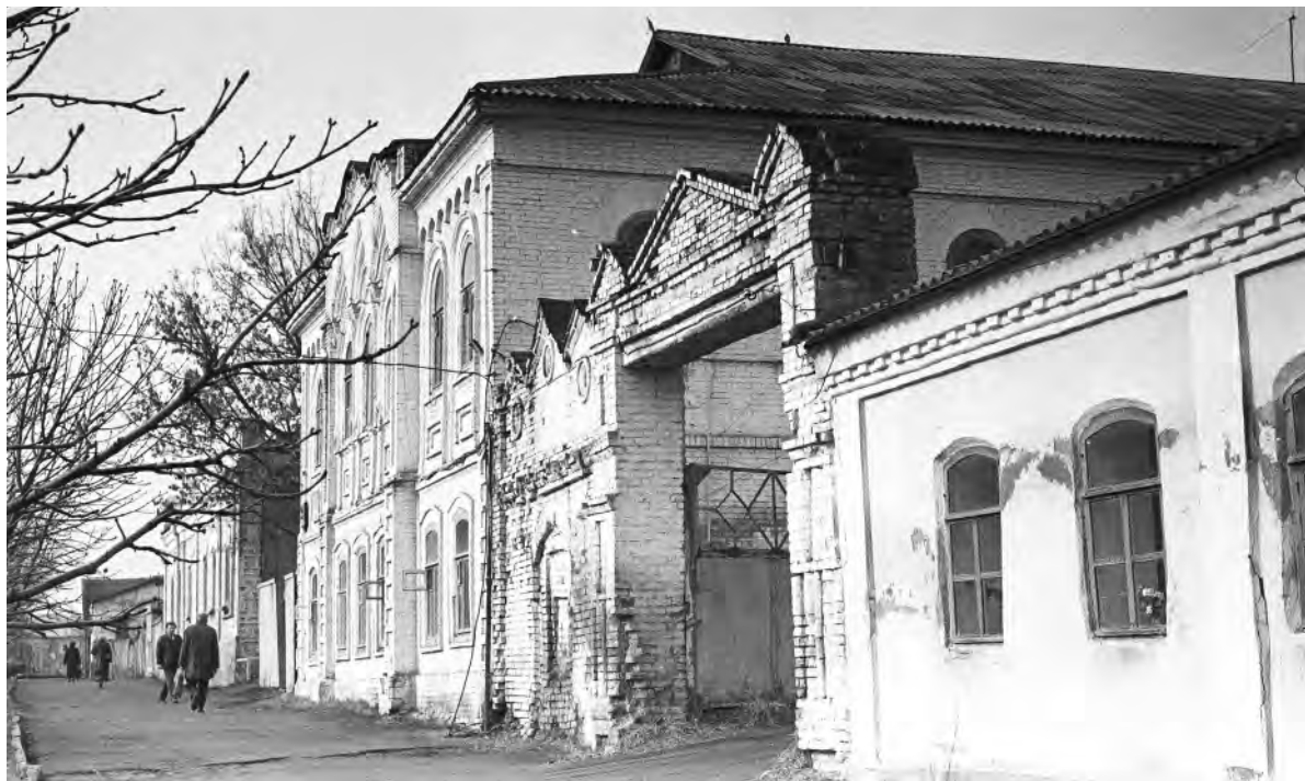
Ул. Мостовая (К. Маркса). 1990-е годы.