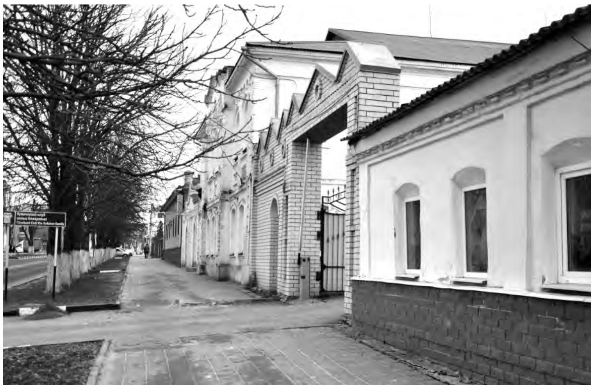
Это же место сейчас.