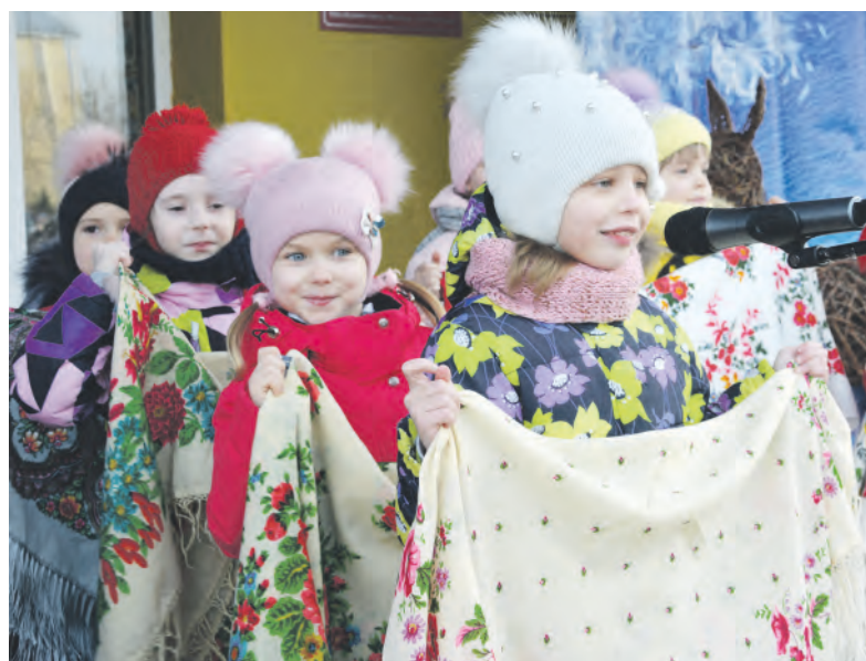
Юные красненцы приобщаются к народным традициям.