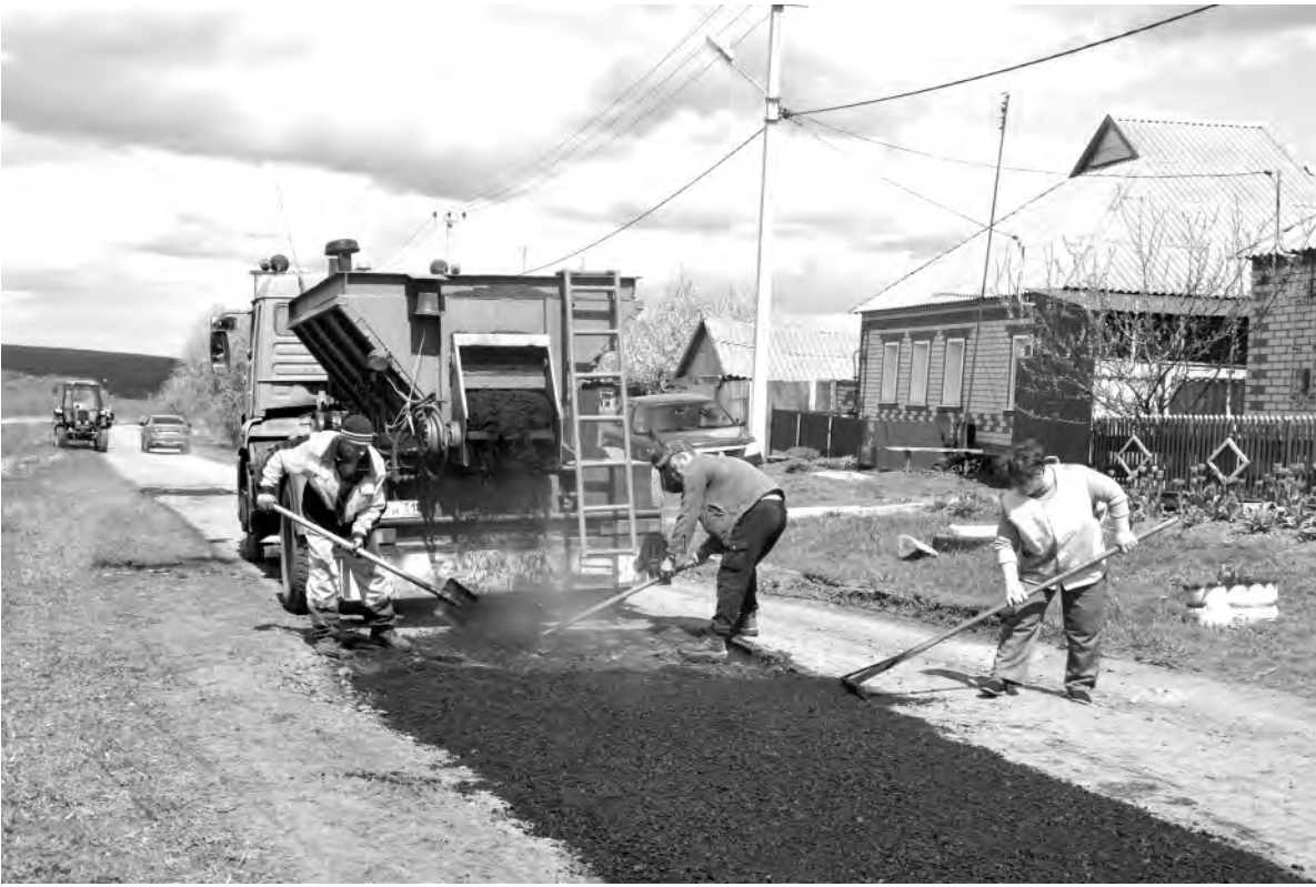
Качественный ремонт и строительство дорожного полотна обеспечивает безопасность и комфорт передвижения жителей района.