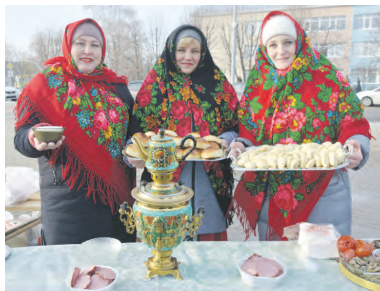
Гостей встречают представители Кругловской сельской территории.