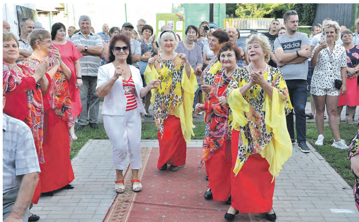
Зрители «зажигают» на фестивале «Играй, гармонь, любимая!».