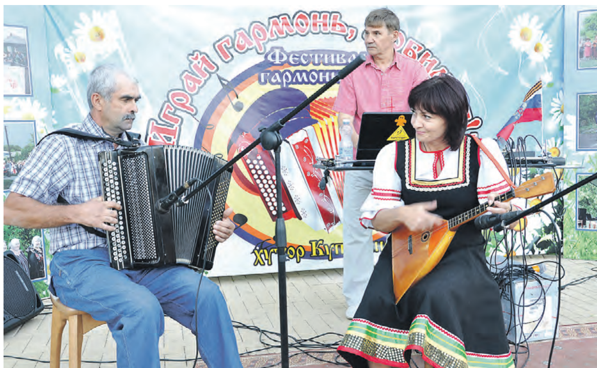
Исполняется фестивальный номер на сцене в Куприянове.

На празднике чествовали родителей малышей — буду-