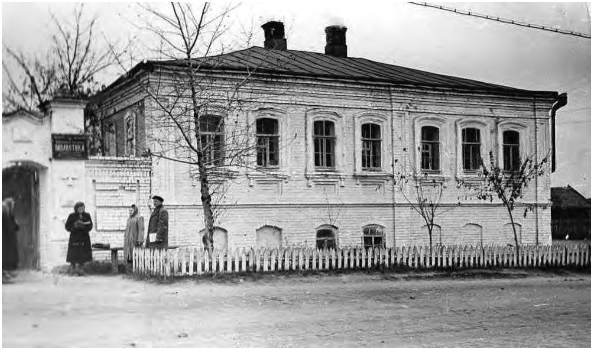
Городская библиотека на ул. К. Маркса (ныне Мостовая) 1960-е гг.