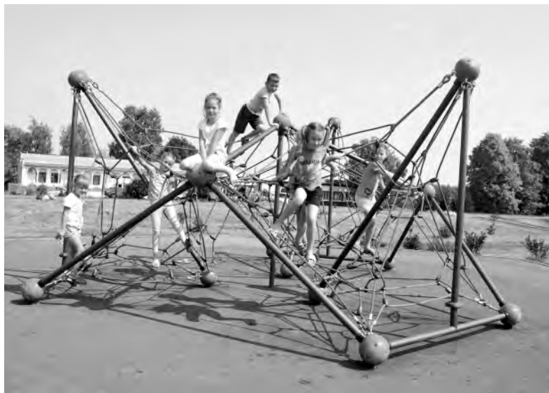
Игровой комплекс в Новоуколове появился благодаря проекту.

Родители как настоящих, так и будущих школьников вникали во все этапы благоустройства образовательных учреждений. Молодые мамы и бабушки выбирали, где будут размещены детские площадки, предлагали свои варианты. Жители улиц озвучивали, какими должны быть тротуары и многое другое,