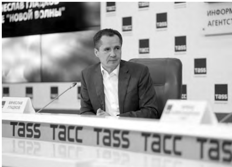
Руководитель региона Вячеслав Гладков во время пресс-конференции.

Вячеслав Гладков заявил, что по итогам 2020 года валовой региональный продукт в области составил 920 млрд рублей — регион третий в Центральном федеральном округе и 19-й в России по этому показателю. К 2030 году власти справятся с удвоением ВРП — это главная задача для Белгородской области на ближайшее десятилетие.