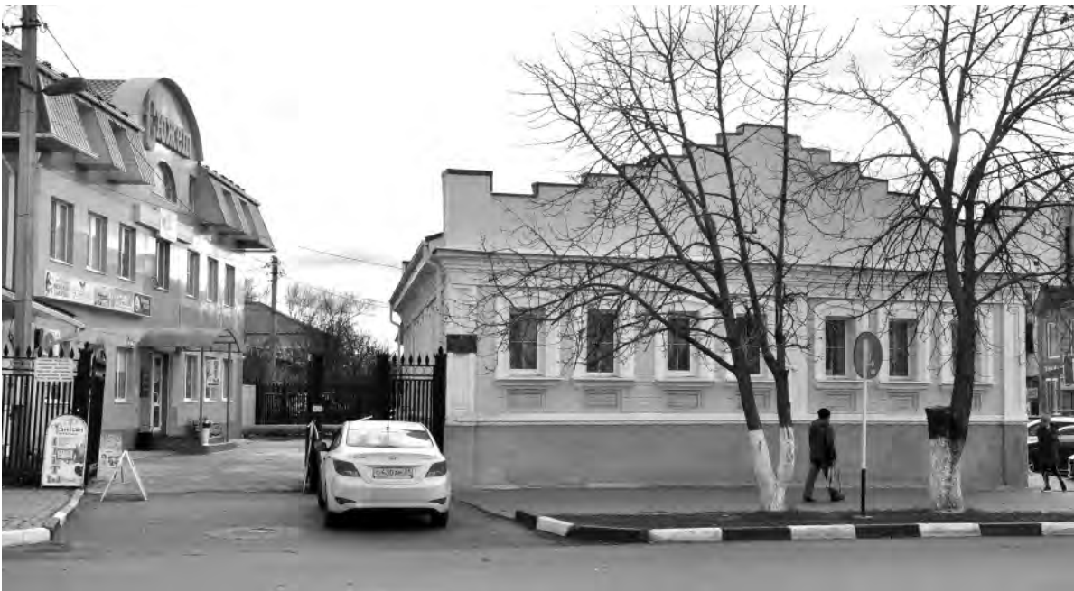
Городская библиотека № 1. Наши дни.