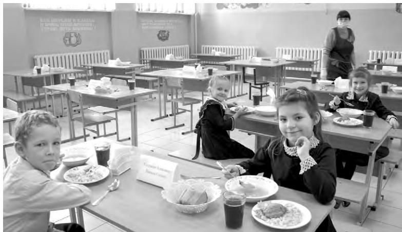
В школьной столовой кормят вкусно и полезно.