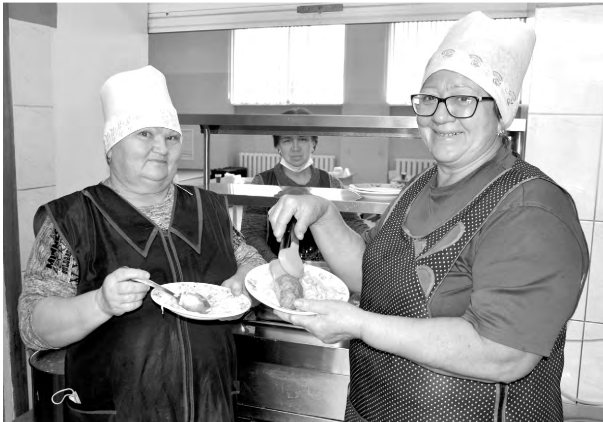
Кухонные кудесницы готовят для детей с любовью.