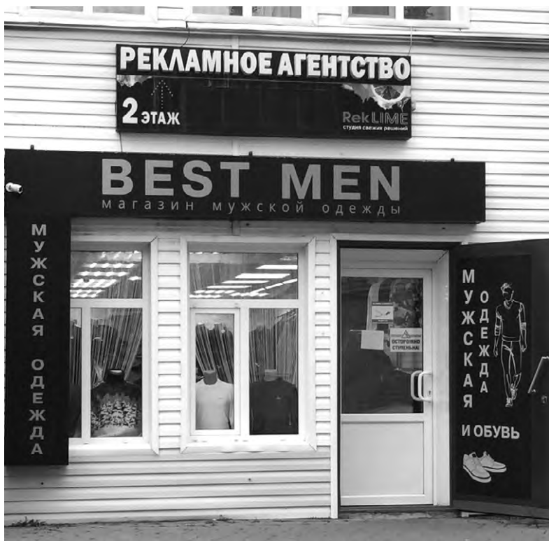
Фасад нового магазина «BEST MEN».