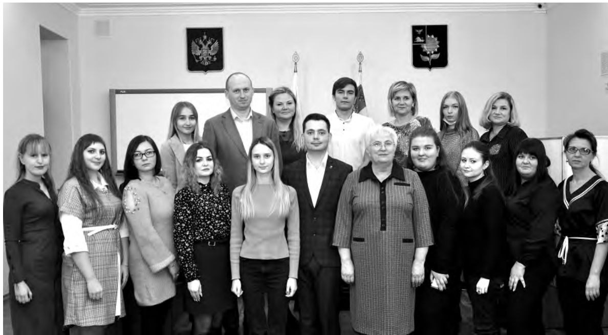
Новый состав молодёжного избиркома со старшими коллегами.

Вячеслав ГЛАДКОВ, губернатор Белгородской области.