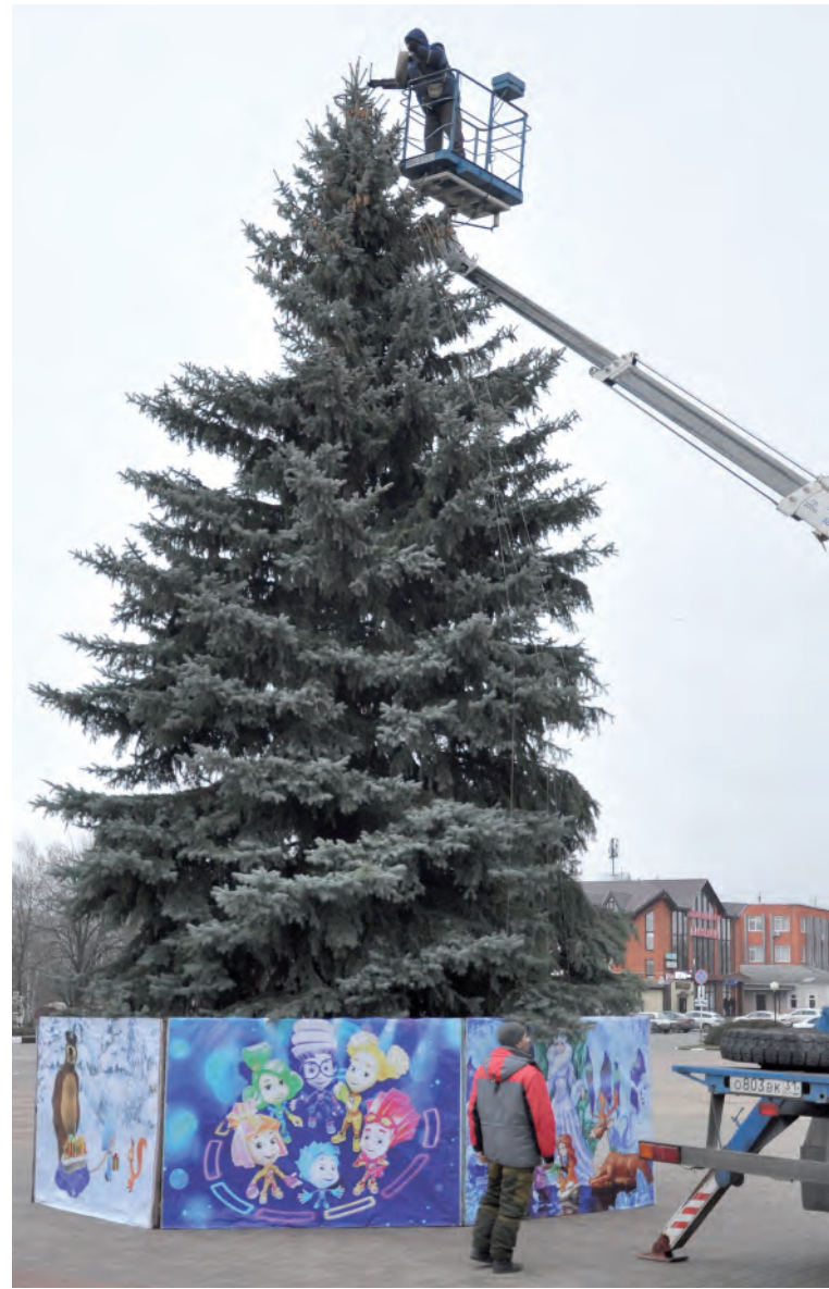
Установка новогодней красавицы.

Заря Учредители: департамент внутренней политики Белгородской области; администрация Алексеевского городского округа, администрация Красненского района Белгородской области, Совет депутатов Алексеевского городского округа Белгородской области, муниципальный совет муниципального района «Красненский район», АНО «Редакция газеты «Заря».