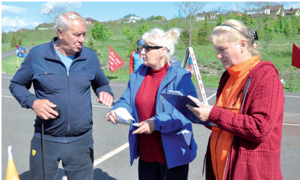
Судейская работа на кроссе.