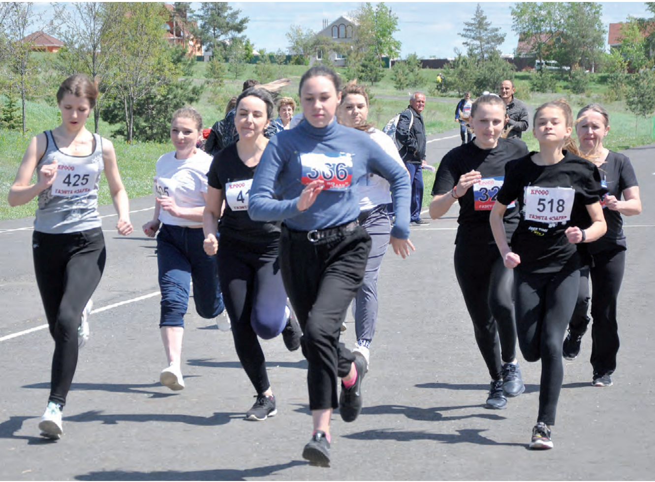
В традиционном легкоатлетическом кроссе на призы газеты «Заря» на дистанциях борьба была нешуточная.