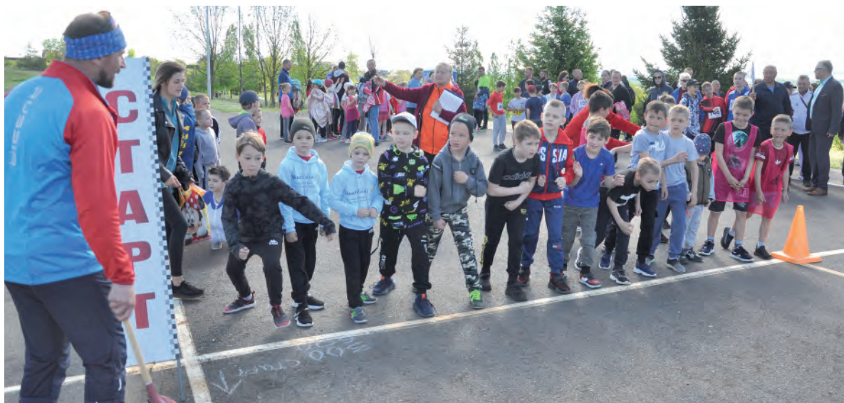
Старт самых юных участников соревнований.