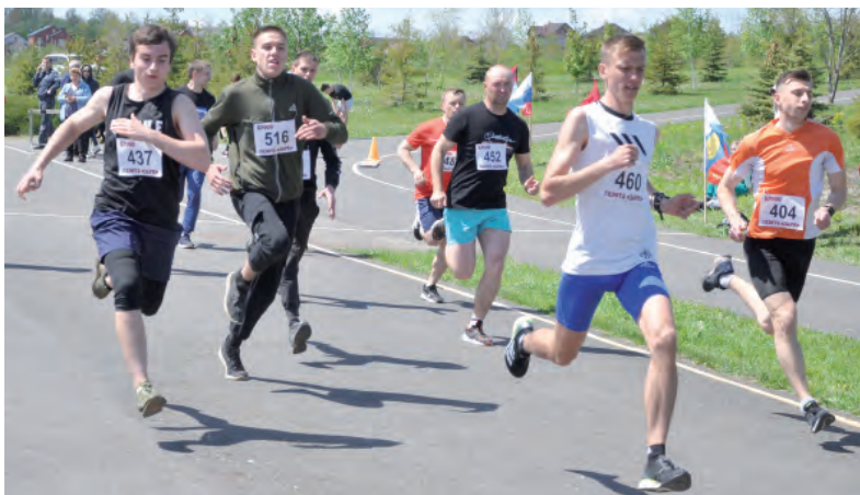
Во время забега.