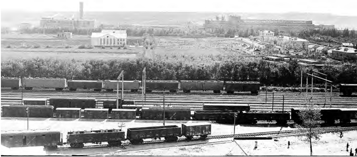
Район бывшего сахарного завода. 1970-е гг.