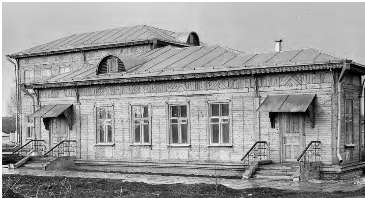
Обновлённое здание музея Николая Станкевича.

Алексеевка с 1993 по 2015 гг.