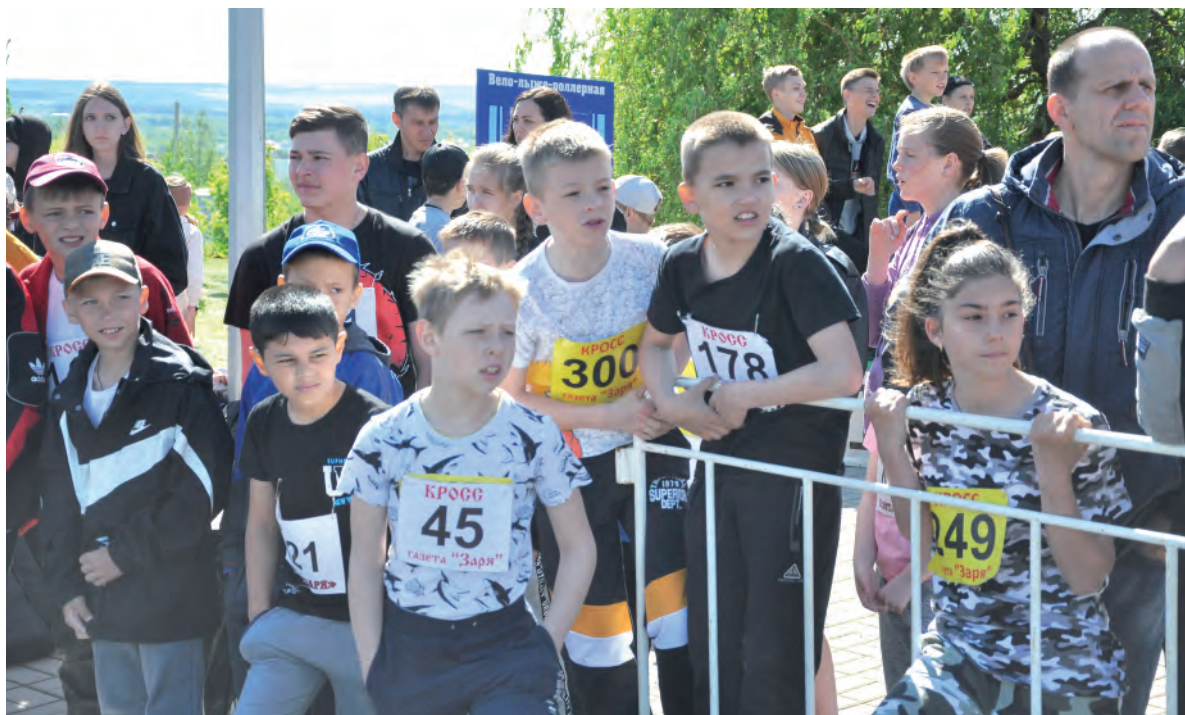
Участники турнира побывали и в роли болельщиков.

Заря Учредители: министерство общественных коммуникаций Белгородской области; администрация Алексеевского городского округа, администрация Красненского района Белгородской области, Совет депутатов Алексеевского городского округа Белгородской области, муниципальной совет муниципального района «Красненский район», АНО «Редакция газеты «Заря».