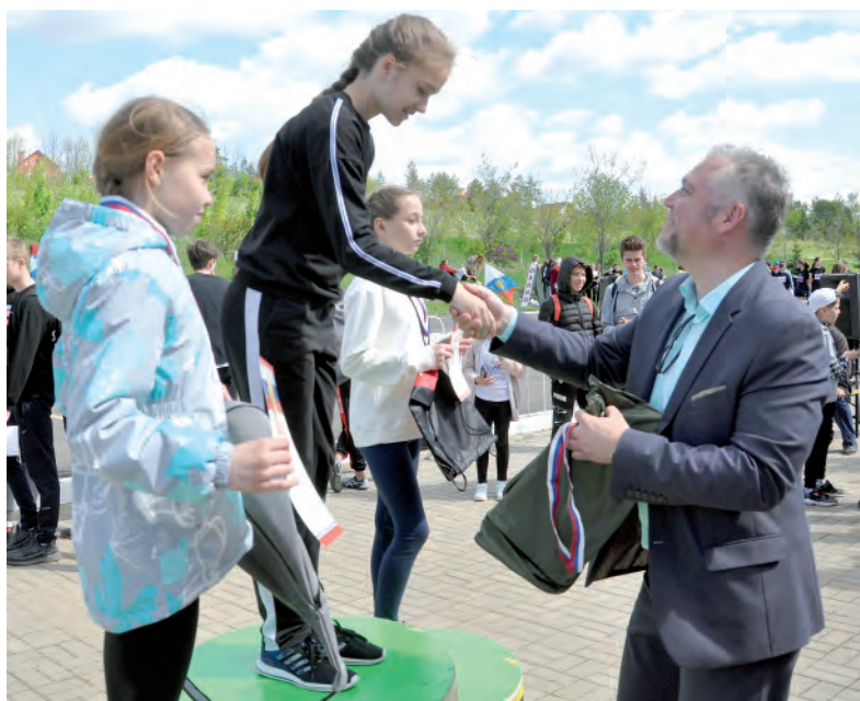
Награждение девочек, отличившихся на трёхсотметровке.