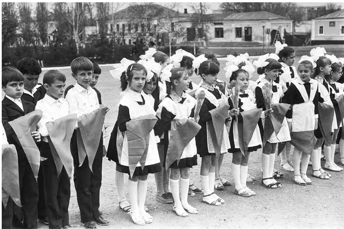
Приём в пионеры на Центральной площади Алексеевки. 1987 год.