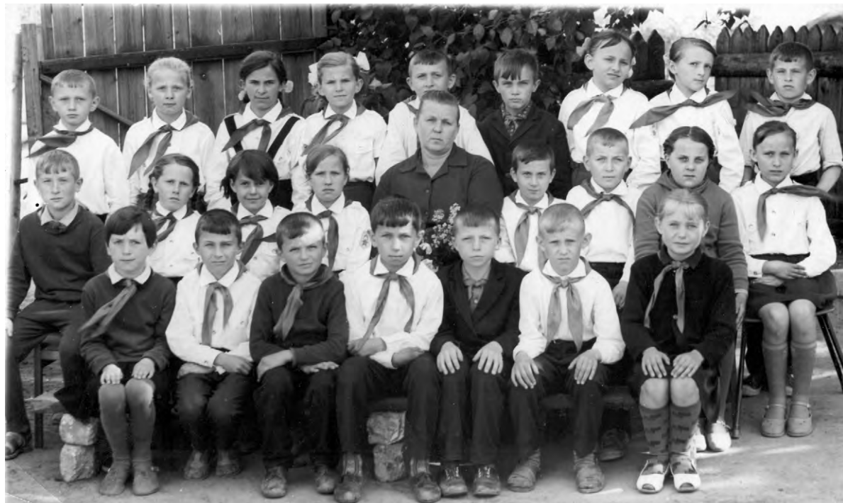
4 «А» класс Алексеевской средней школы № 2. 1971-й год.

1924 год 20 июля. Создан первый отряд юных пионеров в составе 10 ребят, получивший название звено имени Ильича. Своей жизнью и разносторонней общественной работой юные ленинцы сумели заинтересовать Алексеевскую детвору. К ноябрю отряд вырос до 116 человек и был разделён на два отряда: «Красные внучата» и «Искра КИМа». Политпросвет в отрядах, изучение законов и обычаев юных пионеров, репетиция спектаклей про-