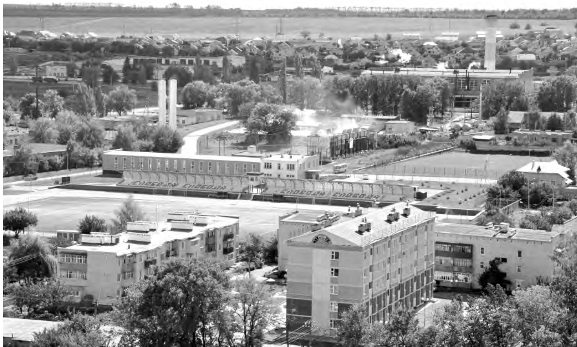
Это же место. 2016 год.