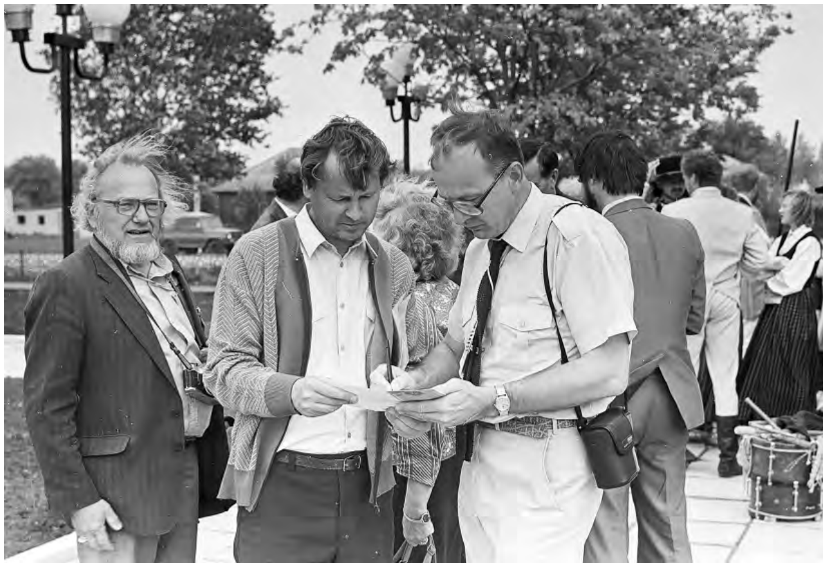
Творческая интеллигенция на открытии музея в 1990 году.

Фестиваль получился на славу и положил начало музыкально-литературному празднику «Удереvский листопад».