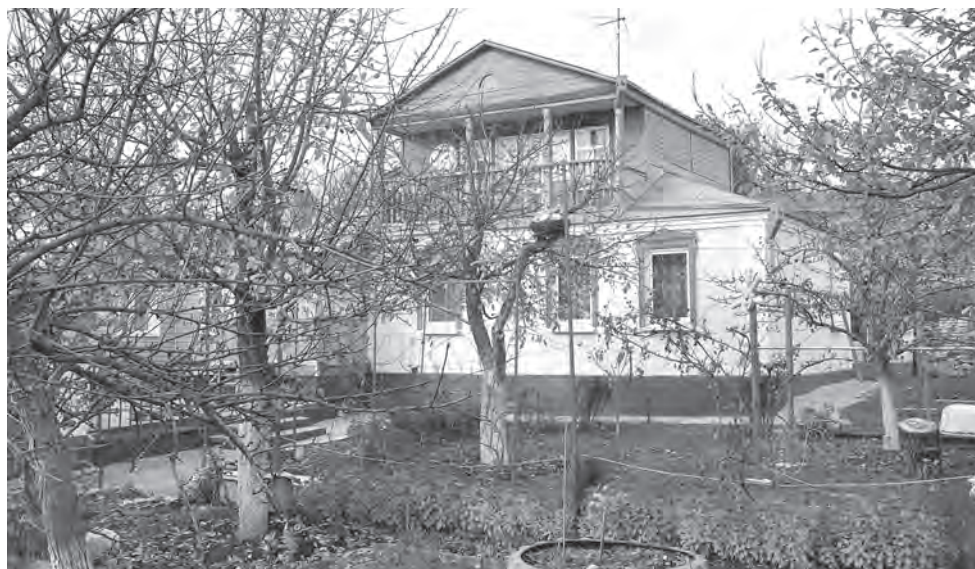
Так выглядит дом в Алексеевке, похожий на ульяновский.