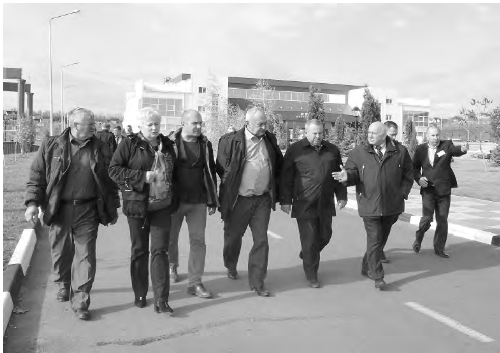
Делегация Рязанской области вместе с алексеевцами осматривают территорию спортивного парка.

Обмен опытом начался с посещения спортивного парка «Алексеевский». Здесь представители рязанской делегации ознакомились с работой ледового дворца «Невский». Гости побывали также во дворце спорта «Юность», в водном комплексе «Волна» и на территории спорткомплекса «Южный». Алексеевские специалисты подробно рассказали коллегам о специфике работы каждого учреждения, продемонстрировав результаты и достижения в различных направлениях. Далее делегация Рыбновского муниципального района переместилась на территорию Матрёноговского сельского поселения, где посетила местные учреждения образования, ознакомились с деятельностью сельской администрации. Го-