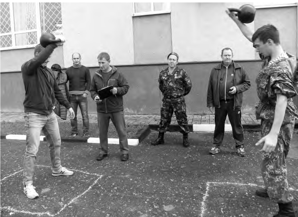
Будущие воины меряются силами.

После торжественной части команды участников отправились на площадки для участия в спортивном состязании. В соревнованиях приняли участие пятнадцать команд, среди которых были ученики кадетских классов, старших классов городских и район-