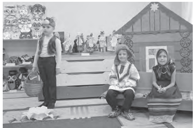
Инсценировка сказки «Красная шапочка».