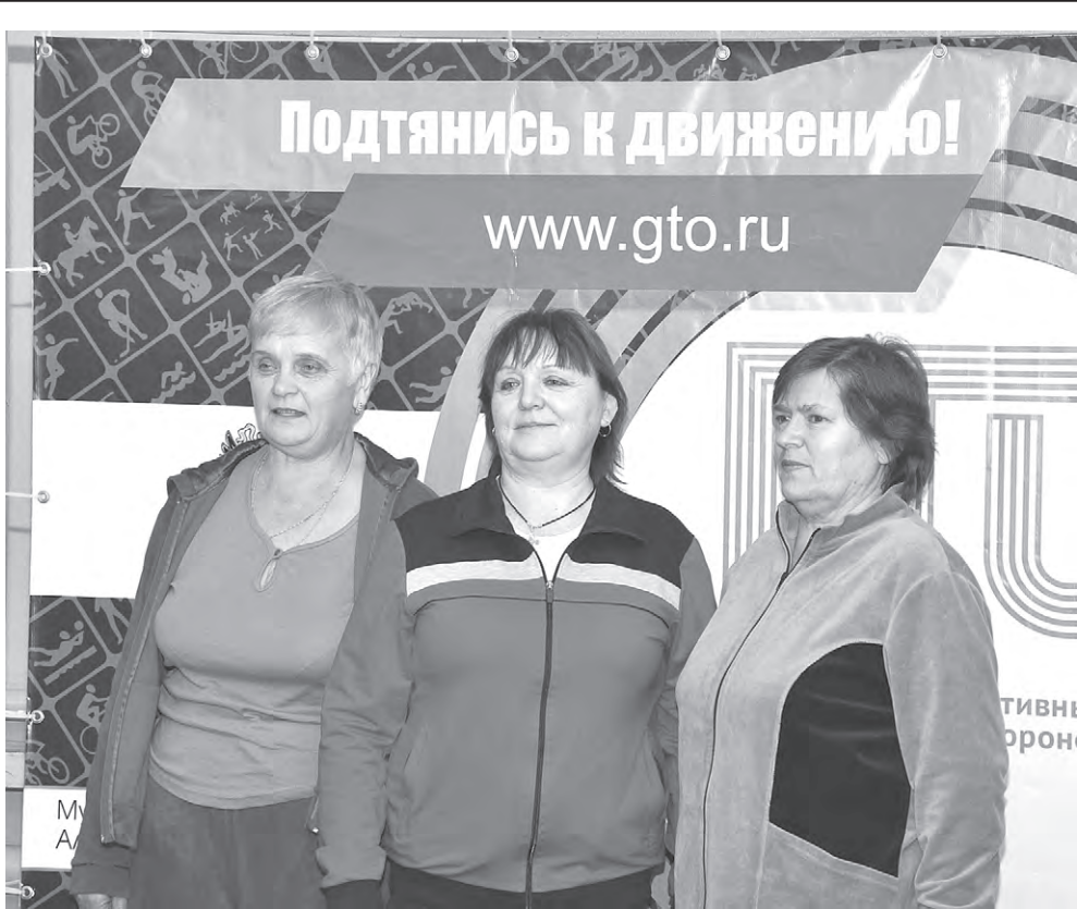
Проверить свои физические возможности нашлось немало желающих.

Не совсем обычное мероприятие состоялось недавно в спортивном комплексе «Олимп». Здесь собралась «возрастная» категория городского населения: представители управлений образования, культуры, соцзащиты, физкультуры и спорта администрации Алексеевского района, Пенсионного фонда.