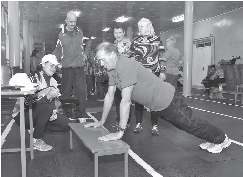
Есть ещё «порох в пороховницах»!