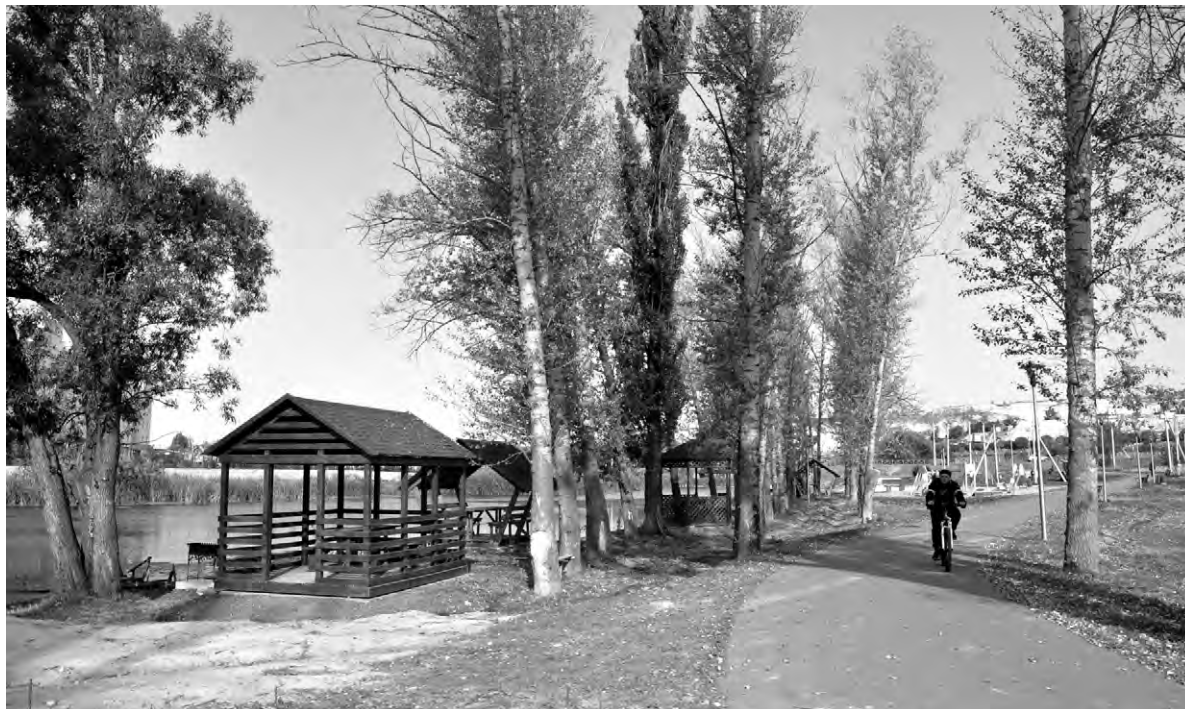
Так обустроена велопешеходная дорожка в районе Дмитриевского моста.

Правительство Белгородской области, Белгородская областная Дума, главный федеральный инспектор по Белгородской области.