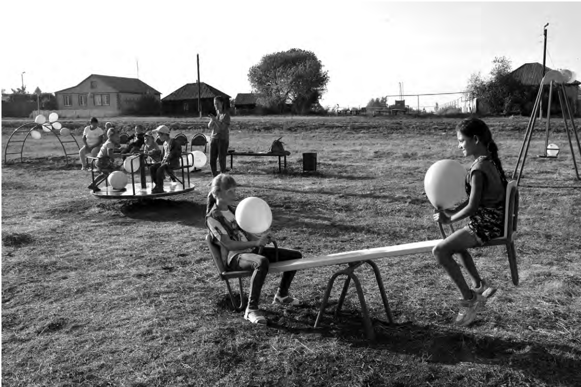
После открытия дети долго играли на новой площадке.