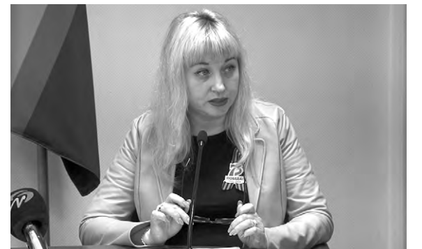
Текст и фото belpressa.ru

— Знаю, что была дискуссия на эту тему, поэтому поясню, что действие закона не распространяется на лиц, особенности труда и отдыха которых регулируются исключительно федеральным законодательством, — подчеркнула она.