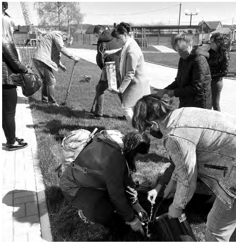
Обустройство территории, прилегающей к детсаду.

Недавно вместе с родителями воспитанников детского сада была заложена Аллея Славы, в честь 75-летия Великой Победы. Эта небольшая аллея роз — дань памяти людям, которые в трудное для нашей страны время встали на защиту родной