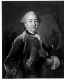
Петр Борисович Шереметев Художник И. Арзрум. 1760