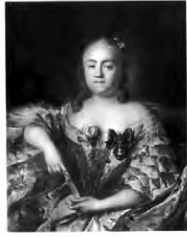
Варвара Александровна Шереметова (Черкасская) Художник И. Арзрум. 1760

В 1742 году князь скончался. У него осталась единственная дочь — Варвара Алексеевна. «Самая богатая невеста России», как её называли. В громадном приданом среди прочих вещей вошли и Алексеевка. Через год княжна Черкасская вышла замуж за графа Петра Борисовича Шереметева.