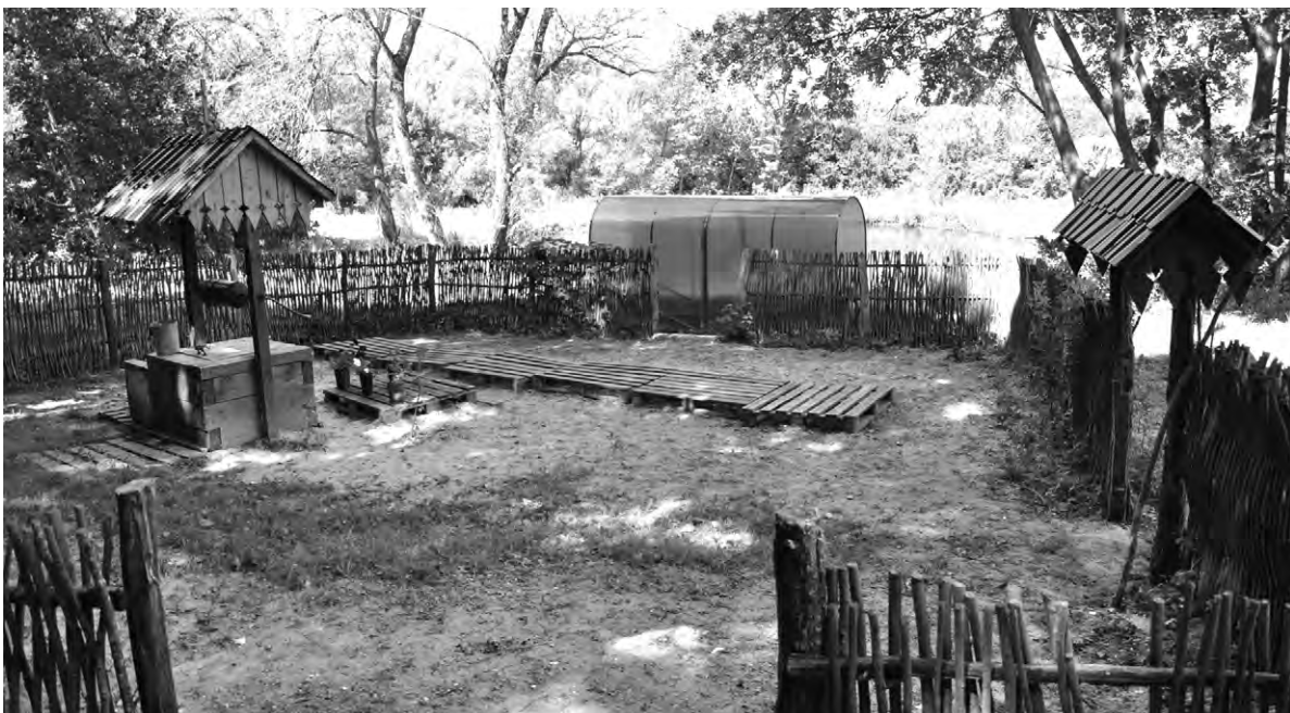
Благодаря общим усилиям неравнодушных людей, здесь теперь уютно и красиво.