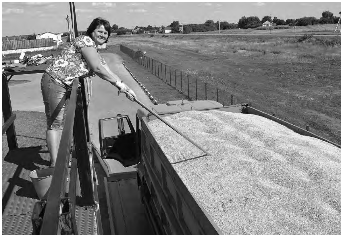
Взяв пробы, лаборанты точно скажут, какого качества поступило зерно с поля.