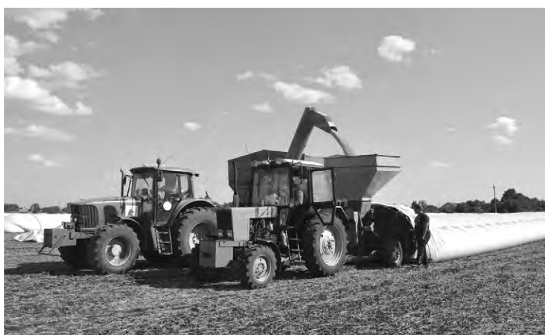
Таким способом затаривают зерно на хранение в специальные мешки.