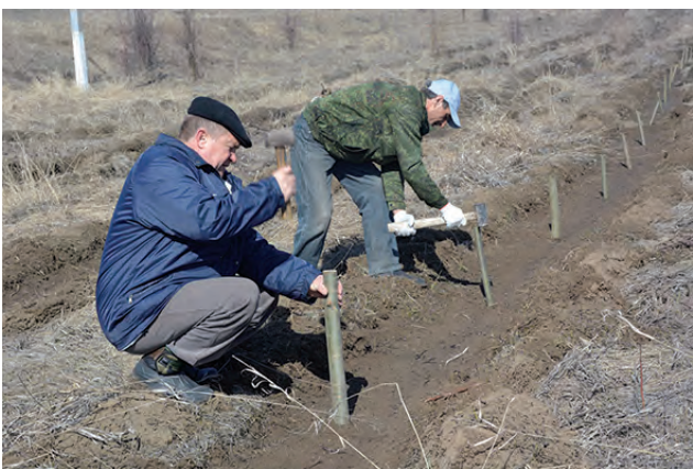
Соб. инф. Фото Н. Ярцева.

На территории Готовского сельского поселения создан музей брендовых деревьев. На пяти гектарах здесь посадили вербу и ивы, которые станут отличительным символом этой территории. Посадку новых насаждений проводили представители всех сельских поселений муниципалитета. На организованном субботнике они высадили 2500 черенков брендовых пород деревьев.