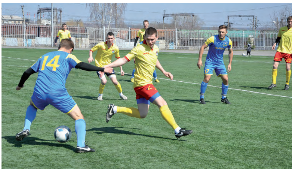
В атаке алексеевские футболисты.

А. МОЛЧАНОВ.