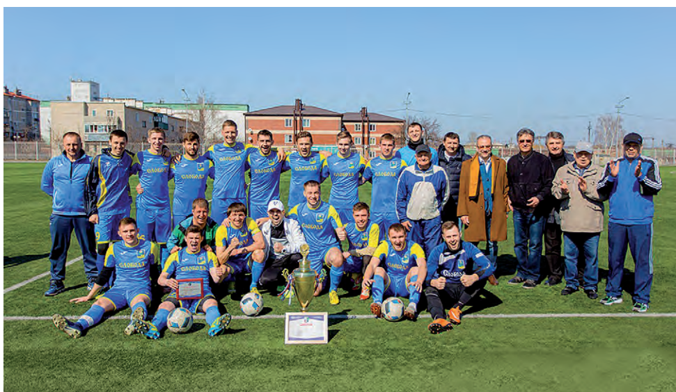
«Слобода» — обладатель суперкубка Белгородской области.