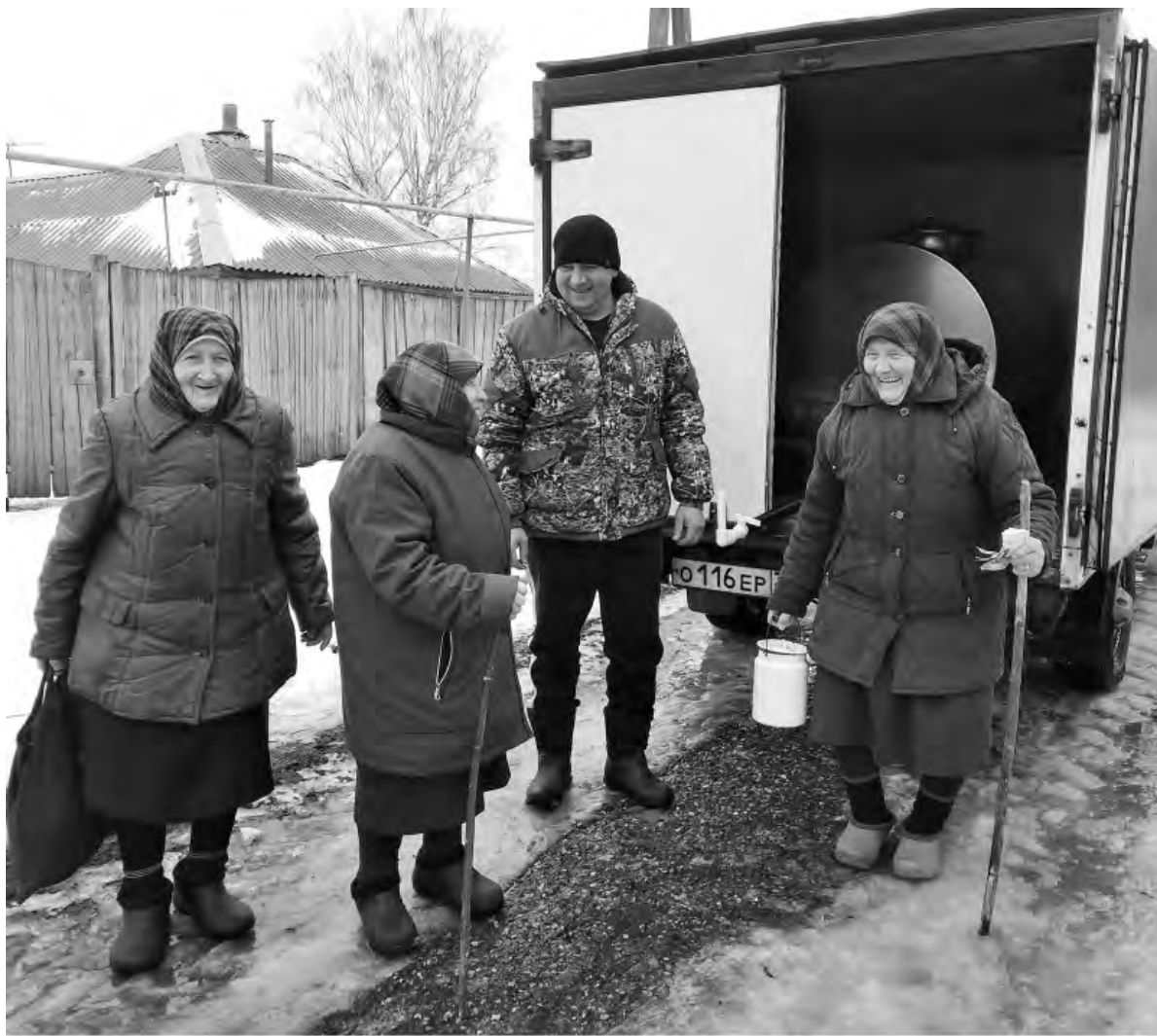
Хмелевские пенсионеры довольны качеством привозного молока.