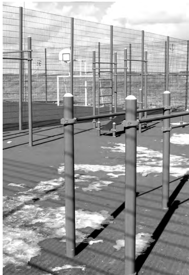
Спортивная площадка, открытая в прошлом году в конце улицы Чапаева в Алексеевке, позволяет заниматься многими видами физической культуры. Увлечённые баскетболом и мини-футболом могут посоревноваться отдельно от тех, кто будет играть в настольный теннис или начнёт тренироваться у гимнастических снарядов. Эти участки изолированы.