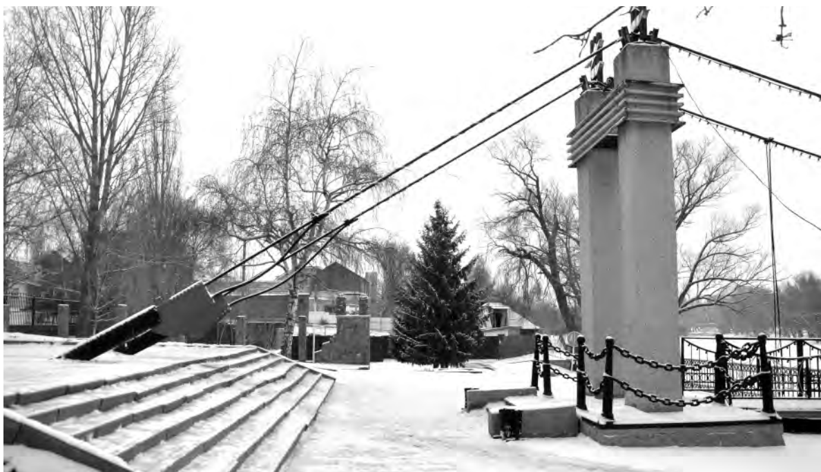
Это же место сейчас.