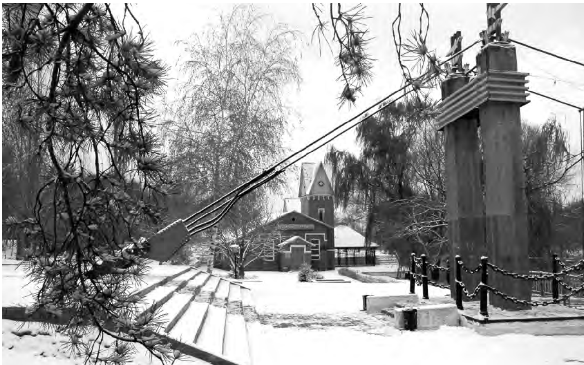
Набережная. 1990-е годы.