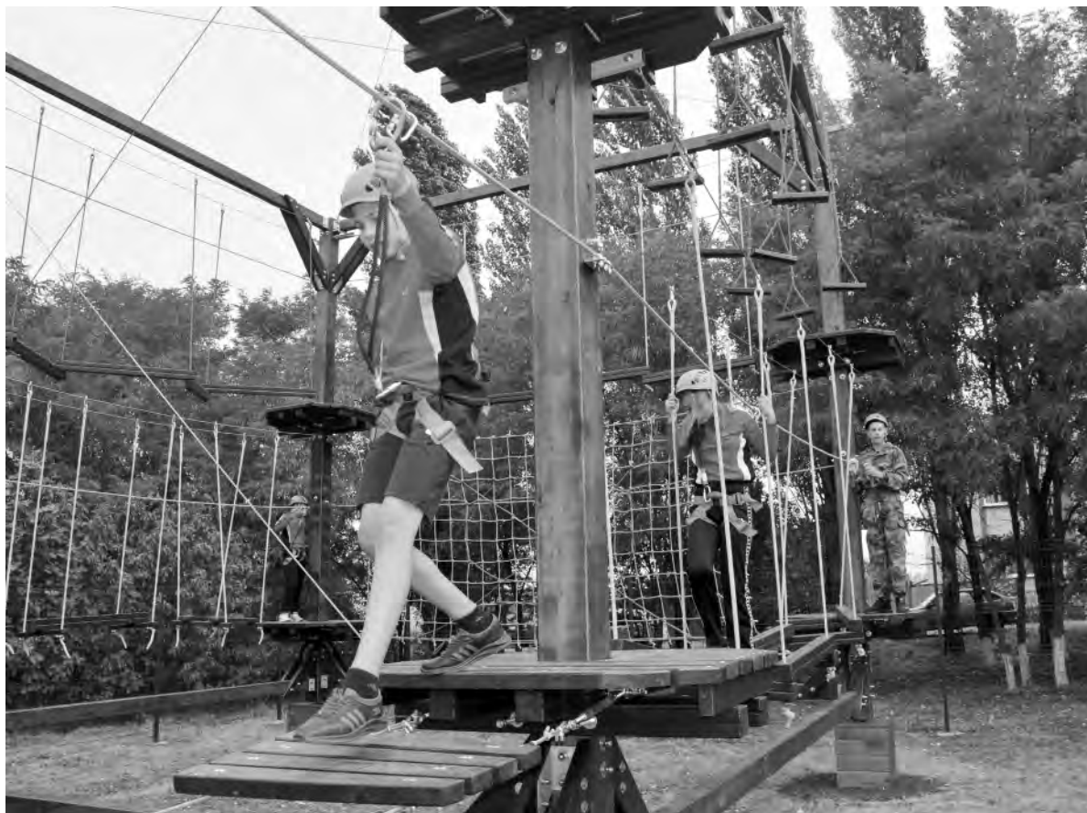
Канатно-верёвочный комплекс в Красном — любимое место детей.