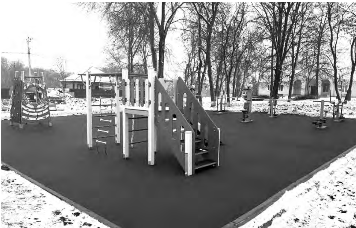
Спортивная площадка в Меняйлове совмещена с детским игровым комплексом.