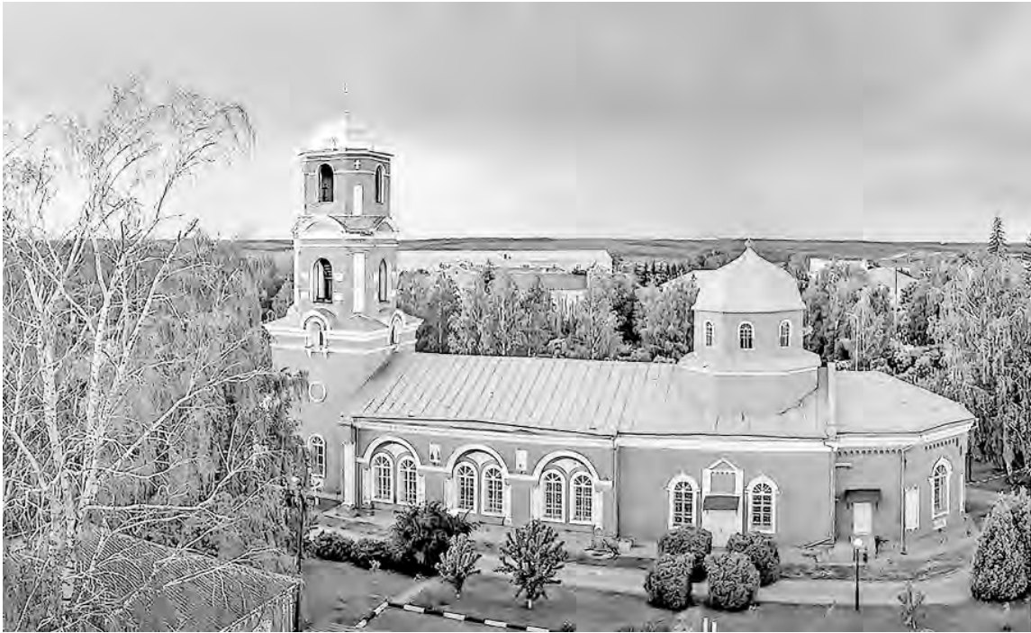
Свято-Ильинский храм в райцентре Красном своим величием и красотой подчёркивает заслуги его создателей.