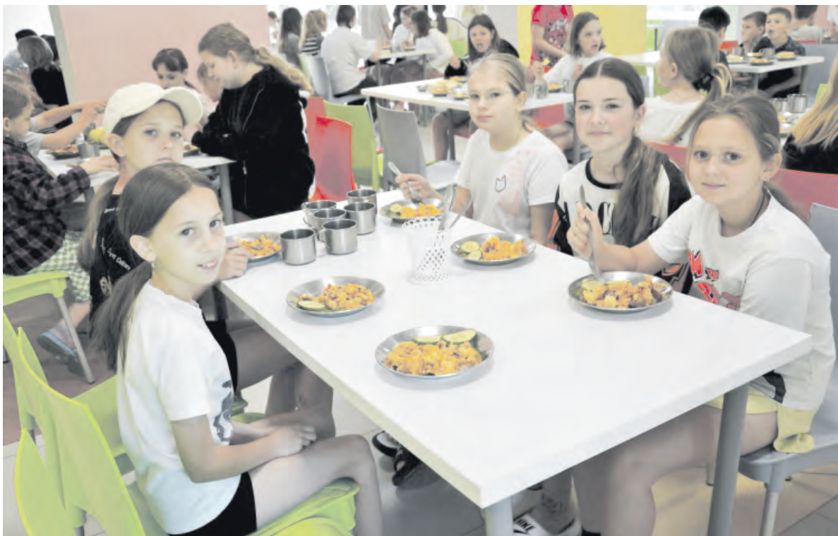
Отдыхающие первой смены летнего оздоровительного лагеря «Солнышко» к приёму пищи — готовы!