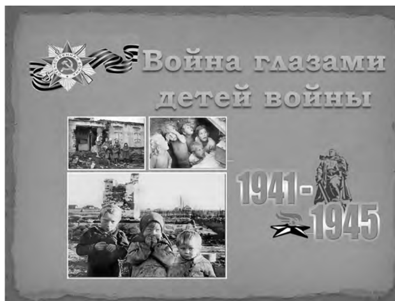
Конкурсный альбом «Война глазами детей войны» Совета женщин Алексеевского округа.