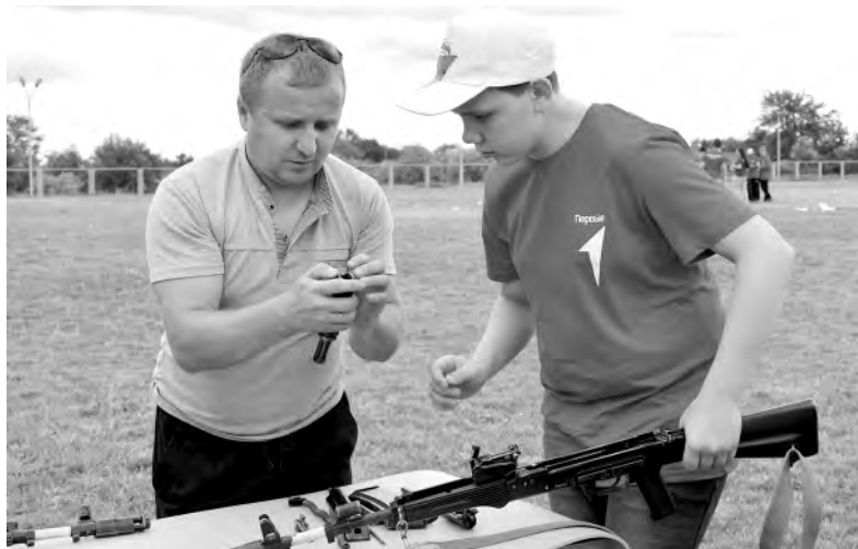
Сборка и разборка автомата даёт понимание, как выглядит оружие, и полезна для развития моторики.

Виктория ХАРЬКОВСКАЯ, Фото Николая Ярцева.