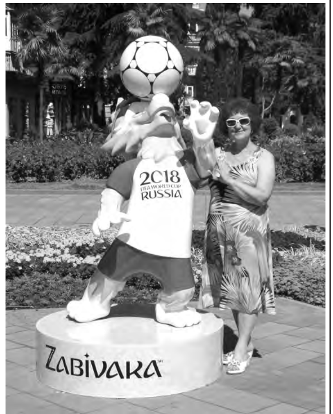
Тот самый волк «Забивака»!

Что здесь проходит чемпионат мира по футболу, ясно без каких-либо пояснений. Всюду соответствующая атрибутика, неподалёку от морской набережной — фигуры Волка «Забиваки» и другая красноречивая символика. Флаги, надписи «Добро пожаловать!» и прочее можно встретить чуть ли не на каждом перекрёстке. Всюду — идеальная чистота — город основательно подготовился к значимому событию. Но местное население относится к этому спокойно. На вопро-