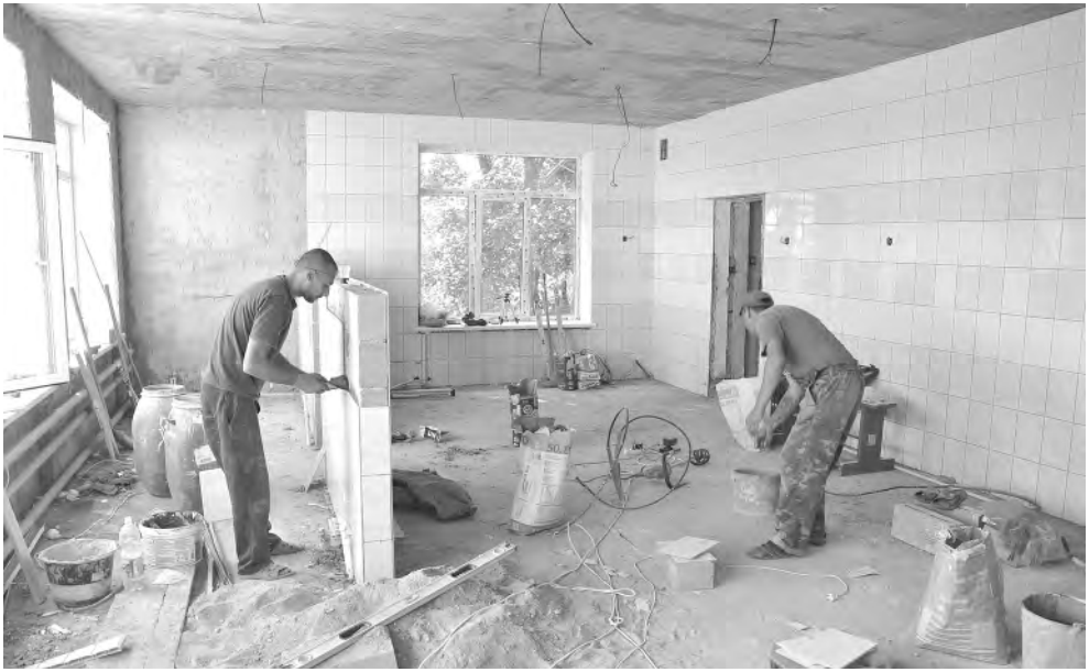
Идёт укладка плитки в столовой.

Алексеевская межрайонная прокуратура провела проверку исполнения трудового законодательства в частных охранных организациях района (ЧОО), в ходе которой в четырёх из них выявлены нарушения законодательства об охране труда, а также требований ст. 57 Трудового кодекса РФ, регламентирующей обязательные условия, подлежащие включению в трудовой договор.