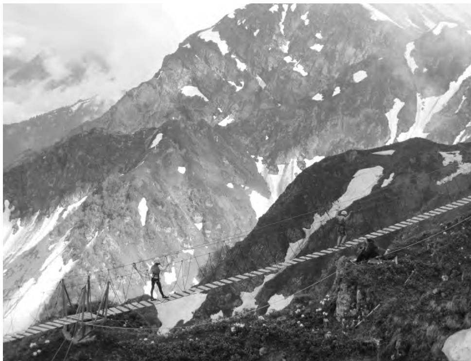
Пройтись по канатной дороге над пропастью — занятие не для слабонервных.