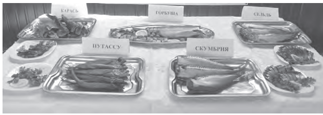
Продукция новоуколовского предпринимателя.

Для того, чтобы рыба стала красивой и ароматной, она проходит целый цикл обработки.