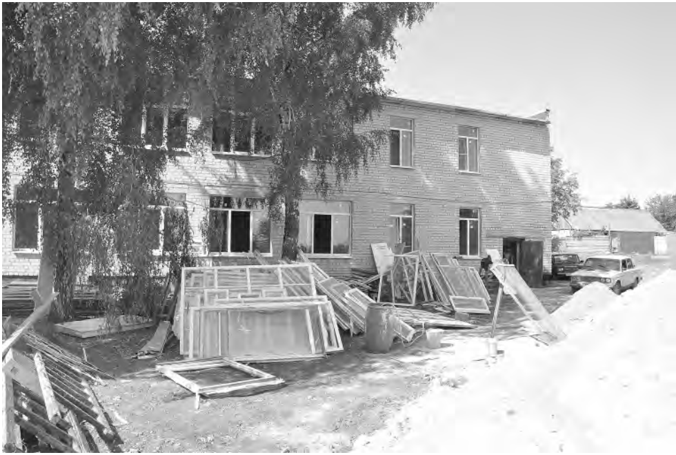
Старые окна ещё не вывезены со двора.