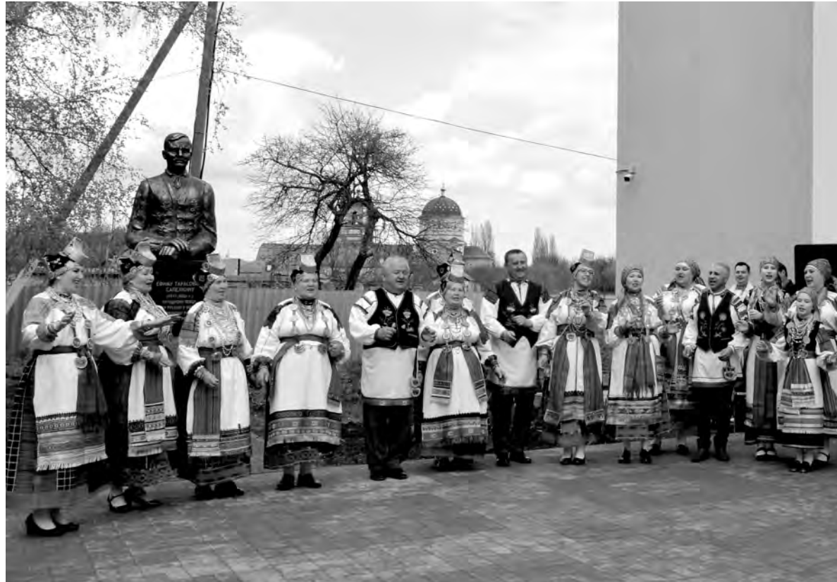
Фольклор — визитная карточка села Афанасьевка.

На приклубной территории и в недавно отремонтированном Доме культуры было многолюдно. Здесь нашлось место сценическим площадкам с богатым историческим и фотоматериалом о жизненном укладе и песенных традициях талантливой семьи Ефима