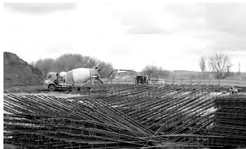
Работы по строительству соцобъектов в Ильинке стартовали два месяца назад.