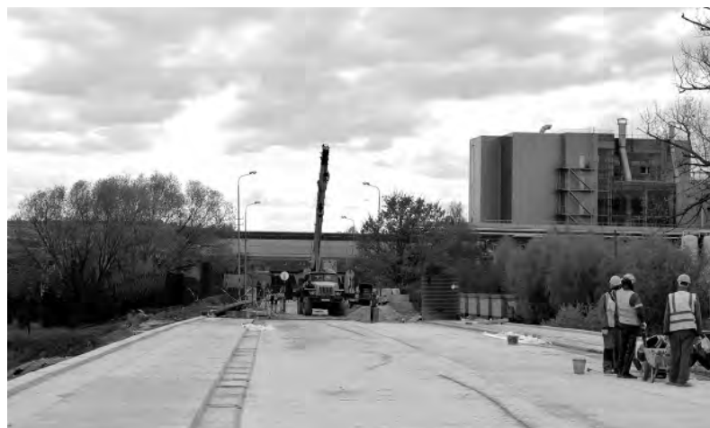
После капитального ремонта Центральный городской мост будет заметно расширен.

Благодаря капитальному ремонту 2022-2023 годов обновлённое сооружение (протяжённость 116 метров) не только расширится. По плану в рамках ремонта — замена всех устаревших конструкций, перенос инженерных коммуникаций, установка барьерного и замена пешеходного ограждений, а также уличного освещения. Срок сдачи объекта — 1 сентября текущего года.