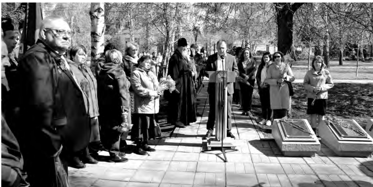
У мемориала ликвидаторам аварии на ЧАЭС в Алексеевке собралось много людей.