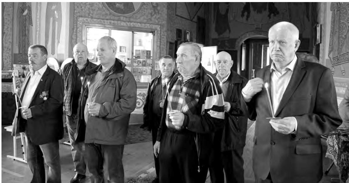
В Свято-Ильинском храме «чернобыльцы» молитвенно почтили память погибших ликвидаторов аварии.