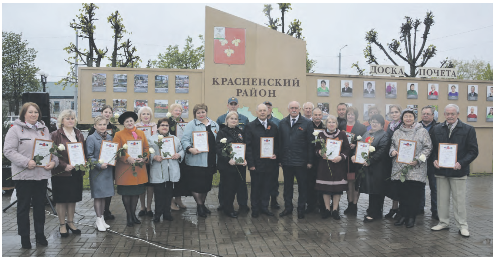
На торжественном открытии обновлённой районной Доски Почёта.