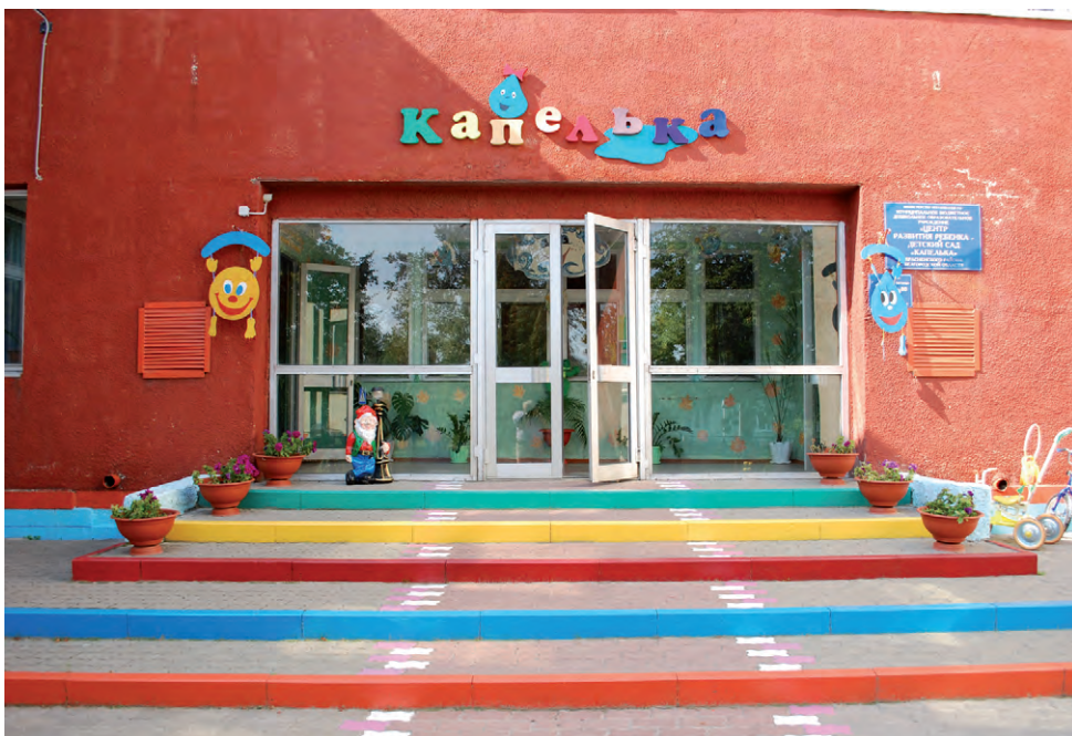
В настоящее время в Красненском детском саду «Капелька» ведётся капитальный ремонт кровли, заменены окна.