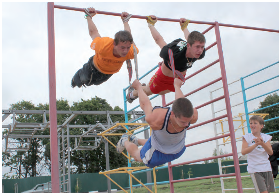
Елена Николаевна считает, что здоровая нация — надёжное будущее, поэтому особое внимание уделяет развитию спорта.