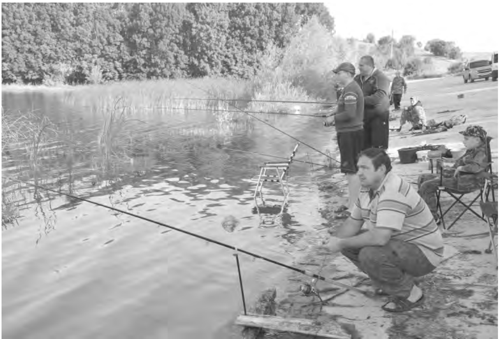
На утренней заре с удочкой в руке.