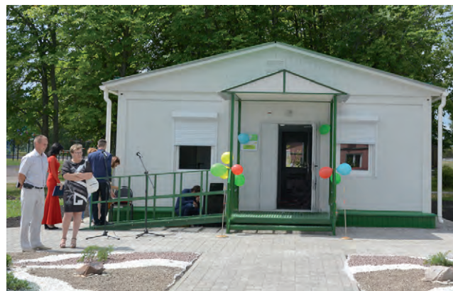
Жители села Сетище благодарны инвестору за новый ФАП.

Подготовили Т. Краснова и В. Бабич.