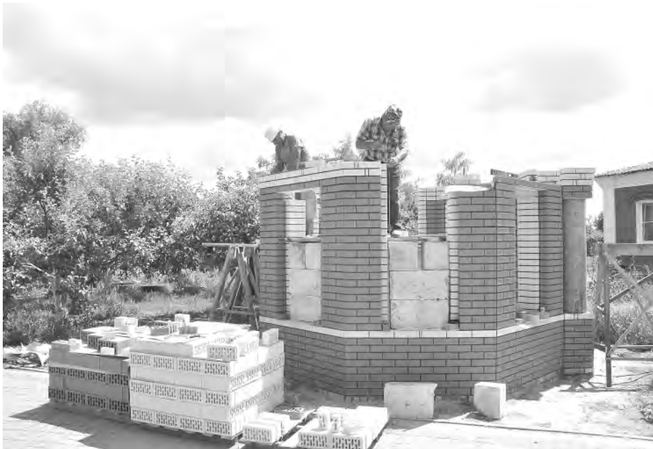
Момент строительства часовни.