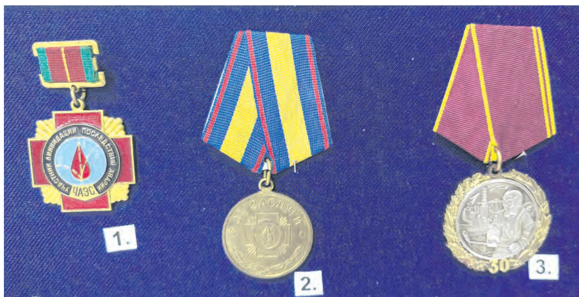
Награды Николая Журбенко. 1. Нагрудный знак участника ликвидации катастрофы ЧАЭС. 2. Медаль «За заслуги» I степени. 3. Юбилейная медаль.

Анастасия ХОРТЮНОВА, младший научный сотрудник Алексеевского краеведческого музея.