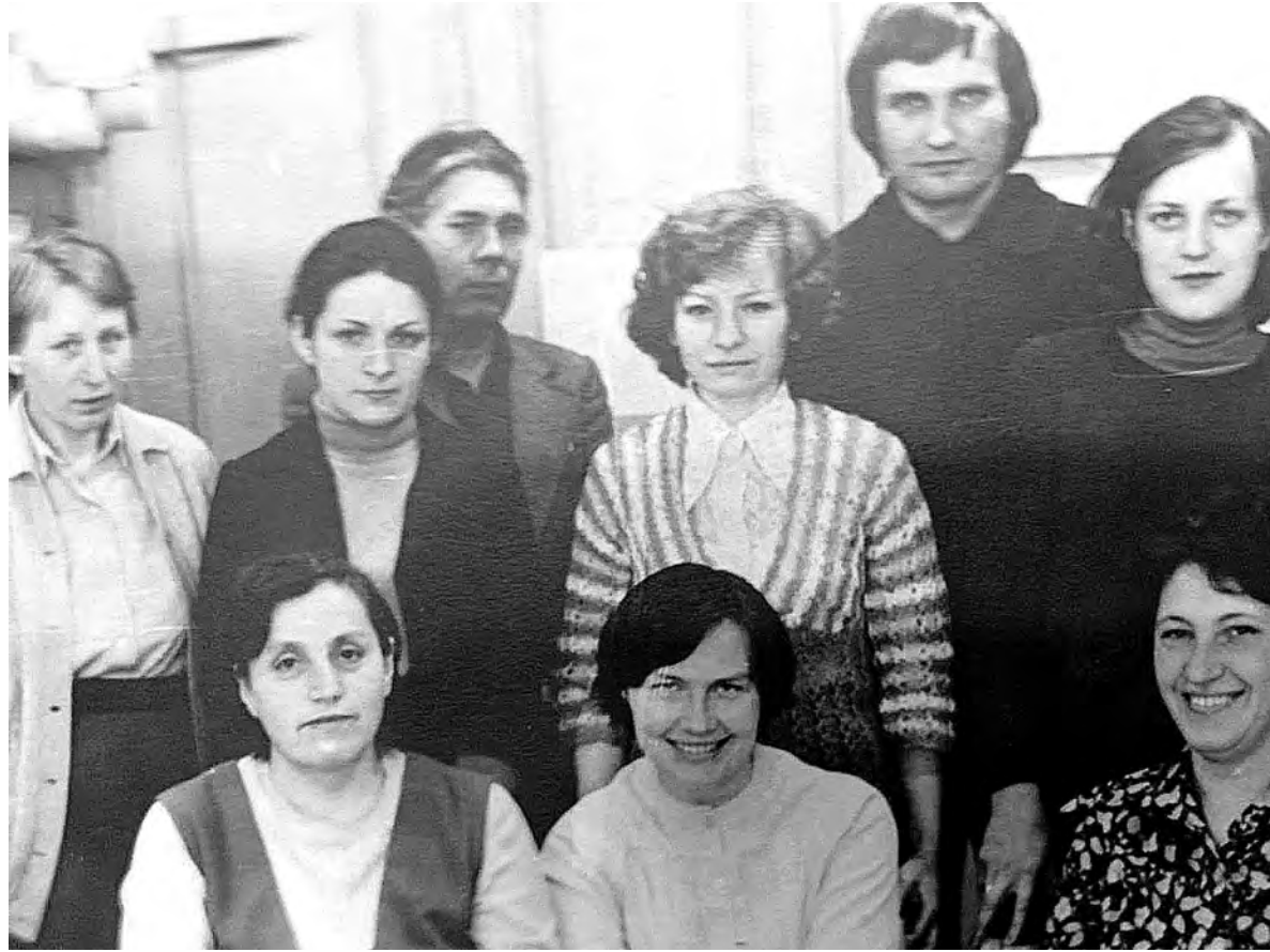
Миссию по подготовке техдокументации для производства машин по внесению безводного аммиака в почву выполнили специалисты НИИ «Химмаш».