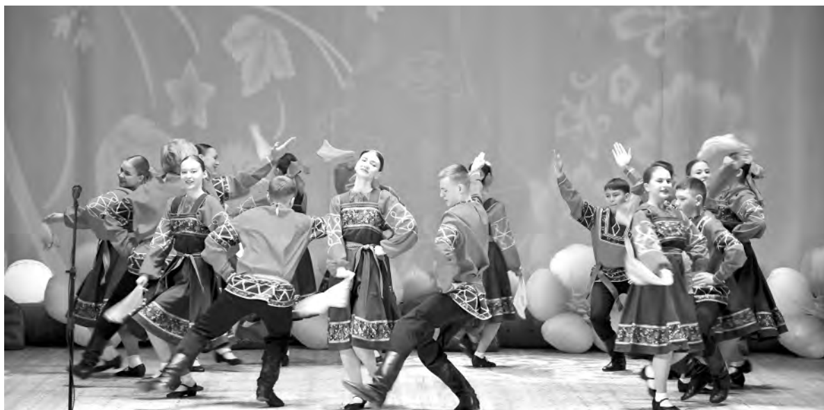
Творческие номера местных артистов украсили праздник.