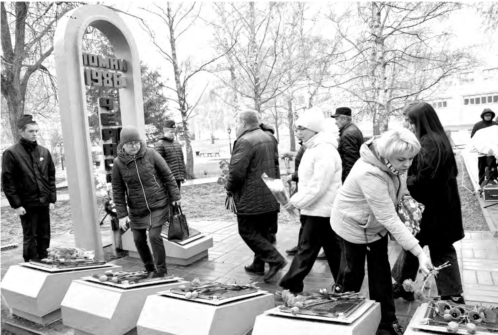
Момент возложения цветов на Аллее памяти в Алексеевке.