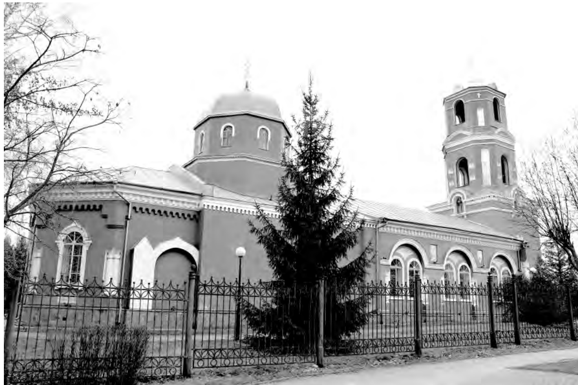
Так Свято-Ильинский храм в райцентре Красном выглядит в наши дни.

Храм был построен за пять лет, прихожане с причтом внесли на строительство 50 000 рублей. Обустройство Божьего дома продолжалось ещё долгие