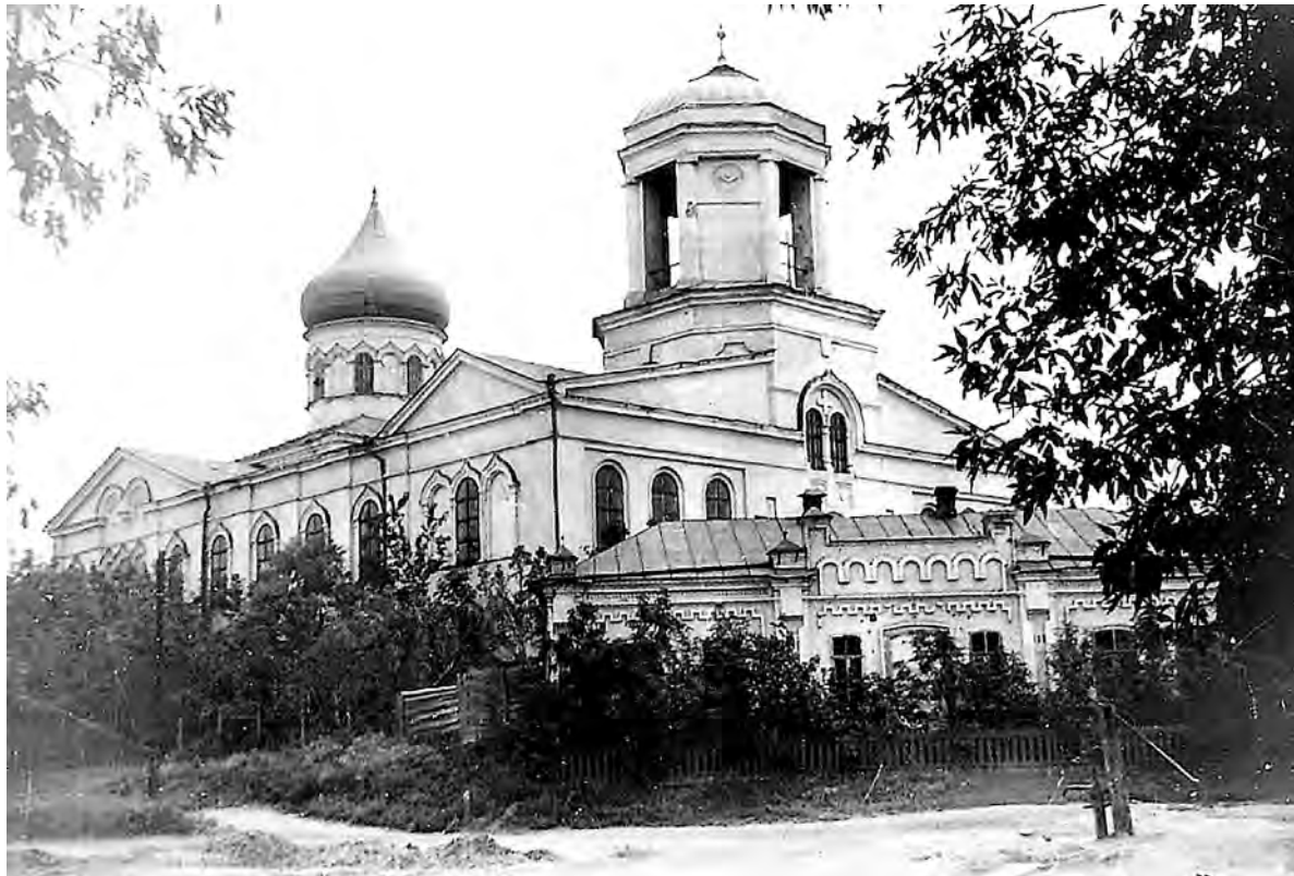
Свято-Троицкий храм в первоначальном виде. 1950-е годы.

Своё слово об Алексеевке и прихожанах сказал другой священник,