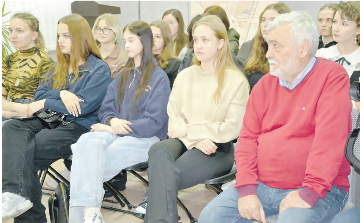
Студенты и педагоги Алексеевского колледжа увлечённо слушали рассказ о жизни и творчестве нашего земляка.