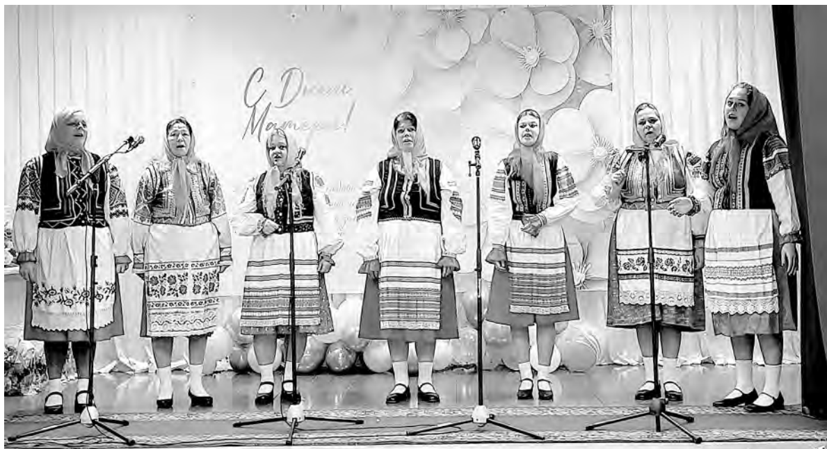
Певуны из Репенского народного фольклорного коллектива — постоянные участницы мероприятий, которые проходят в Алексеевском округе.

В то время при учреждении действовал народный фольклорный ансамбль «Рябиношка». Это отдельная часть истории для героини этих строк. Ведь