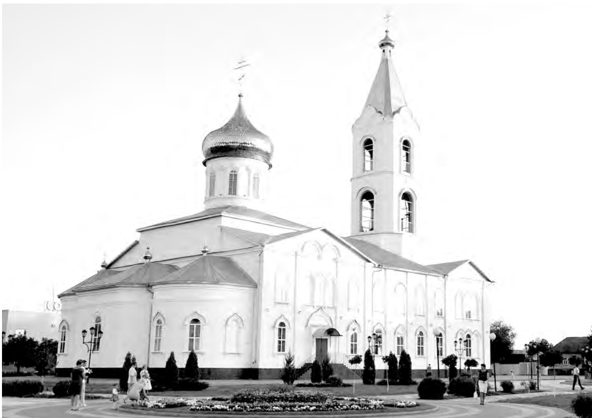
Свято-Троицкий кафедральный собор в наши дни.

В 40-е и 50-е годы прошлого столетия верующие водили сюда малюток по субботам к заутрене и по воскресеньям к обедне, а также во время говения и на причастие, на Троицу и Пасху. До сих пор перед глазами старожилков стоят строгие лики икон, красочно-золочёная настенная роспись и льющийся через окна купола небесный свет, а в сознании звучат торжественные молитвословия и песнопение.