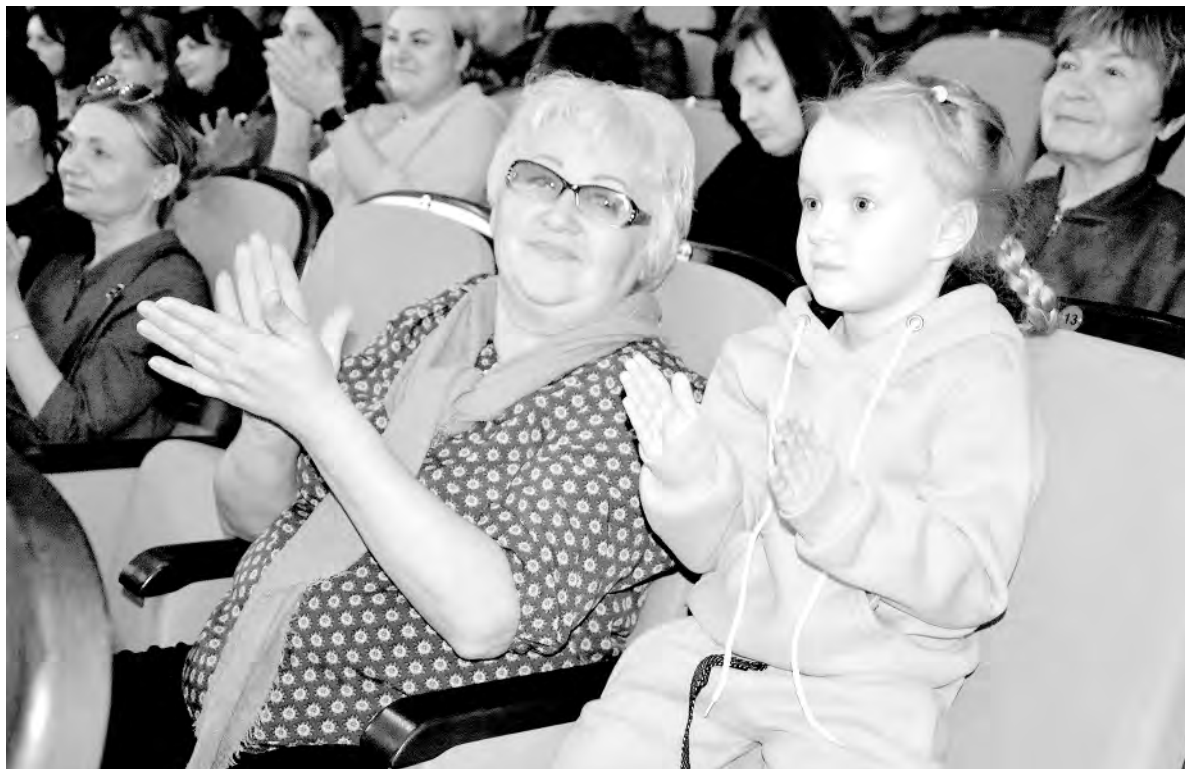
Алексеевцы с неподдельным восторгом встречали творческие номера местных и приезжих артистов.