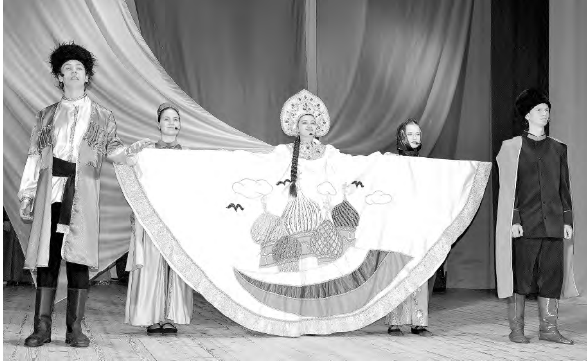
Образ нашей многонациональной страны предстал перед зрителями в исполнении участников театральной студии «Солнечного».