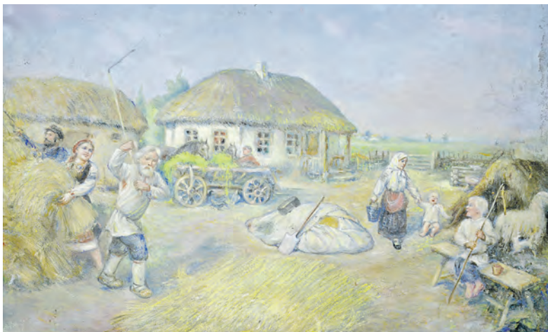
О любви художника к жизни в сельской глубинке говорят его полотна.