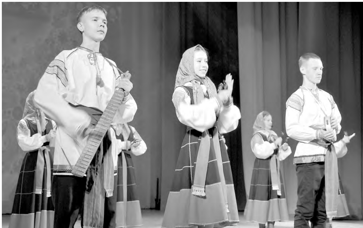
Юные исполнители народных песен не только спели для зрителей, но и сыграли на старинных инструментах.