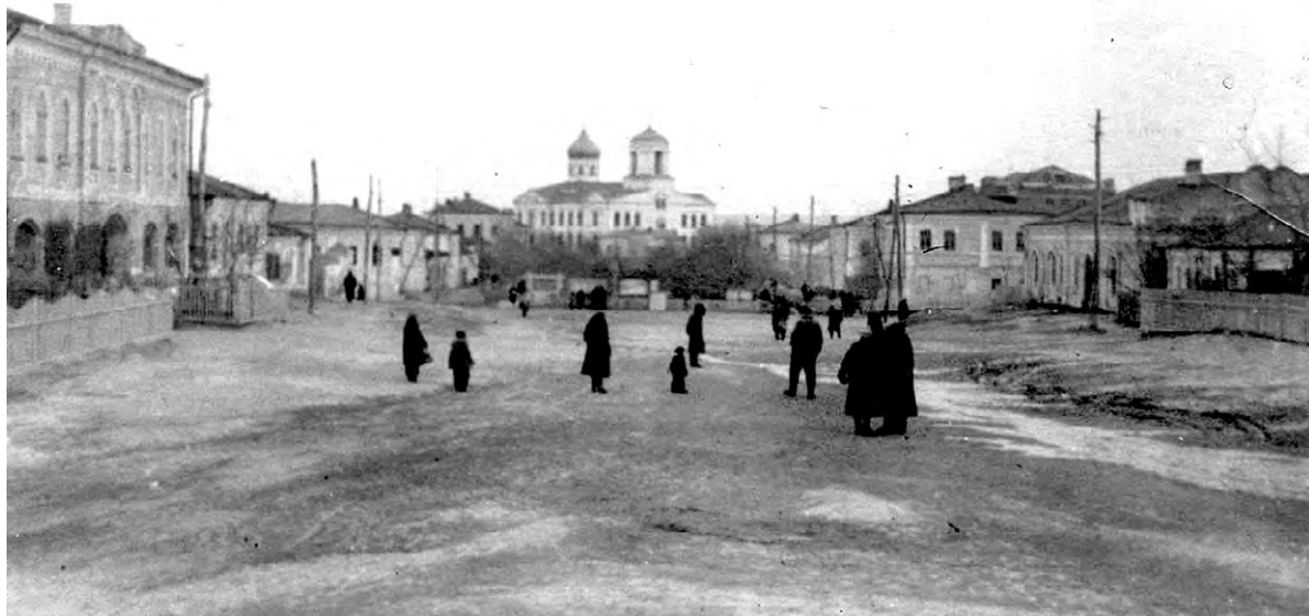
Улица Советская, ныне Гагарина, в Алексеевке. 1954 год.

Президиум Верховного Совета СССР по представлению Президиума Верховного Совета РСФСР 6 января 1954 года утвердил образование новой Белгородской области с центром в городе Белгороде. Во вновь организованную область вошёл и Алексеевский район. Ниже материалы, которые публиковались в районной газете «Путь к коммунизму» в те дни.