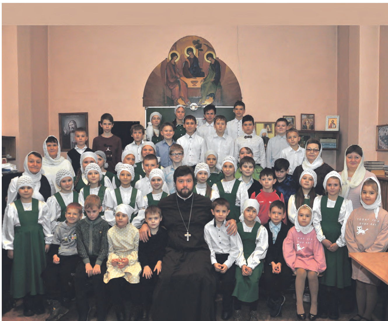
Около 70 детей из Алексеевского горокруга являются воспитанниками Воскресной школы.