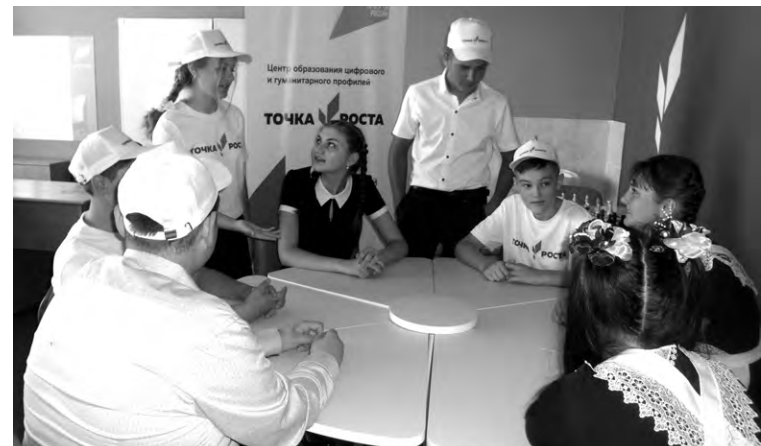
Восьмиклассники обсуждают проект съёмки видеофильма «Волонтёры — это мы!».