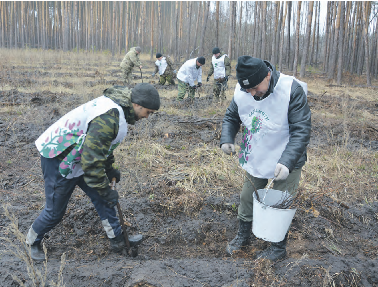
Лесоводы вовремя провели весеннюю посадку и выполнили план.