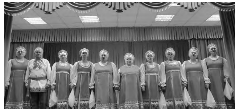
На сельской сцене — хор «Тополёк».