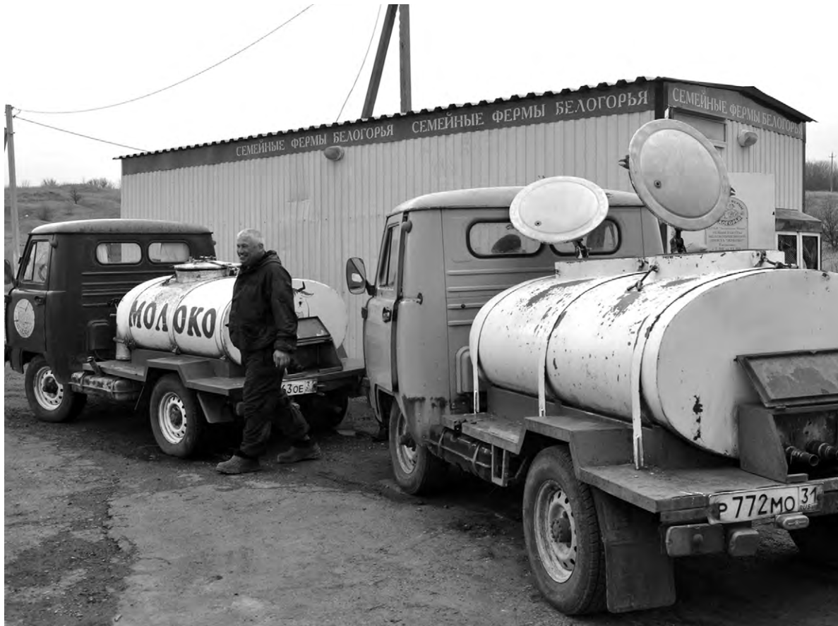
УАЗы с термобочками доставили молоко на приёмный пункт.

По сути приёмный пункт в Жукове является одним из первичных звеньев кооператива, который стал добрым партнёром сельских жителей, занимающихся молочным животноводством. «Алексеевское молоко» помогает закупить фураж нуждающимся в кормах, выдаёт в рассрочку деньги на приобретение коров и на неотложные семейные нужды, готовит пакет документов на получение субсидий. Как правило, на Дне села лучшим молокосдатчикам вручают премии и благодарственные письма.