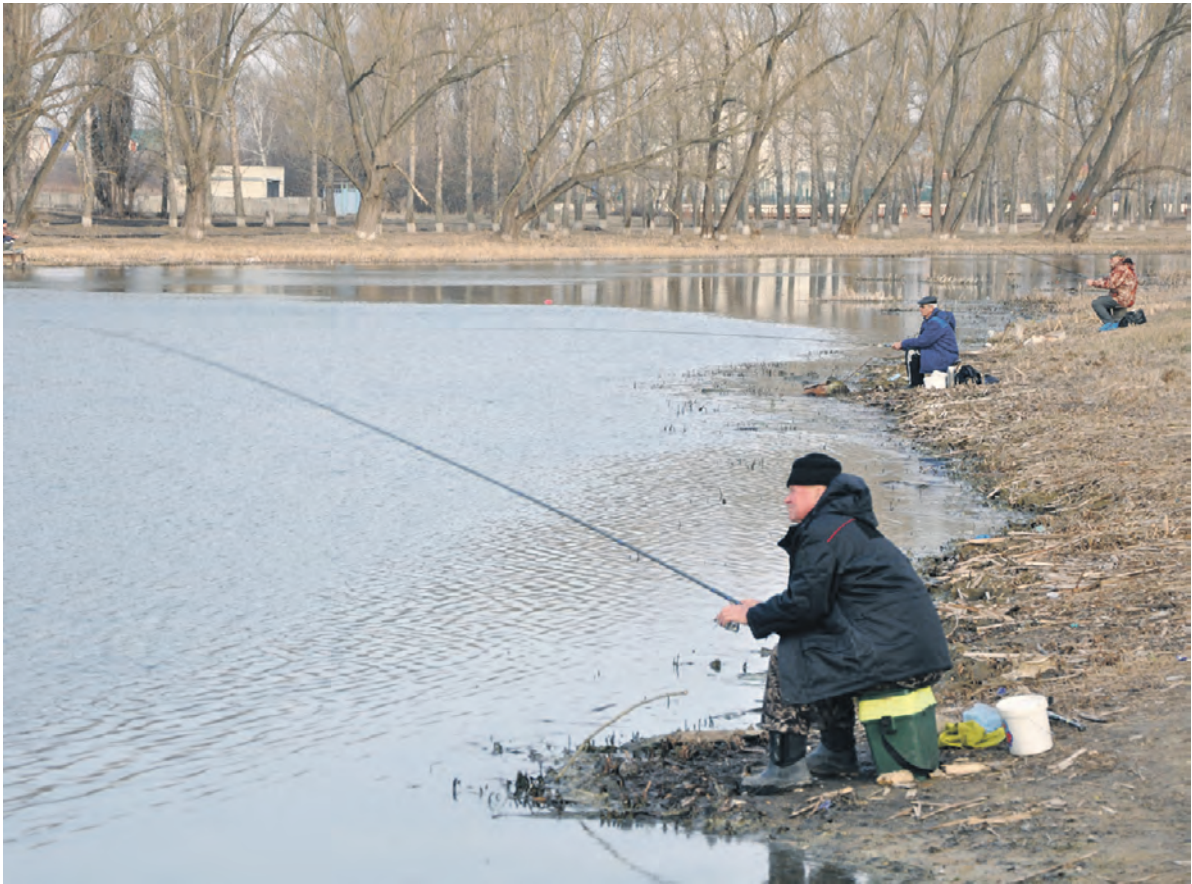
Тихая Сосна освободилась ото льда — и рыбаки уже на облюбованных местах.