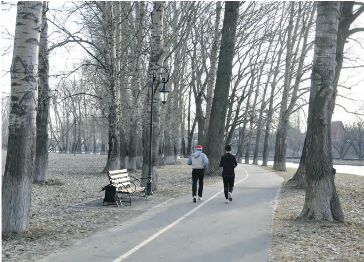
Одно удовольствие подышать вольным воздухом на дорожках вдоль Тихой Сосны.

По ночам у парней и девочек, Как в далёкие годы, наверное, Те ж признанья, как песни звучат. Ах ты, речка из детства... По имени Знаю издавна всех соловьёв, Ведь не зря в подтвержденье взаимности Я принёс тебе сердце своё. Павел САВИН.