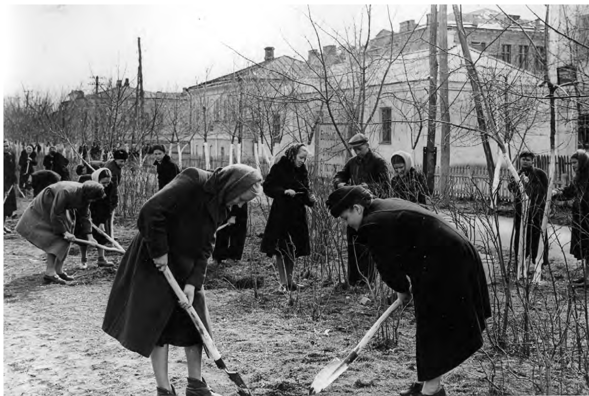
В сквере по улице Гагарина проходит субботник. 1960-е годы.