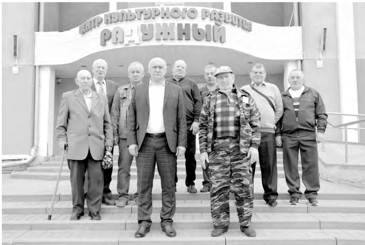
Фото на память в честь 38-годовщины со дня трагической даты.

Алексеевцы возложили цветы к памяtnому знаку.