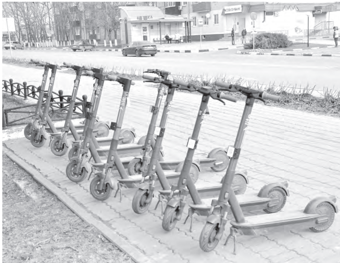
Взять такой электросамокат в аренду может любой желающий. Знание ПДД — обязательно!

В воскресенье в парке мне попались на глаза двое подростков, катающихся на электросамокатах по велосипедным дорожкам. Восемиклассники Родион Редкозуб и Владислав Погорелов любят так проводить свои выходные. Родион катался на личном электросамокате, Влад — на арендованном. Родион рассказал, что сначала выезжал в город под присмотром мамы.