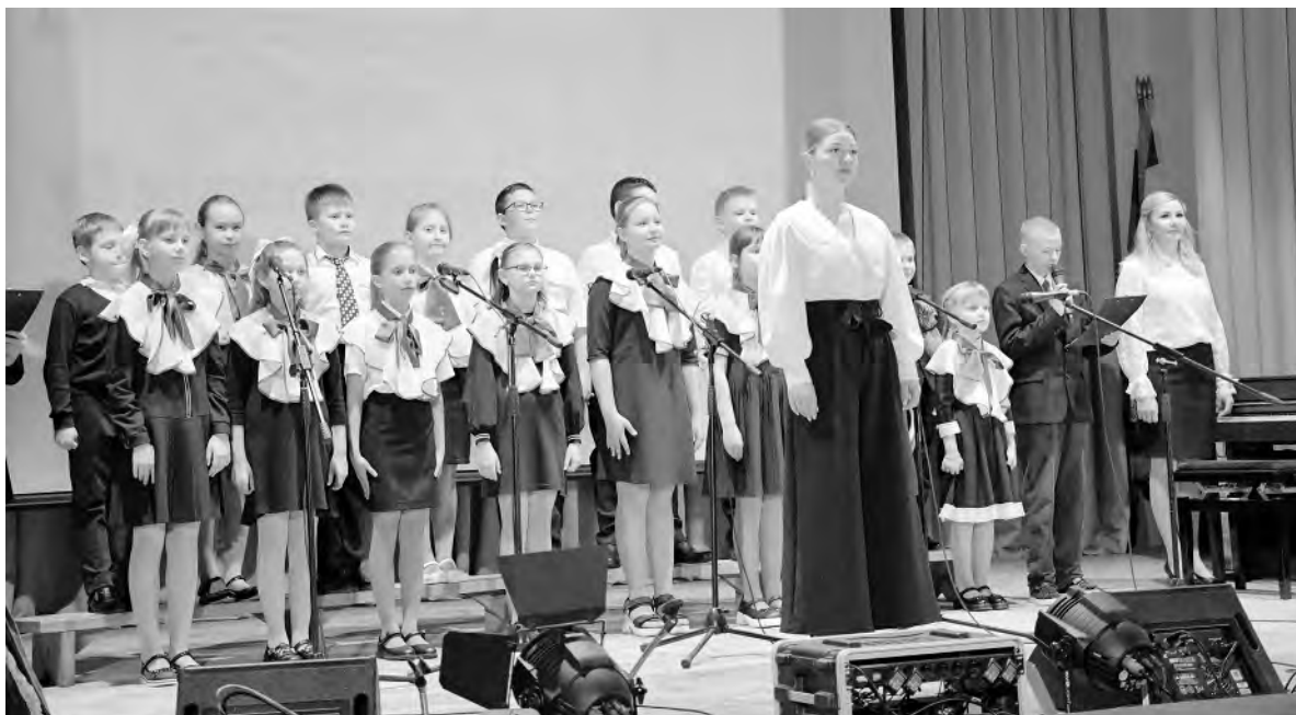
На сцене — детский хоровой коллектив «Акварель».

Впечатлили ростом мастерства хореографические коллективы «Ритм-Данс» и «Карусель», исполнившие композиции «Четыре двора», «Дорожка фронтовая», «Недетское время»,