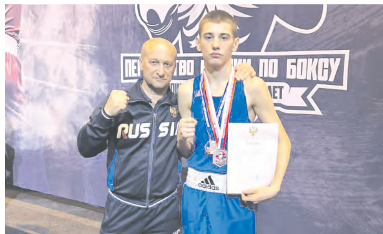
Упорство и настойчивость тренера и спортсмена привели к успеху.

Заря Учредители: министерство общественных коммуникаций Белгородской области; администрация Алексеевского городского округа, администрация Красненского района Белгородской области, Совет депутатов Алексеевского городского округа Белгородской области, муниципальной совет муниципального района «Красненский район», АНО «Редакция газеты «Заря».