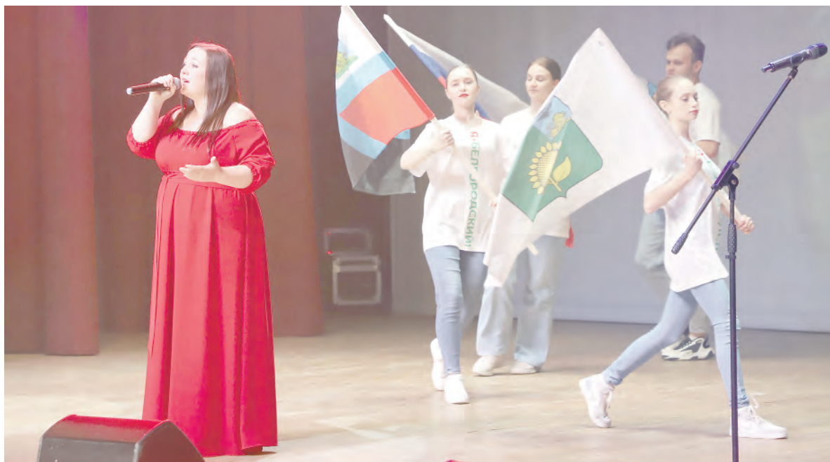
Патриотические песни в исполнении наших артистов пришлись по душе соседям-валуйчанам.