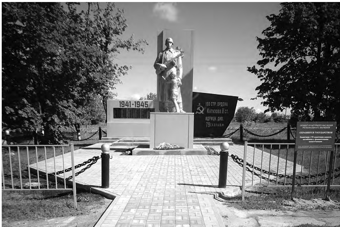
Памятник служит местом притяжения земляков.

милогической обстановкой, небольшая группа представителей администрации сельской территории, а также Совета ветеранов войны и труда, участвовала в церемонии его открытия. Они возложили венки и цветы к подножию памятника.