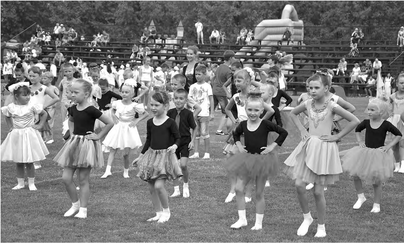
Творческая детвора всегда активна на праздничных мероприятиях, проходящих в муниципалитетах. На снимке — момент прошлогоднего торжественного открытия Дня города в Алексеевке.