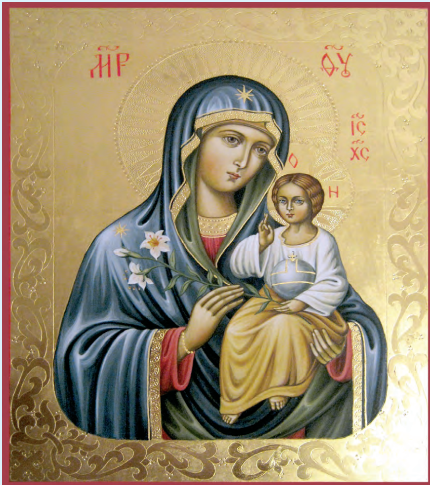
Икона Божией матери Неувядаемый цвет

14 января — Обрезание Господне и память святителя Василия Великого 7 июля — Рождество Иоанна Предтечи 12 июля — Святых первоверховных апостолов Петра и Павла 11 сентября — Усекновение главы Иоанна Предтечи 14 октября — Покров Пресвятой Богородицы