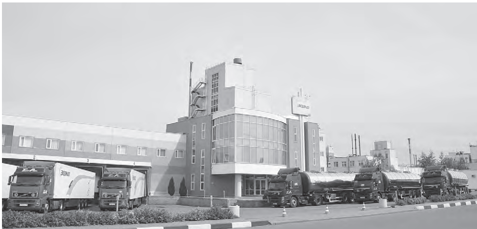
Корпус ООО «Координирующий распределительный центр «Эфко-Каскад».