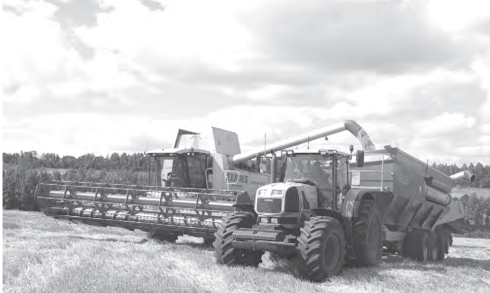
На щедрых красненских полях идёт уборка зерновых.