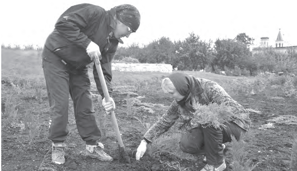
Свой вклад в реализацию программы «Зелёная столица» вносит коллектив Готовской школы.