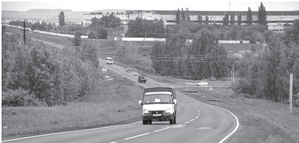
Обновлённая дорога от завода «Химмаш» до магистрали Белгород-Павловск.