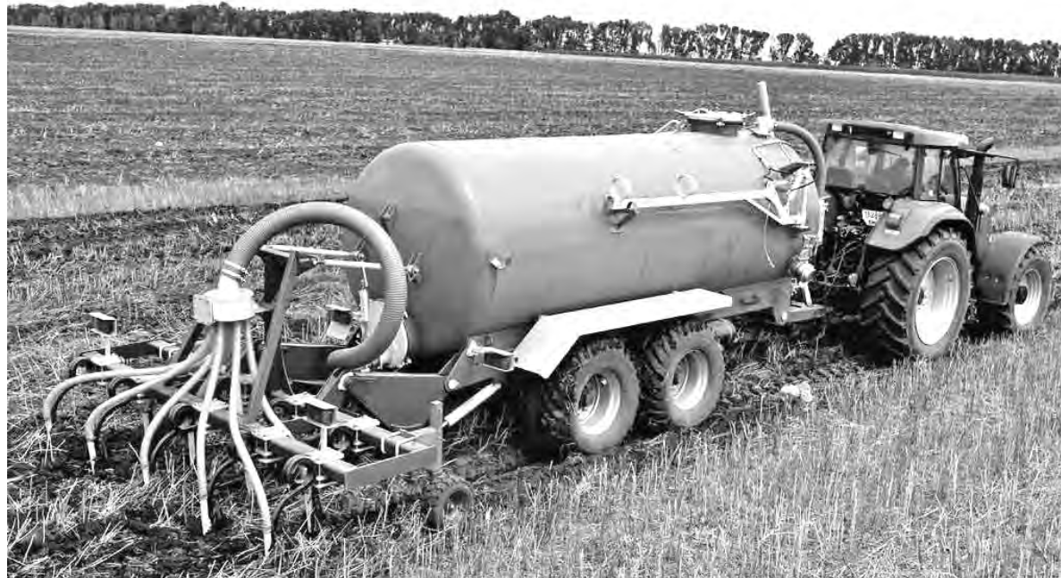
Внесение жидких органических удобрений.

Хозяйства округа ответственно подходят к выполнению данных мероприятий. И на протяжении последних пяти лет