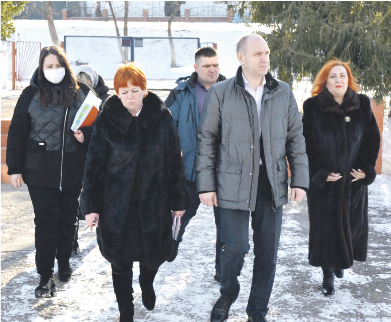
Участники рабочей встречи перед посещением школы в селе Советское.