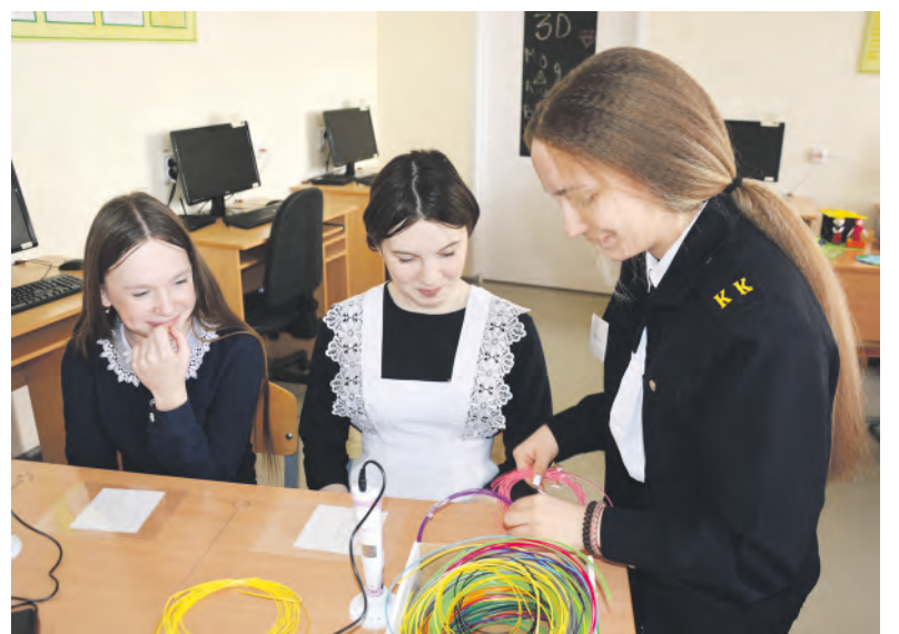
На опытных площадках было интересно всем.

«Кванториум» — это образовательные площадки, оснащённые высокотехнологичным оборудованием, где дети учатся по принципу проектного обучения: от теории сразу к практике. Знакомство с образовательными модулями проходит групповым методом: школьники сменяют друг друга на этапах, и за счёт этого каждому участнику удаётся попробовать свои силы в различных направлениях современных технологий.