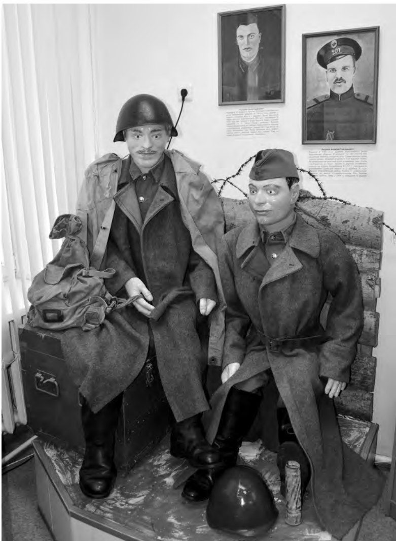
Инсталляция «Солдаты на привале».

В третьем зале музея установлен сенсорный стол, с помощью которого посетители могут получить подробную информацию об экспонатах, посмотреть виртуальный маршрут к братским могилам и кругловским оборонительным сооружениям, а также ознакомиться с исследовательскими работами по данной теме.