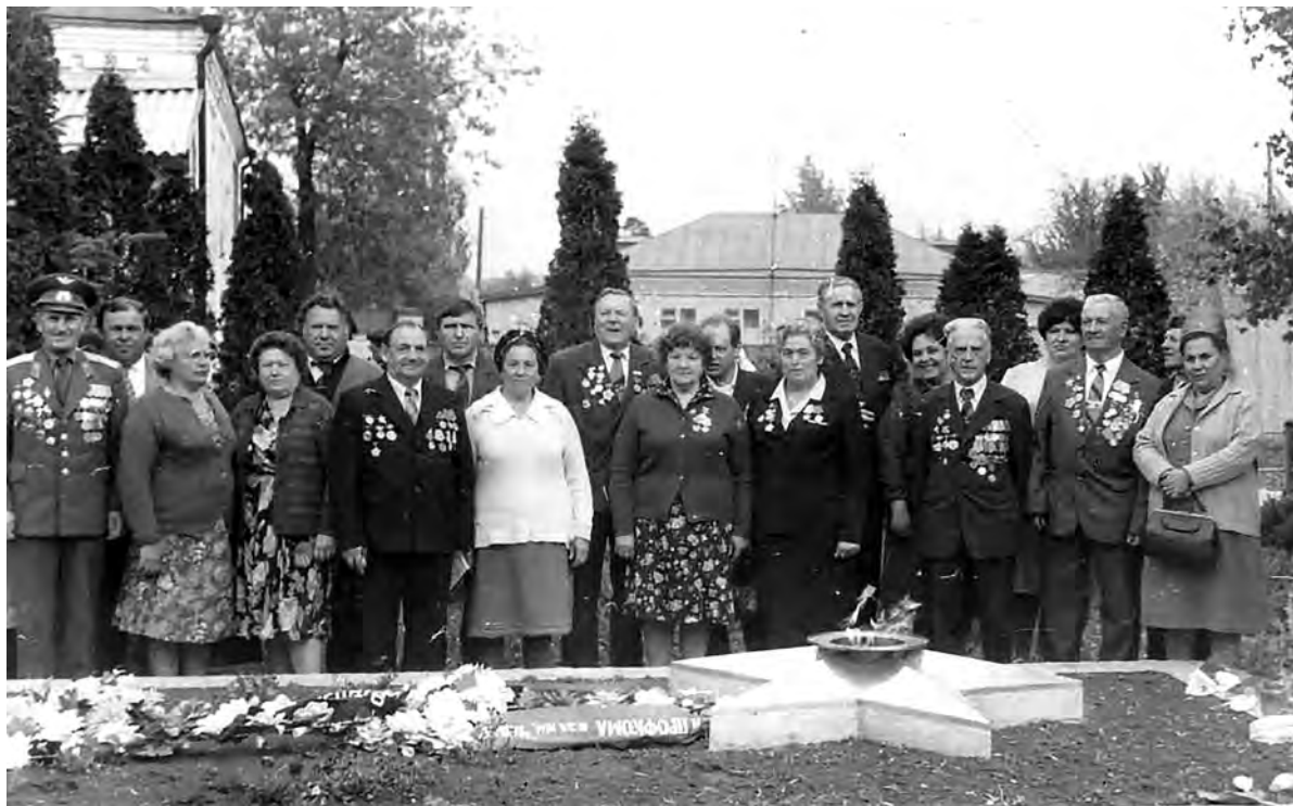
Ветераны 82-го бомбардировочного авиационного полка вместе с иловцами на Дне Победы. 1986 год.