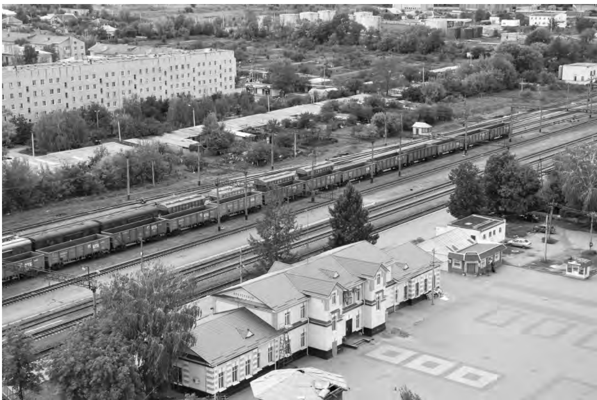
Это же место. 2016 год.