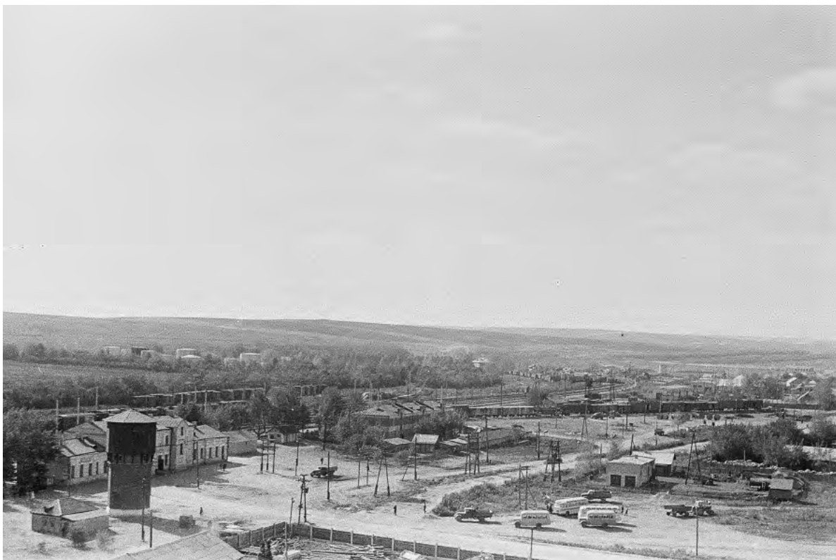
Железнодорожный вокзал. 1970-е гг.