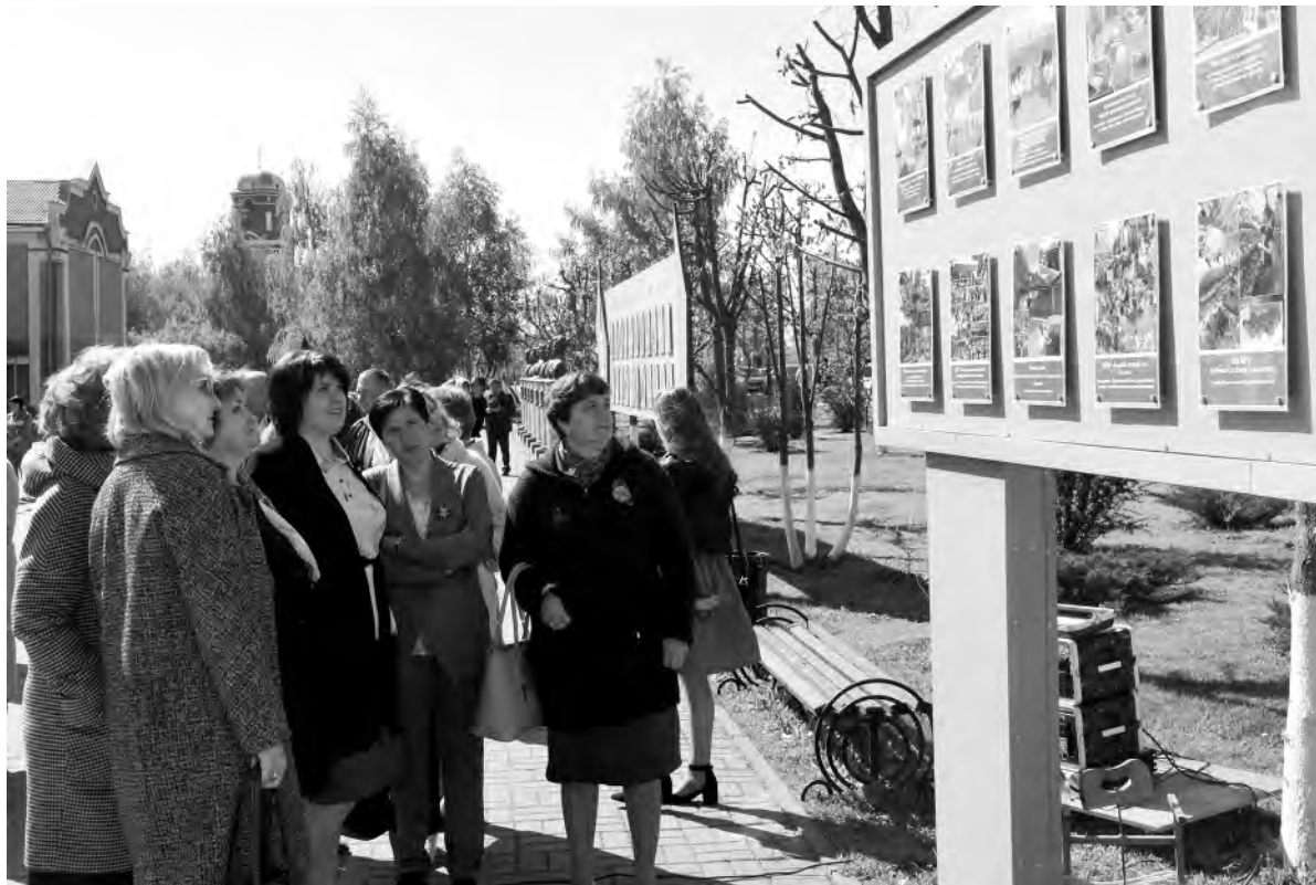
На церемонии открытия районной Доски Почёта было многолюдно.