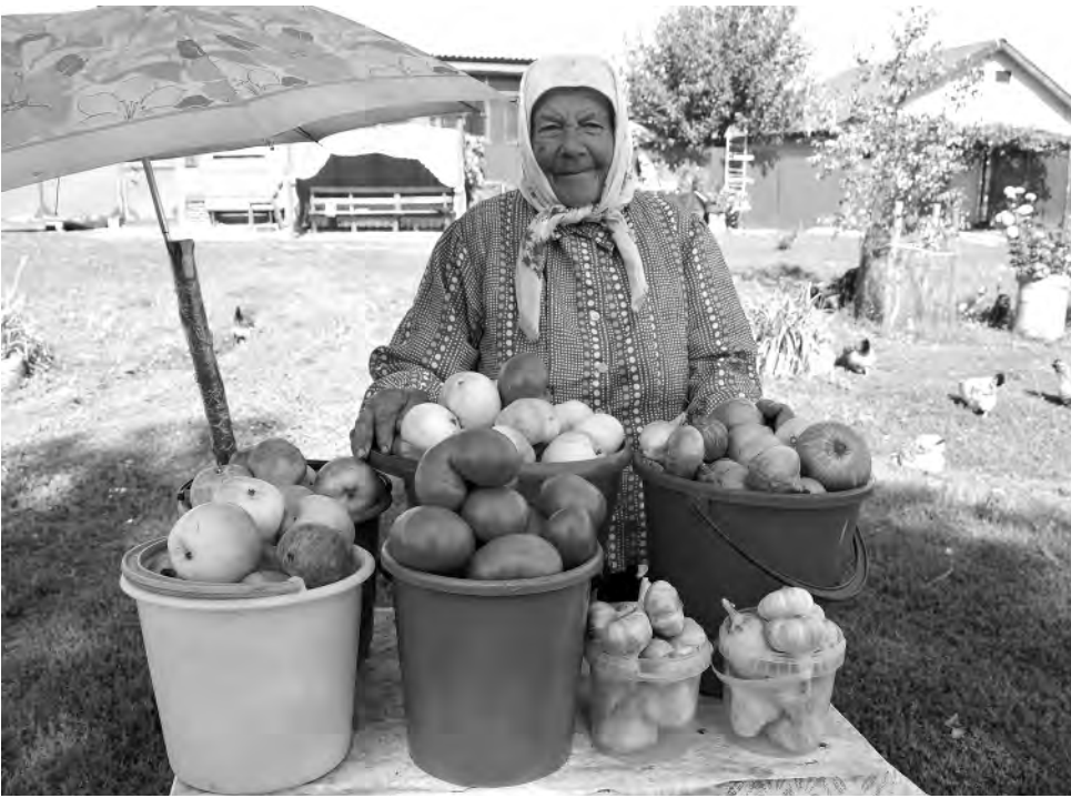
Вера Яковлевна уверена, что труд и движение способствуют долголетию.