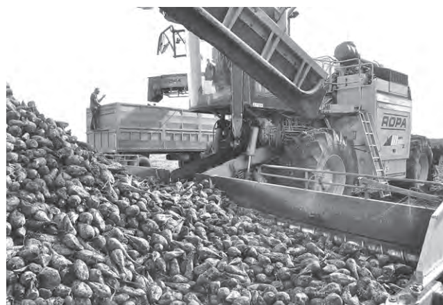
Действует погрузочный агрегат.