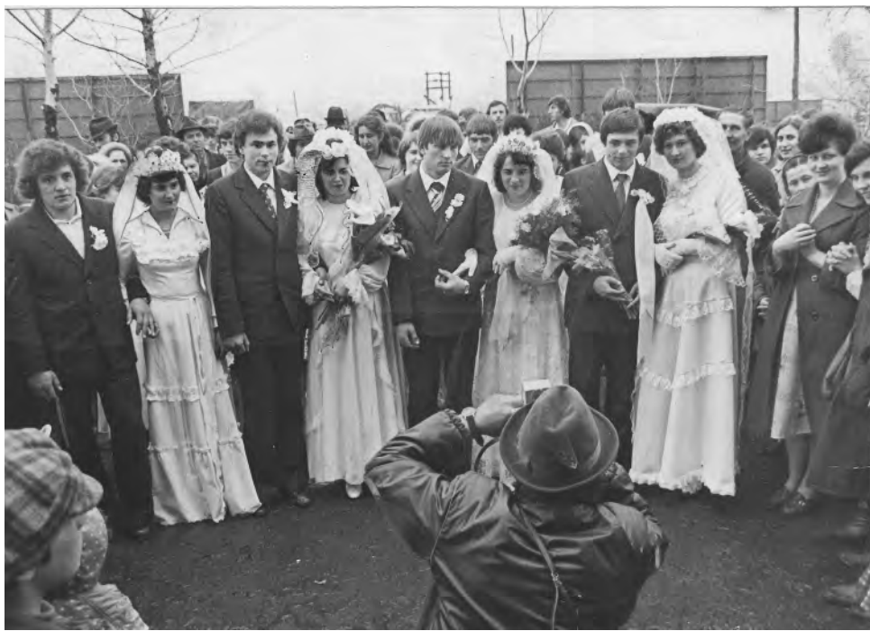
Редкий снимок из архива, когда в один день регистрировали четыре пары новобрачных.