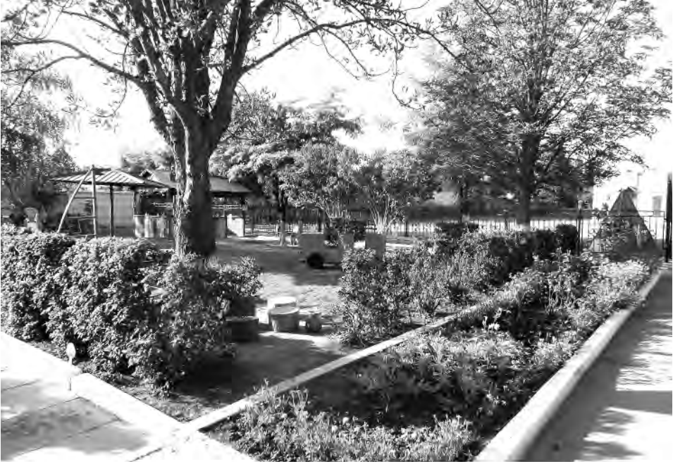
Каждый уголок двора детского сада № 9 является привлекательным.