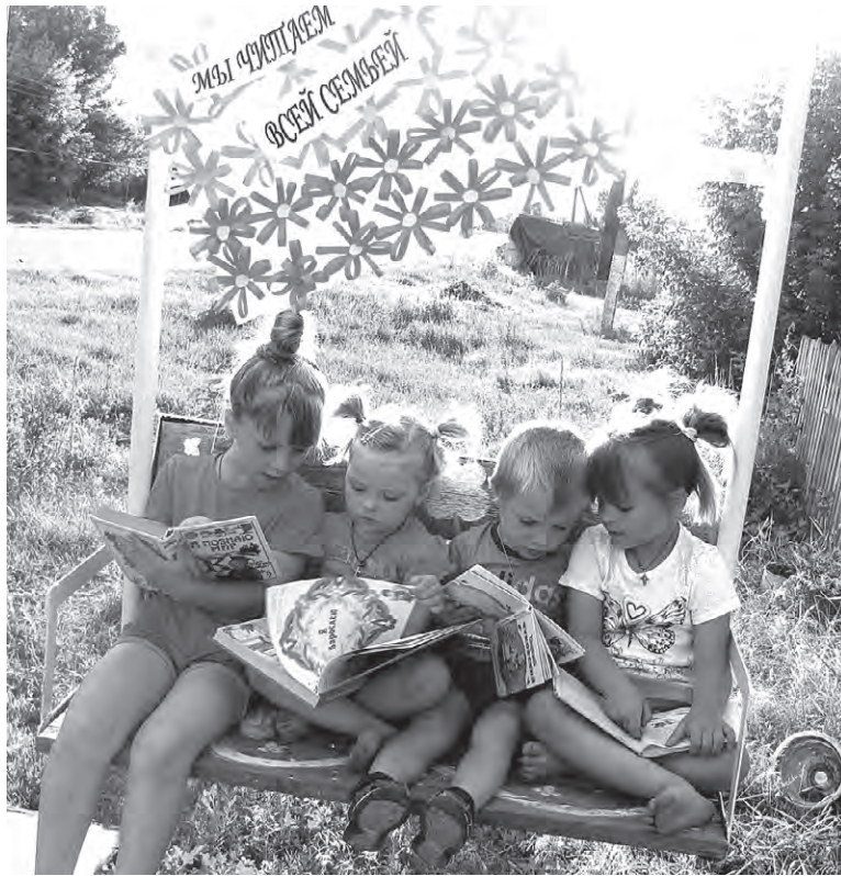
С книгой везде интересно, считают юные читатели из Горок.