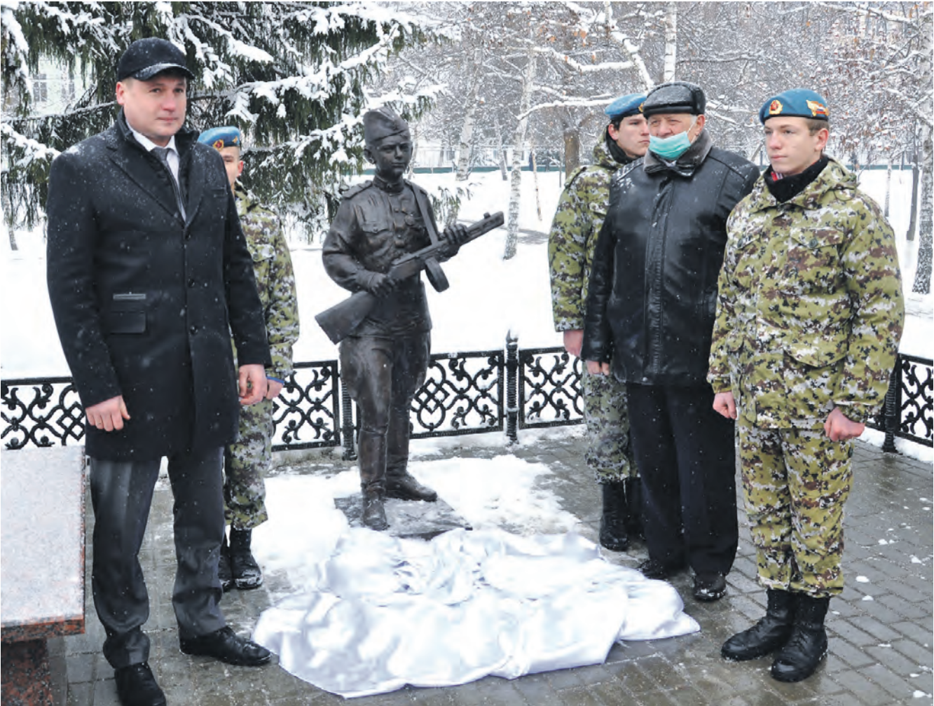
В день освобождения Алексеевки на мемориале Никольской площади открыли памятник юному бойцу.