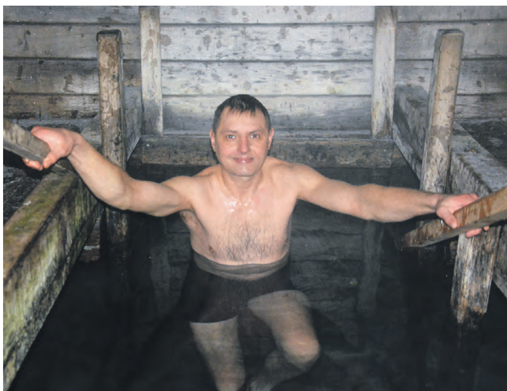
Многие красненцы совершили обряд полного омовения водой.