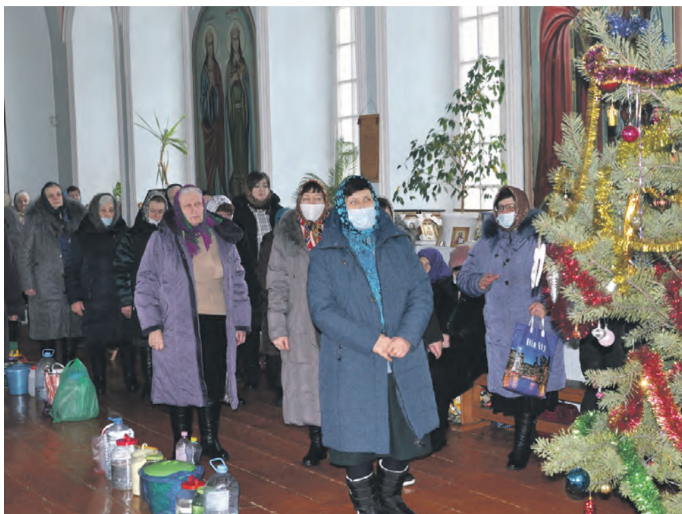
Прихожане Покровского храма на службе.