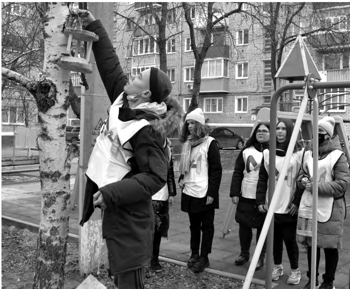
Волонтеры развесили несколько кормушек во дворах многоэтажек.

Увидев в Европе скворечники и кормушки, он не преминул в обязательном порядке ввести их на Родину. Это голландская забава сразу прижилась. Ведь на Руси всегда любили малых птах, селившихся рядом с человеческим жильём, считали их божьими созданиями и добрыми вестниками.