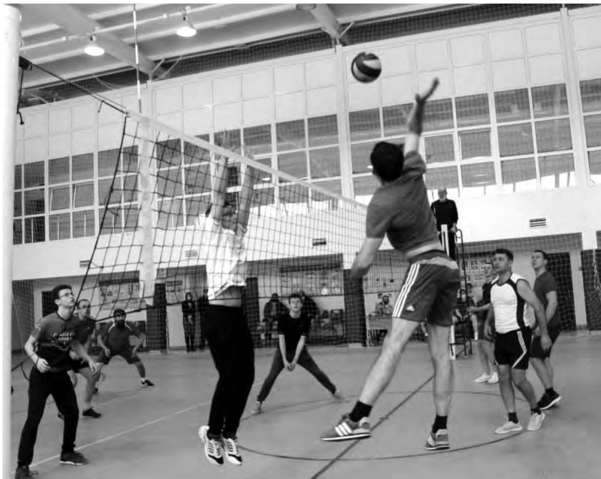
Острые моменты игры.