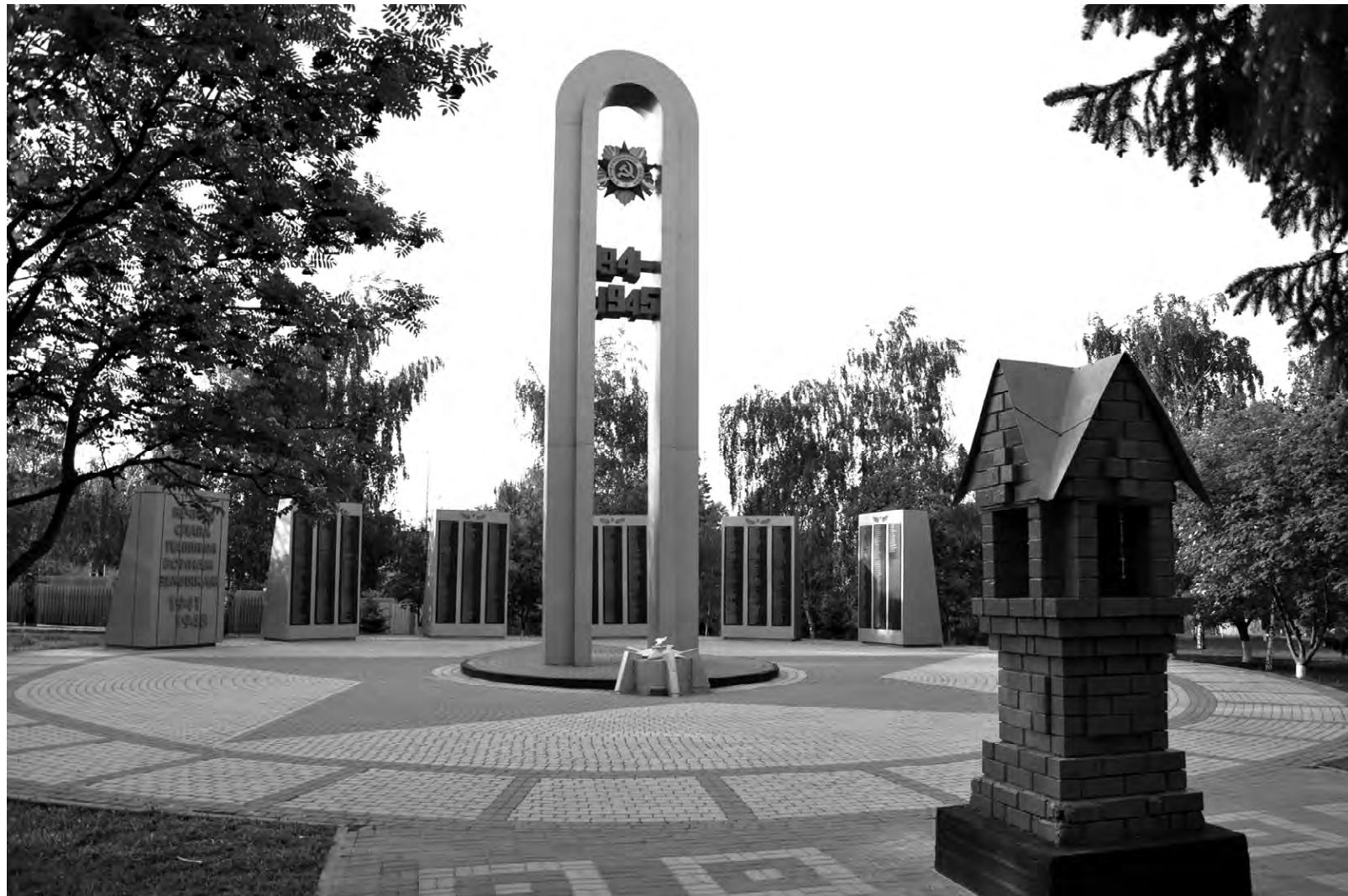
Мемориал Солдатской славы в Алексеевке. Снимок 2019 года.

Когда в День Победы алексеевцы приходят сюда под траурные мелодии акции «Свеча