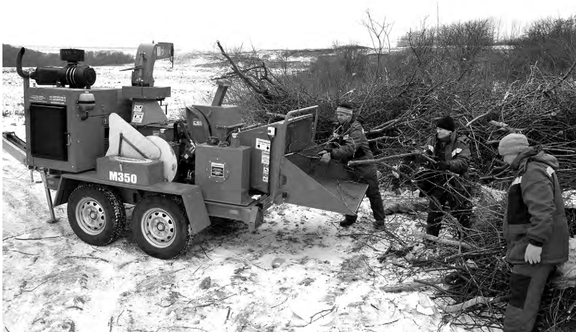
Мощный измельчитель «Торнадо-350» способен легко и быстро перерабатывать ветки деревьев и кустарников.