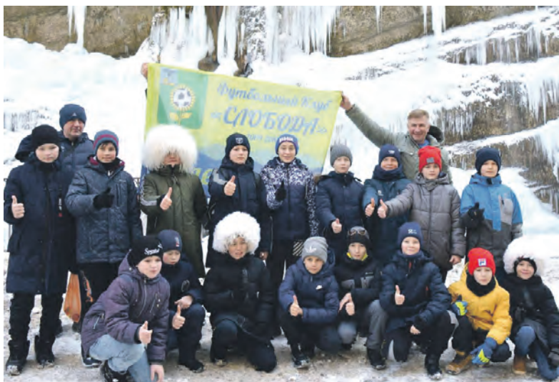
На Кавказском турнире юная «Слобода» заняла пятое место.