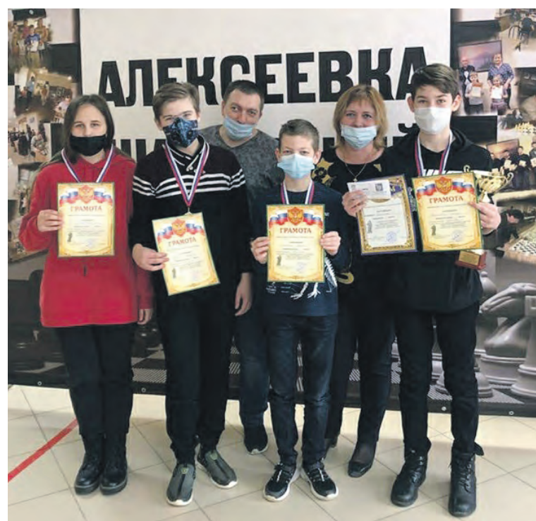
Победители турнира на Кубок главы администрации горокруга.

Заря Учредители: департамент внутренней и кадровой политики Белгородской области; администрация Алексеевского городского округа, администрация Красненского района Белгородской области, Совет депутатов Алексеевского городского округа Белгородской области, муниципальной совет муниципального района «Красненский район», АНО «Редакция газеты «Заря».