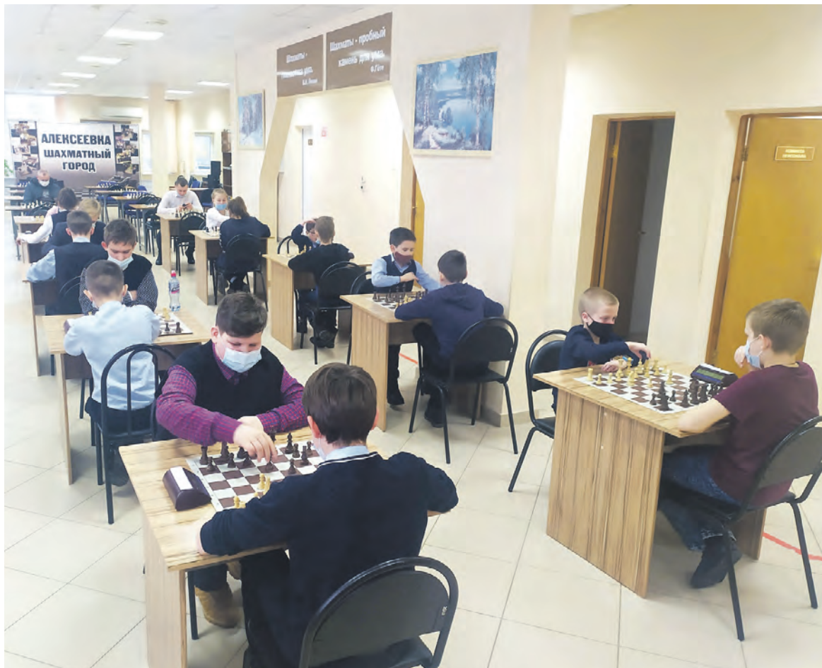
Турнир «Белая ладья» собрал в шахматном клубе 10 школьных команд.