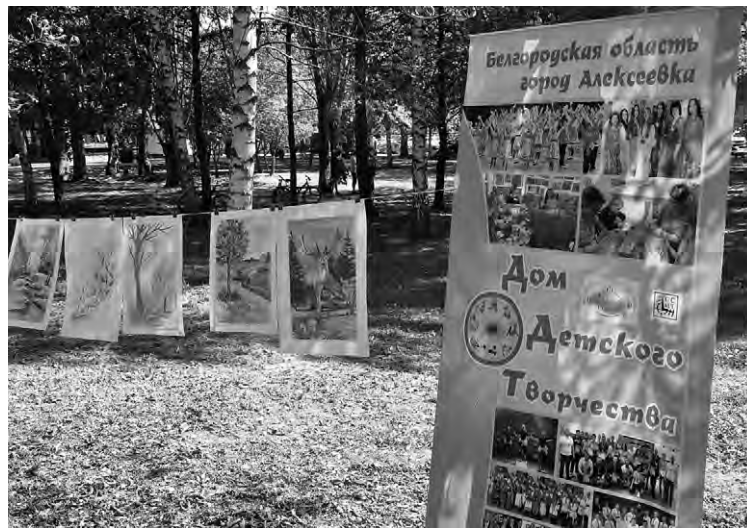
Одна из выставок — работы юных художников.