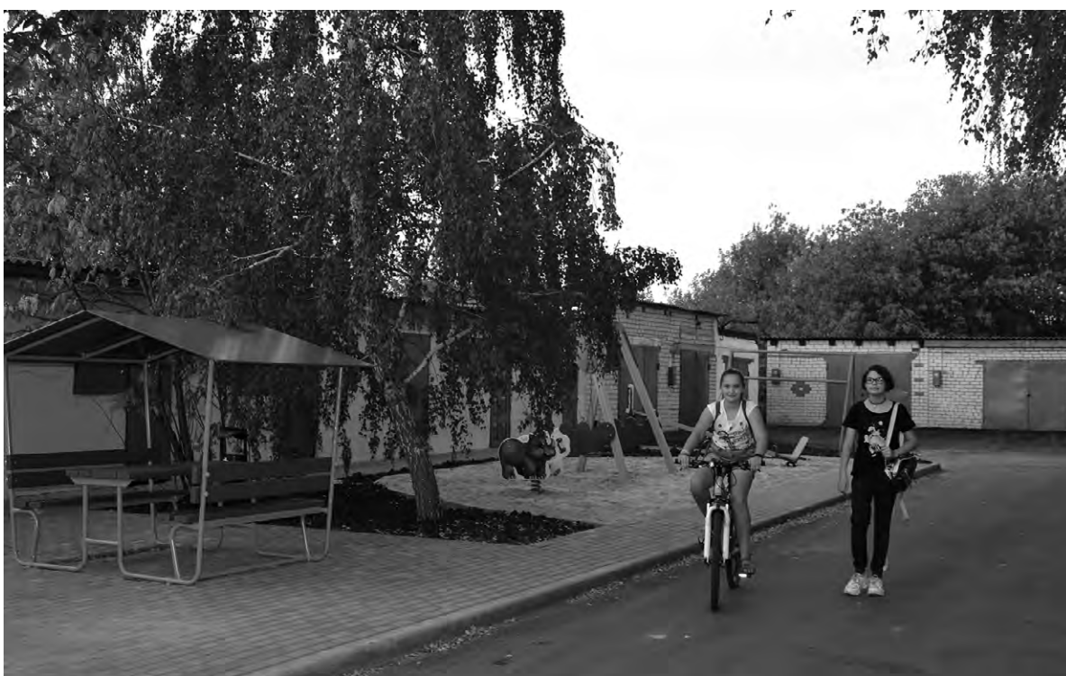
Результат работ по благоустройству радует глаз.

Примеров тесного взаимодействия районной власти и населения можно привести немало. В сёлах Сетище и Большое на некоторых улицах, где имеется интенсивное движение транспорта, отсутствовали тротуары для пешеходов. Недавно этот важный вопрос был также решён за счёт средств районного бюджета. Администрация района выделила деньги, а местные дорожники быстро проложили