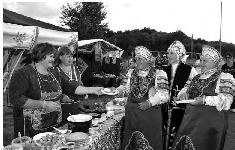
Горячие блины и душистый чай были всем по вкусу.