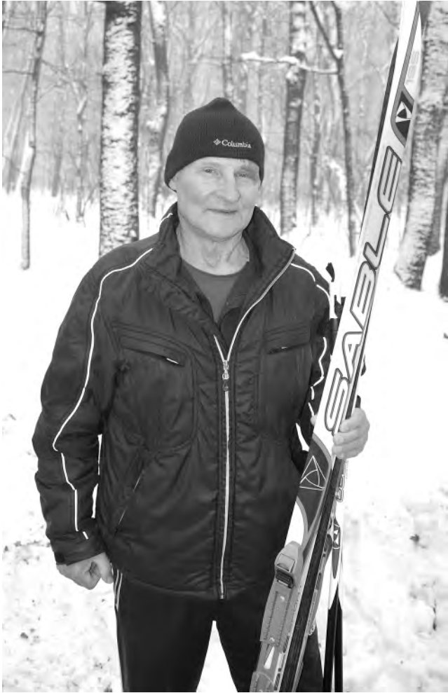
Зимой ветеран спорта не прочь пробежать на лыжах.

На возраст ветерана спорта старается не обращать внима-