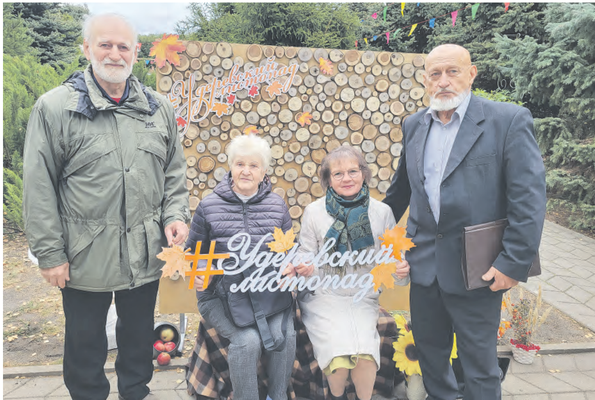
Представители делегации из Красненского района — постоянные участники фестиваля «Удереvский листопад».

Первый фестиваль «Удереvский листопад» прошёл 9 октября 1998 года. Он положил начало ежегодному литературно-музыкальному празднику, на который стали собираться поэты и писатели, художники и музыканты, театралы и литераторы, творческие люди. Он стал первым фестивалем поэзии на Белгородчине.