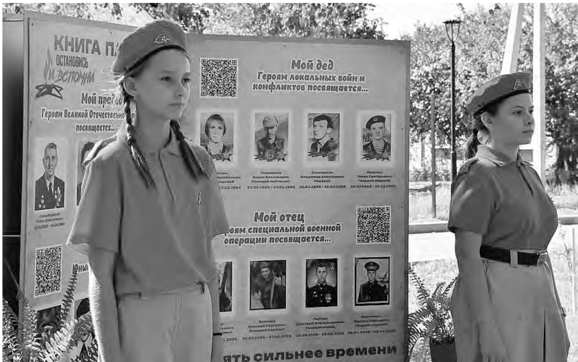
Учащиеся средней школы № 4 несут почётный караул возле Книги памяти.

Ирина БУЛГАКОВА.