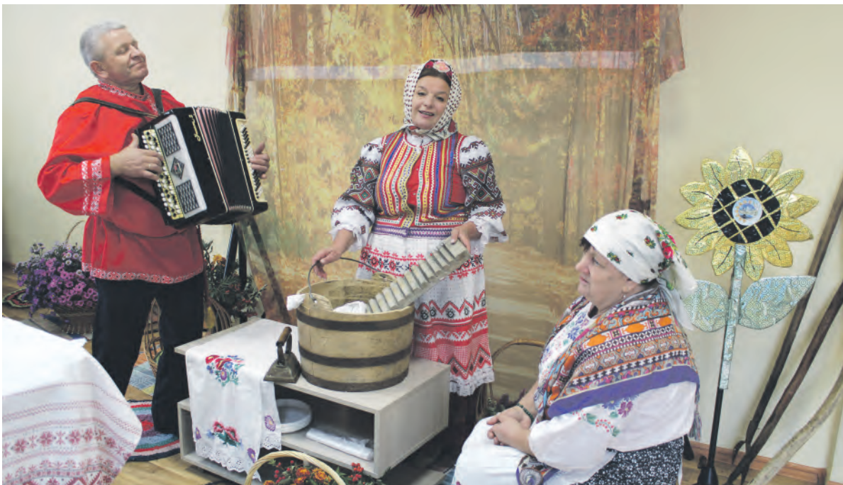
Инсталляцию крестьянского быта представили работники культуры из Иващенкова.

Заря Учредители: министерство общественных коммуникаций Белгородской области; администрация Алексеевского городского округа, администрация Красненского района Белгородской области, Совет депутатов Алексеевского городского округа Белгородской области, муниципальной совет муниципального района «Красненский район», АНО «Редакция газеты «Заря».