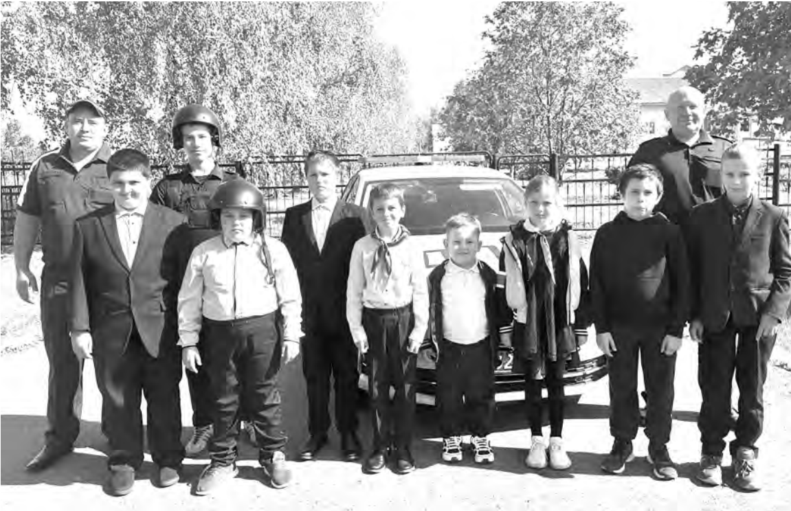
Учащиеся школы узнали много нового о поведении на дорогах.