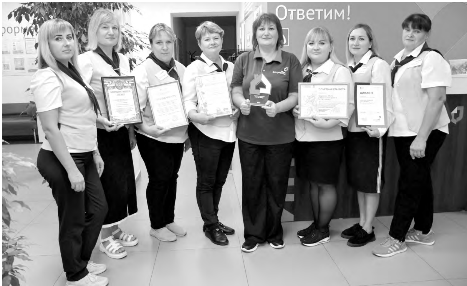
Эта дружная команда ежедневно помогает красненцам оформлять необходимые документы.

В центре работают восемь специалистов. Из шести окон ежедневно принимают четыре, а когда необходимо, включается и пятое. За истекший год они приняли около 12 тысяч заявлений, в среднем по 50 штук в день. Слаженная команда работает результативно, грамотно и без нареканий. Неслучайно в этом году Красненское отделение № 20 заняло в региональном конкурсе первое место в номинации «Лучшее отделение» в категории «Малые МФЦ». Кстати, победителями красненцы становятся уже во второй раз за последние