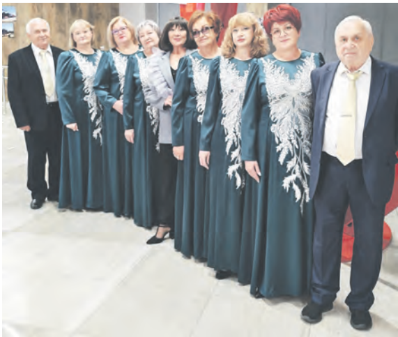
Соб. инф. Фото паблика Центра культурного развития «Солнечный» ВКонтакте.

Этот праздник музыки и памяти, посвящённый 80-летию Великой Победы, распахнул двери для талантливых артистов старшего поколения, чьи голоса хранят эхо истории.