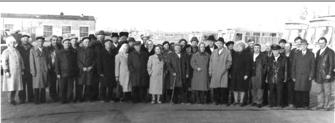
На этом снимке 1987 года запечатлены работники алексеевской автоколонны № 1467 — ведущей в то время автотранспортного предприятия города и района. Водители грузовых машин и пассажирского транспорта, таксисты и инженерно-

технические работники собрались на профессиональный праздник — День автомобилиста. За их спинами справа — автобусы отечественных и венгерских марок. Сегодня на базе бывшего предприятия располагается ЗАО «Движение».