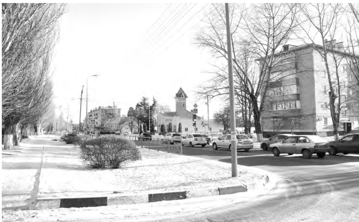
Это же место в наши дни.