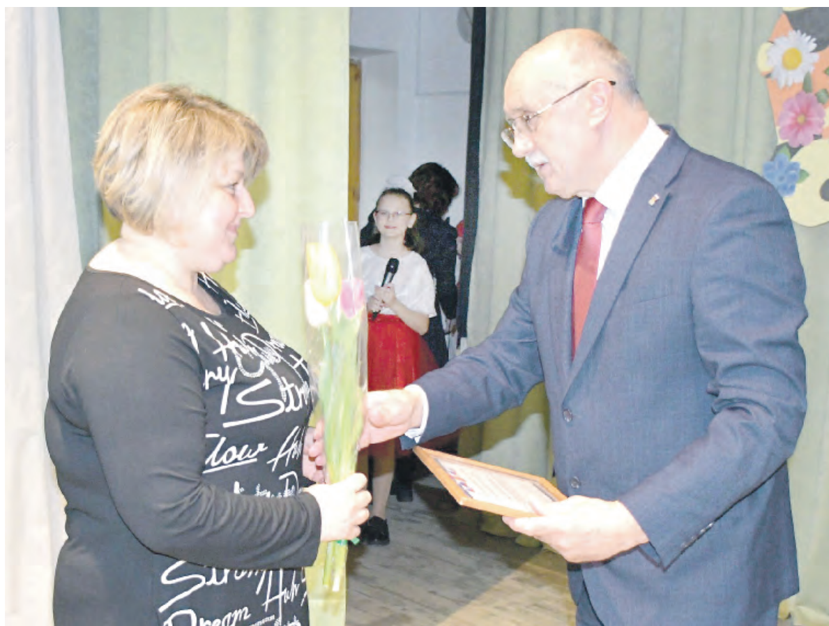
Все комплименты — в адрес женщин.

Заря Учредители: министерство общественных коммуникаций Белгородской области; администрация Алексеевского городского округа, администрация Красненского района Белгородской области, Совет депутатов Алексеевского городского округа Белгородской области, муниципальный совет муниципального района «Красненский район», АНО «Редакция газеты «Заря».