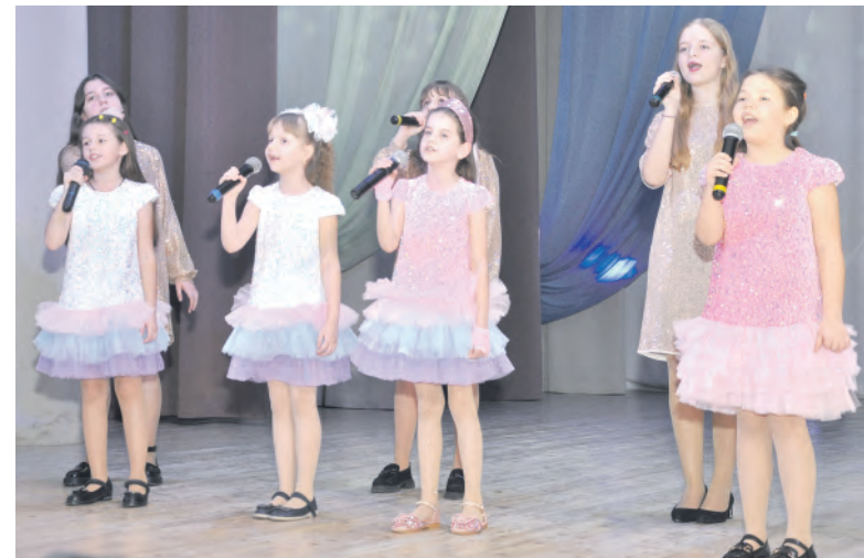
Юные артисты поздравили алексеевских зрителей с женским днём.