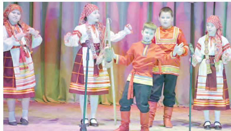
Выступают воспитанники фольклорного отделения Красненской детской школы искусств.