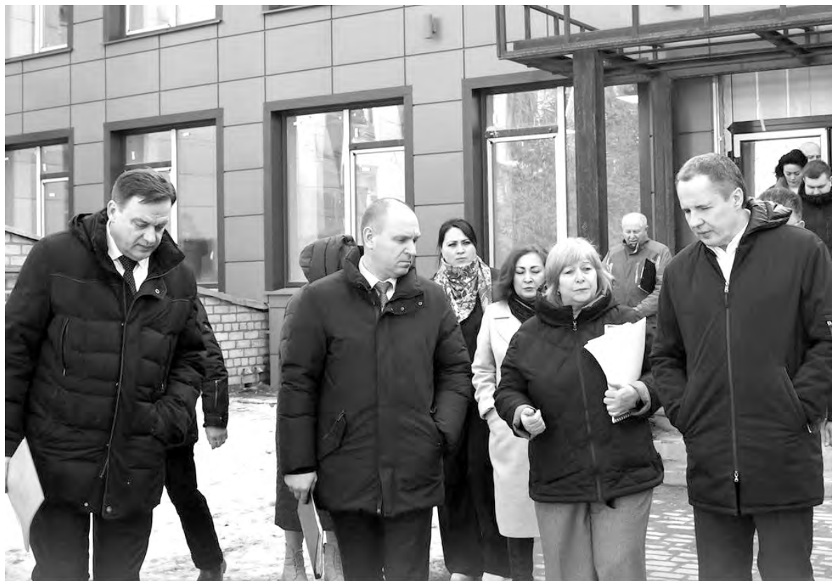
Губернатор Белгородской области Вячеслав Гладков и глава администрации городского округа Алексей Калашников проинспектировали ход капитального ремонта школы № 4.