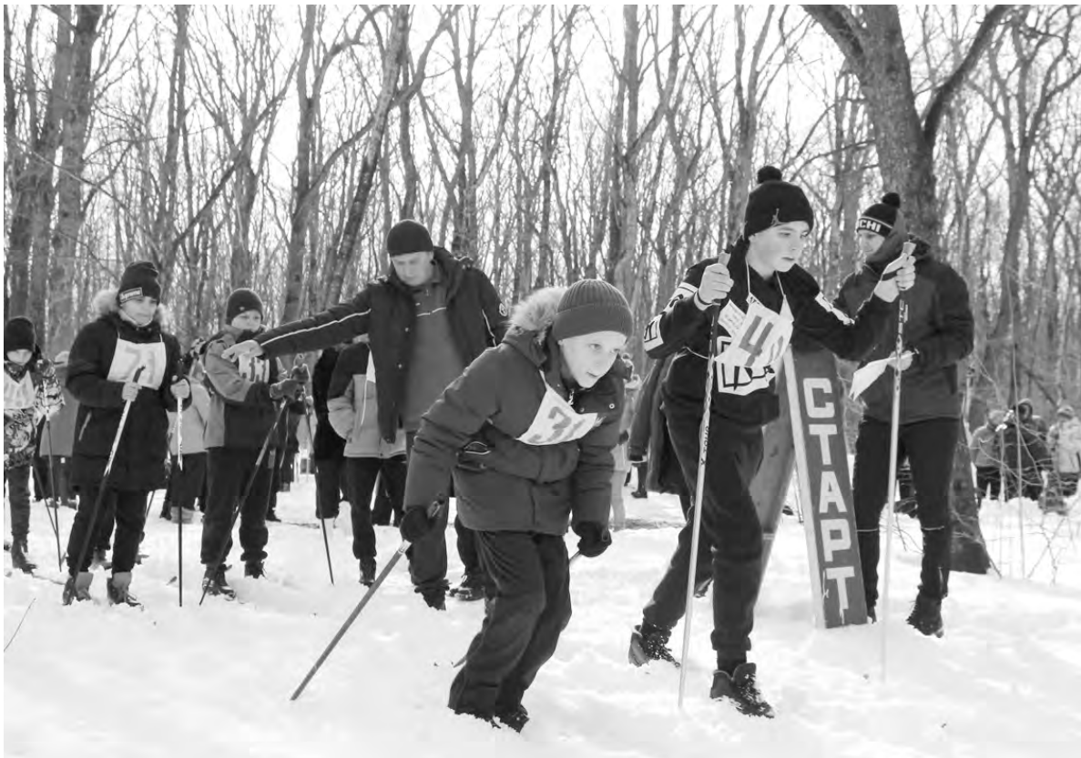
На красненской лыжне царил азарт и здоровый дух.