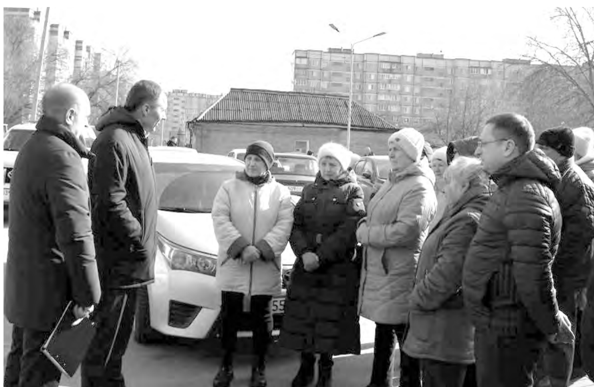
Руководитель региона и глава администрации муниципалитета пообщались с жильцами дома № 50 по улице Степана Разина.

Текст и фото пресс-службы администрации Алексеевского городского округа.