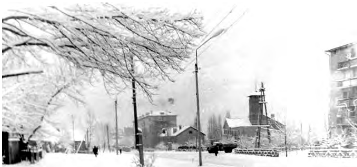
Ул. Мостовая (К. Маркса). 1970-е годы.