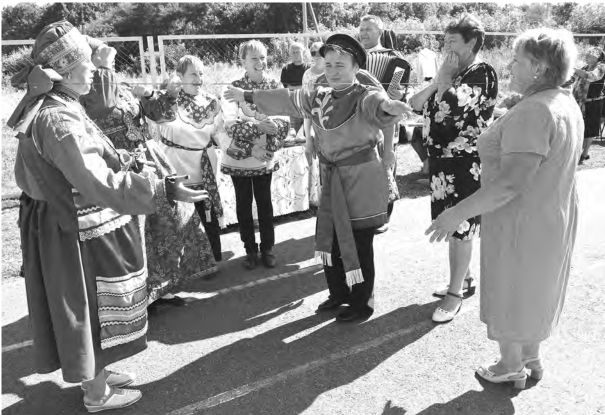
Пятый межрайонный фестиваль посетили более 70 участников. Гости приехали даже из Вологодской области.