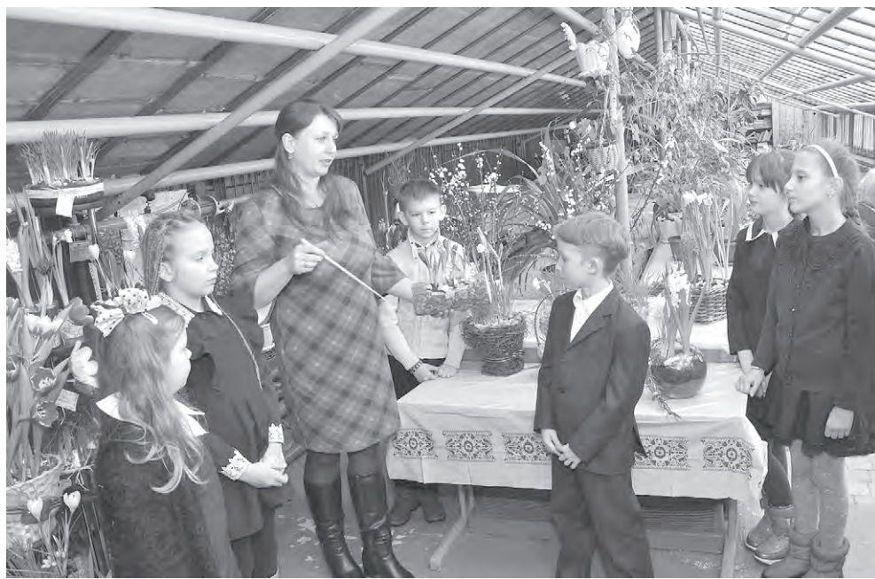
Выращенные своими руками цветы — благодарность ветеранам Великой Отечественной войны.