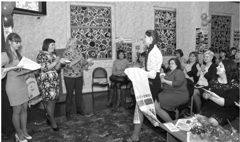
На встрече царила тёплая атмосфера.

заведующая дошкольным отделением Алексеевского колледжа.