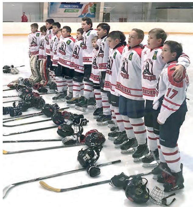
«Невскому-05» покоряются новые вершины.

В начале марта состоится полуфинальный турнир первенства ЦФО, в котором примут участие наша ледовая дружина и команды-чемпионы Воронежской, Тверской, Ярославской и Калужской областей, а также коллектив, занявший второе место в открытом первенстве Московской области. Только победитель выйдет в финал, где уже обе-