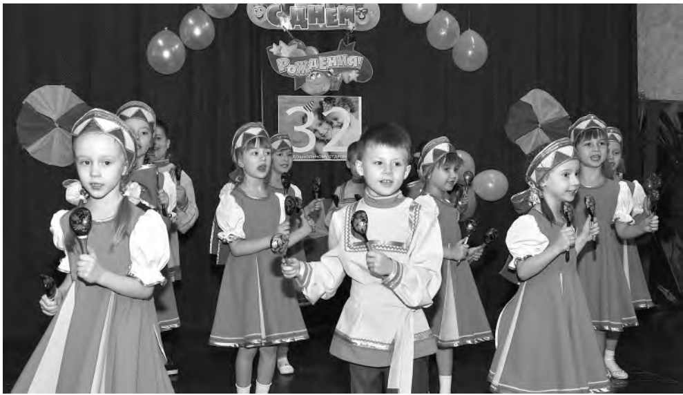
Поздравления от воспитанников детского сада № 17.

В Алексеевском колледже прошёл вечер-встреча «Страницы прошлого листая...». Мероприятие было посвящено 32-й годовщине дошкольного отделения.