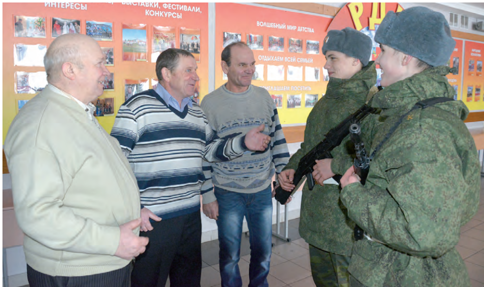
Красненским «афганцам» было что рассказать воспитанникам военно-патриотического клуба «Пересвет».