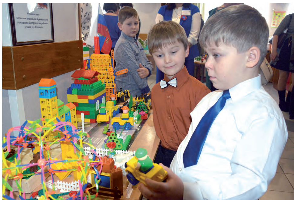
Юные техники из детского сада «Капелька».