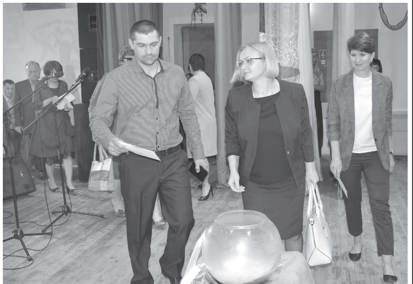
Первый вклад в копилку благотворительного марафона.