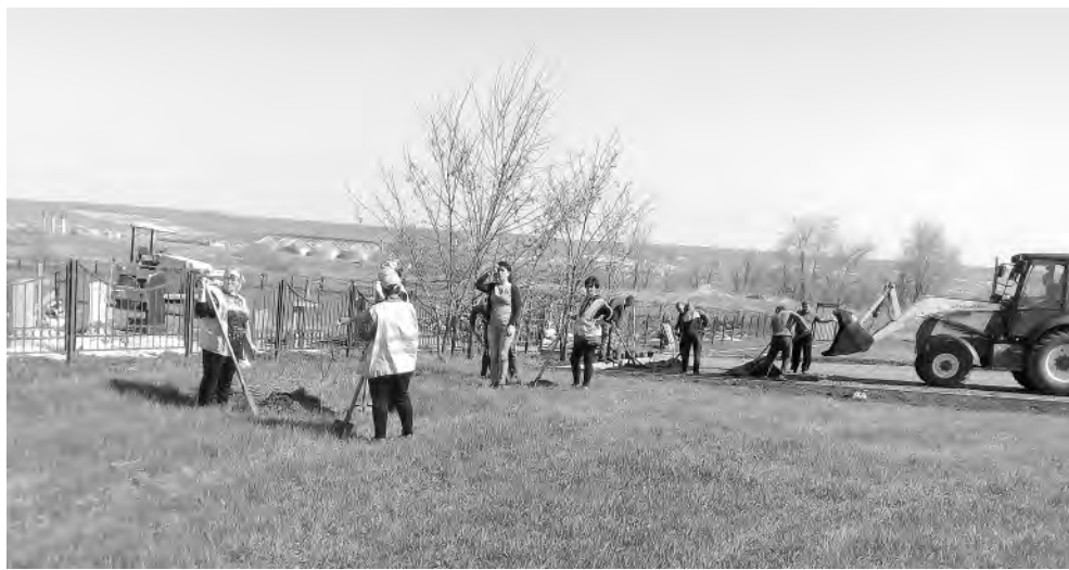
Уборка территории, прилегающей к погосту.

В соответствии с решением земского собрания Хрещатовского сельского поселения от 10 мая 2018 года № 1 сообщение, опубликованное в межрайонной газете «Заря» от 20 марта 2018 года №№ 42-43 (13067) «Об объявлении конкурса на замещение должности главы администрации Хрещатовского сельского поселения муниципального района «Алексеевский район и город Алексеевка» Белгородской области», считать недействительным.